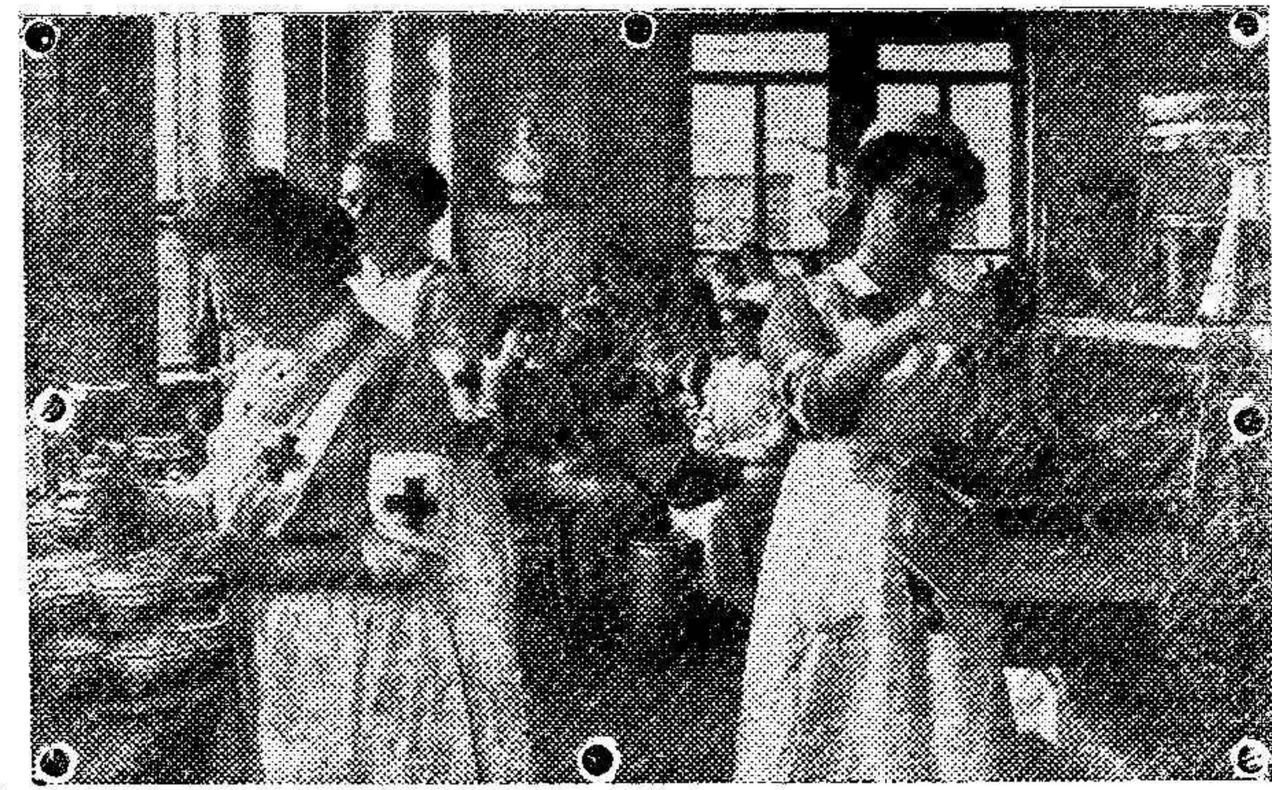
Señoras alemanas de la Cruz Roja preparando conservas para las provisiones de campaña.