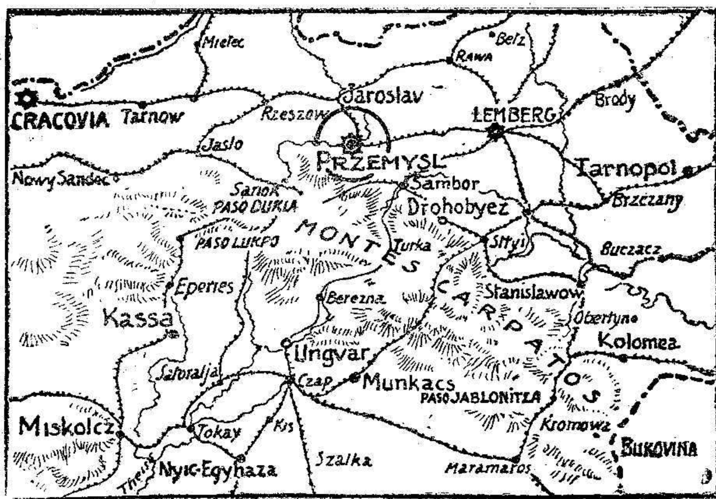
Przemysl y la región de los Cárpatos donde se libran sangrientos combates

NO SE DEVUELVEN LOS ORIGINALES - - - NÚM. 9.268