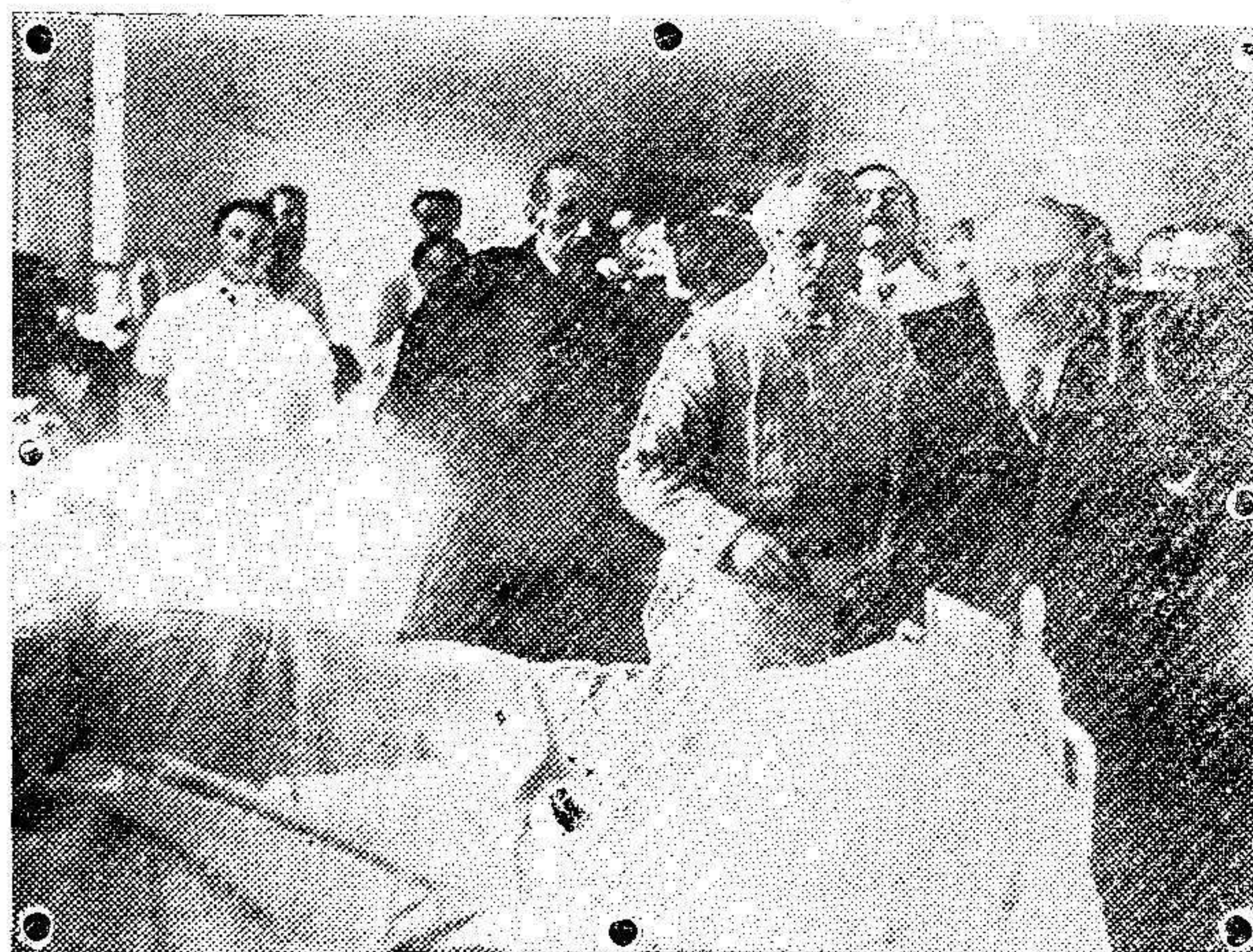
El Presidente de la República francesa visitando uno de los hospitales de París.