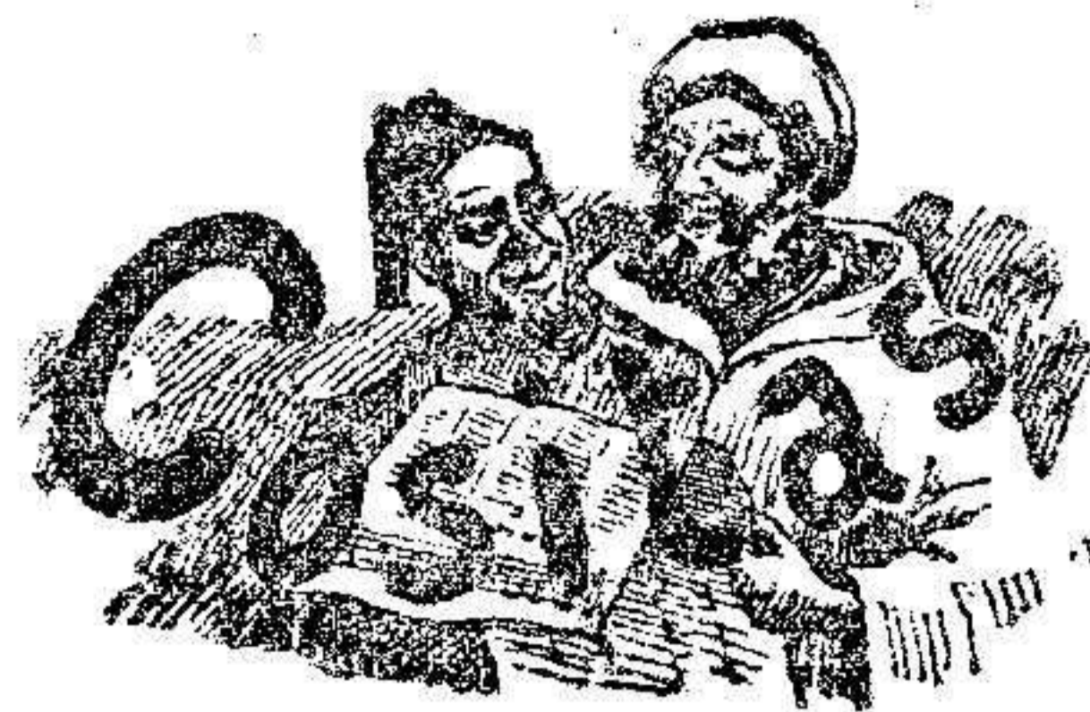
Villancicos reformados, corregidos y aumentados.

La que se dijo en la Iglesia parroquial, estuvo bastante concurrida. Fué escuchada con gran recogimiento