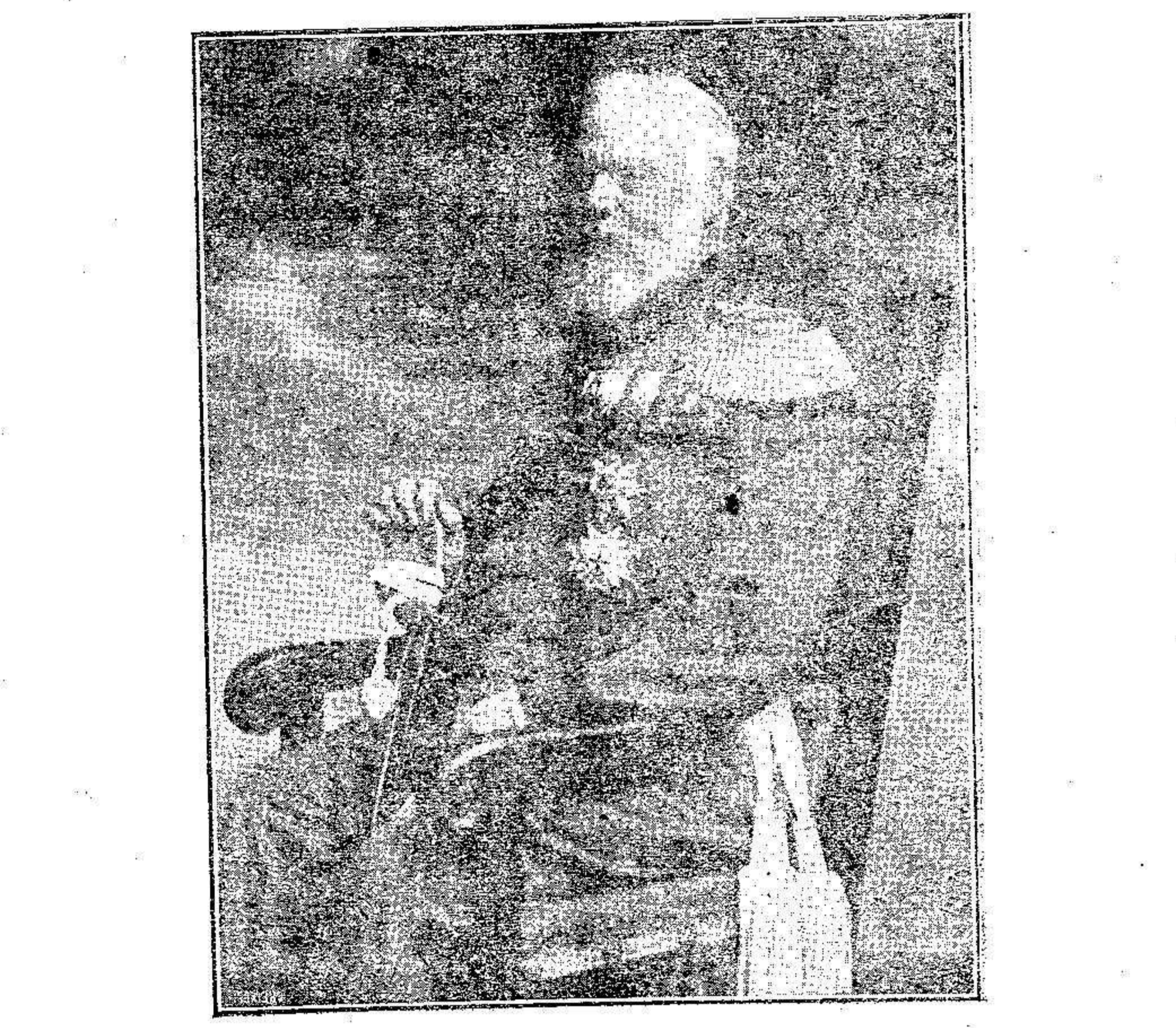
El príncipe regente de Baviera, que por acuerdo del consejo de Estado ocupará el trono de la Nación