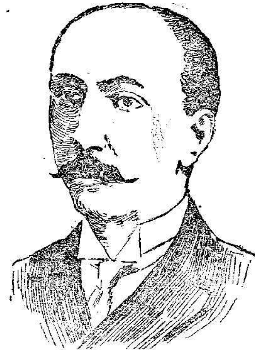
Sr. Marqués de Lema, nuevo ministro de Estado.

Cumpliendo lo dispuesto por S. E. el Comandante General, hoy saldrá de Ras el Medua la columna móvil que hasta ahora estuvo allí acampada, quedando solamente dos compañías del Regimiento de África, en el Reducto.