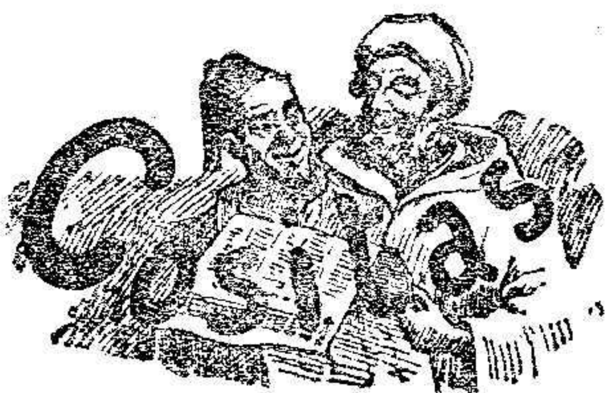
Sobre un mitin