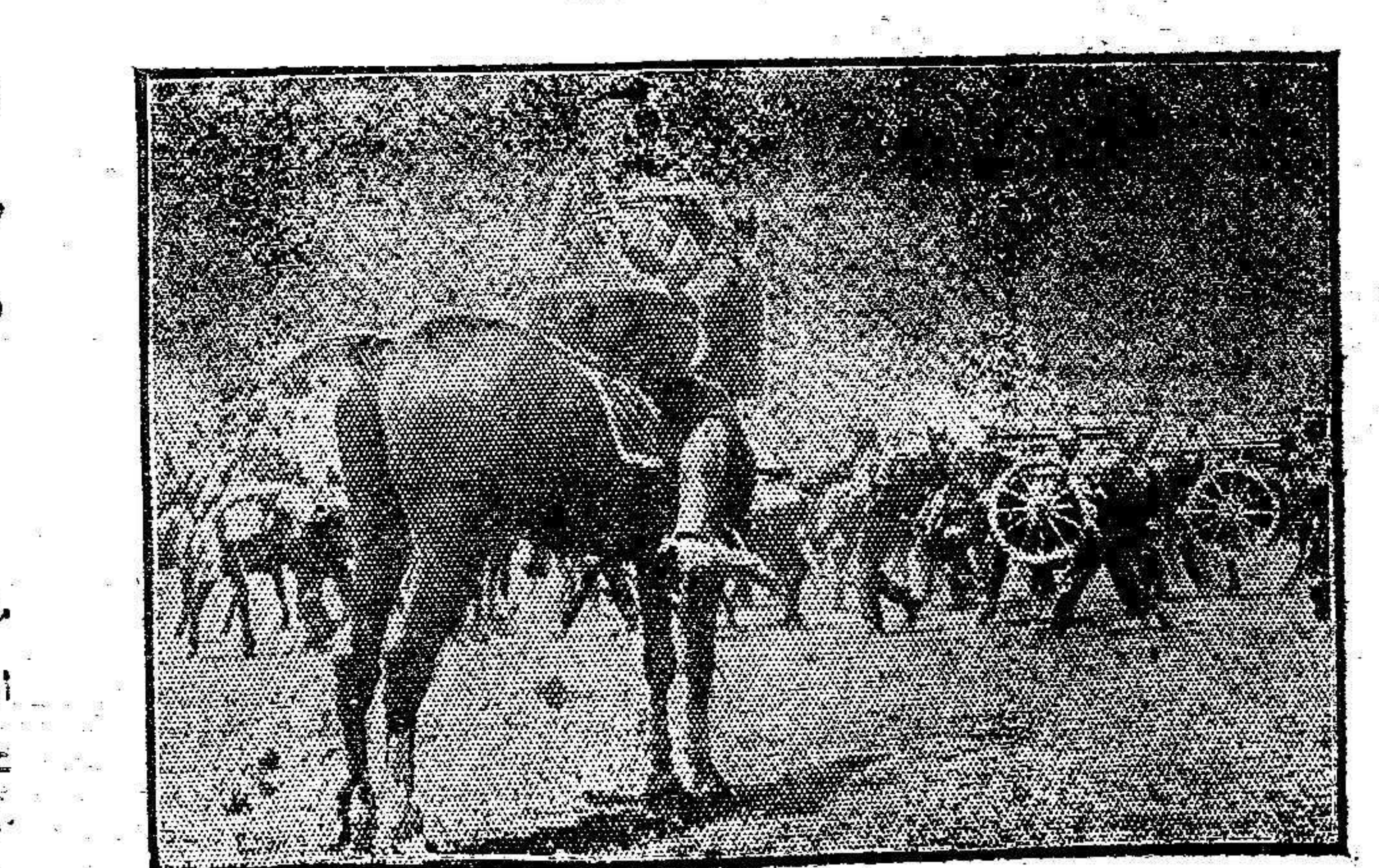
El «diadoque» pasando revista á las tropas que marchan hacia Salónica.

El presente número consta de seis páginas y vale 5 CENTIMOS.