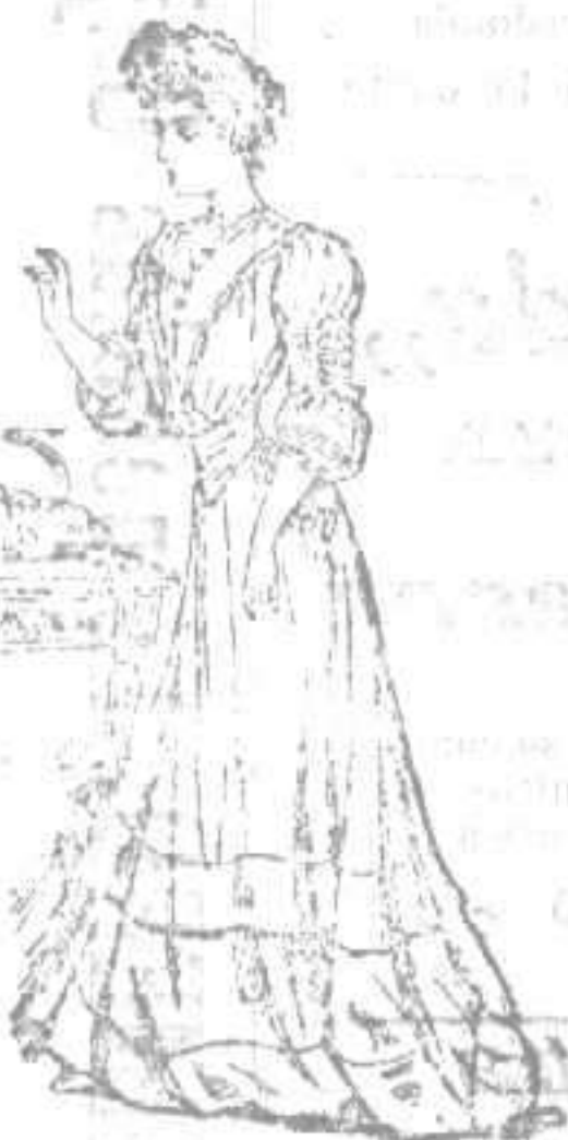
Traje para recibir

Cuerpo lindamente adornado, cuya especialidad son las mangas. Falda amplia, con volantes.