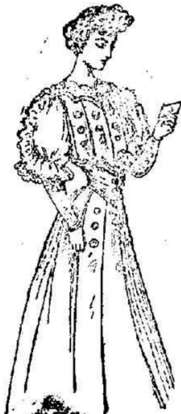
Vistosísimo traje para recibir

Cuello aplanado, con descote, formando diversas angulaciones de encje, que se prolonga en distintas series de botones rodean-