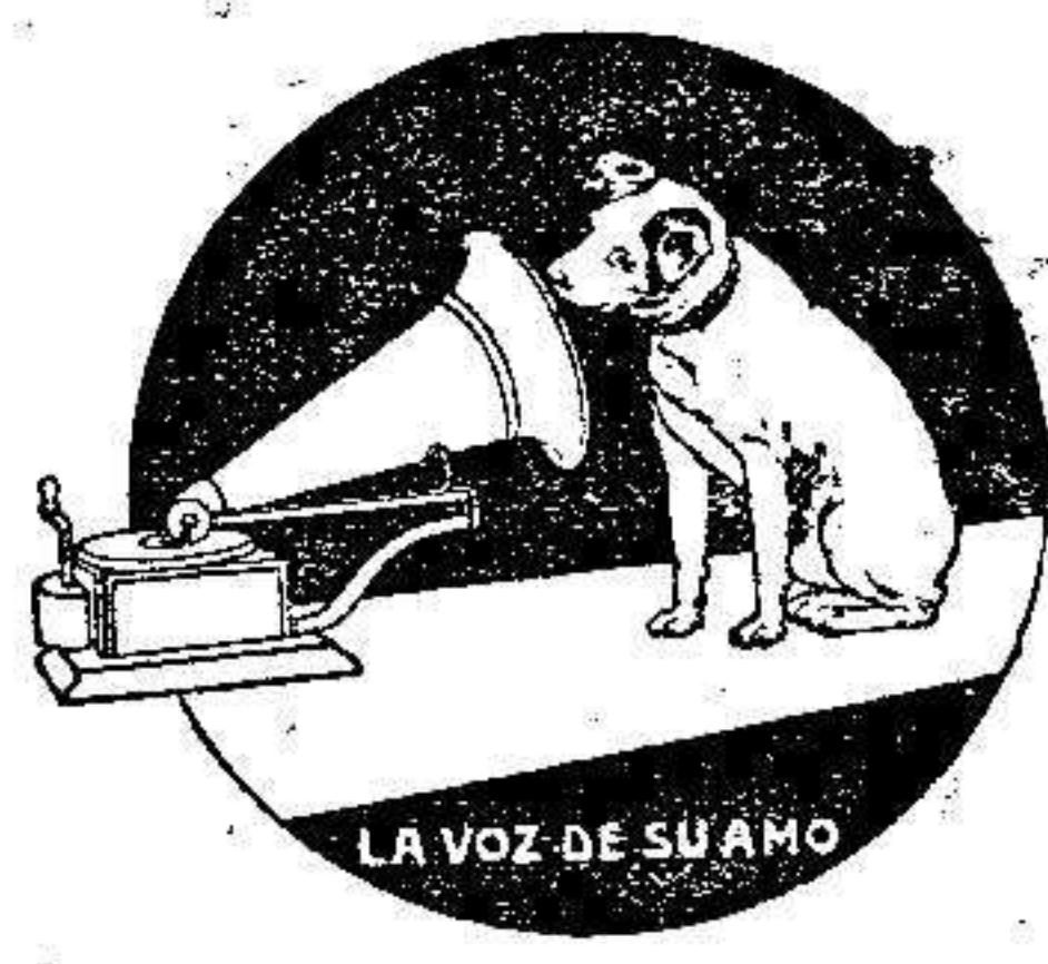
Marca de fábrica registrada

Exíjase en todos los aparatos y discos GRAMOPHONE la célebre marca de fábrica aquí representada, propiedad exclusiva de la Compañía Francesa del Gramophone.