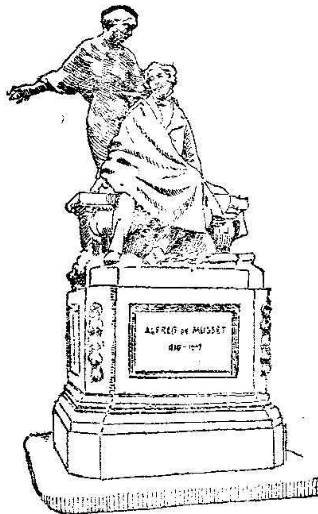
Monumento erigido á Musset frente á la puerta principal del Teatro francés

Uno de los homenajes que hoy tributa Francia á su gran poeta, es la reedición de sus obras teatrales. La Co-