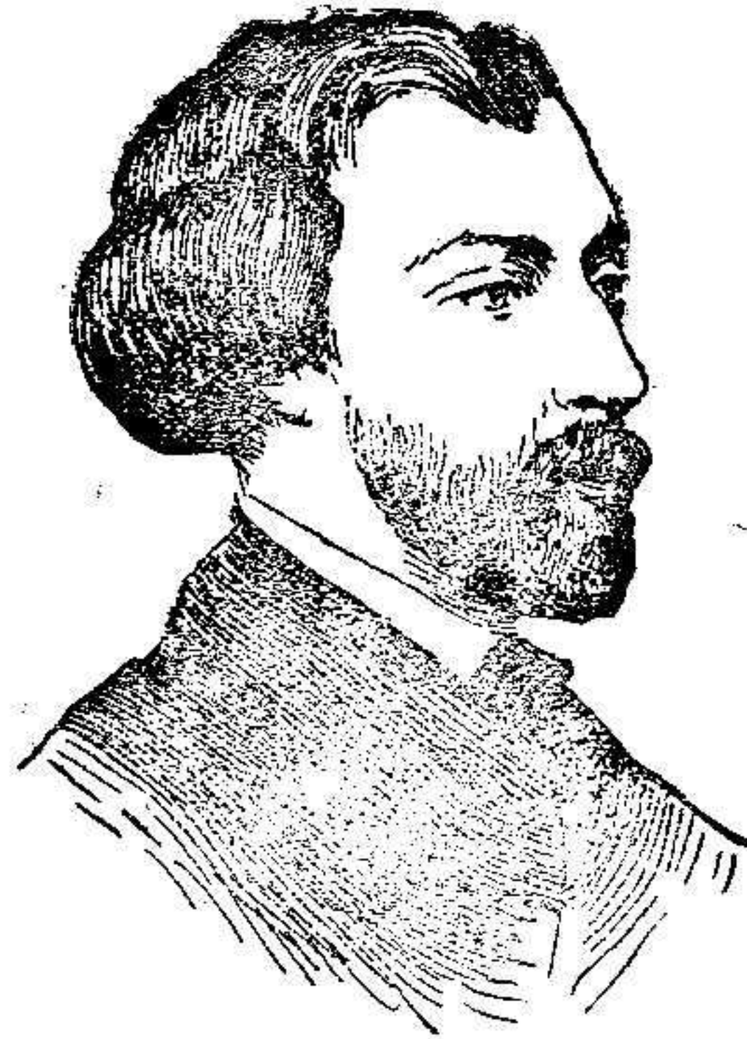
Alfredo de Musset

Siendo esto así, nada más lógico que las fiestas y solemnidades teatrales con