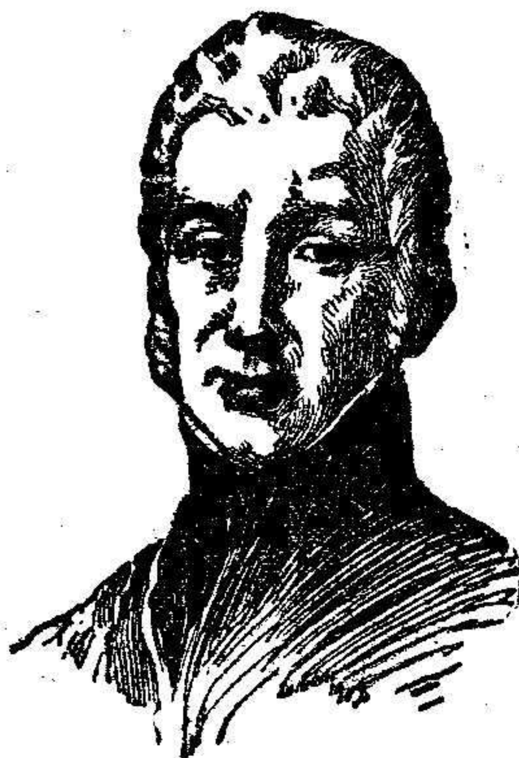
El General Santocildes

Astorga acaba de celebrar el primer centenario de los sitios por las huestes napoleónicas.