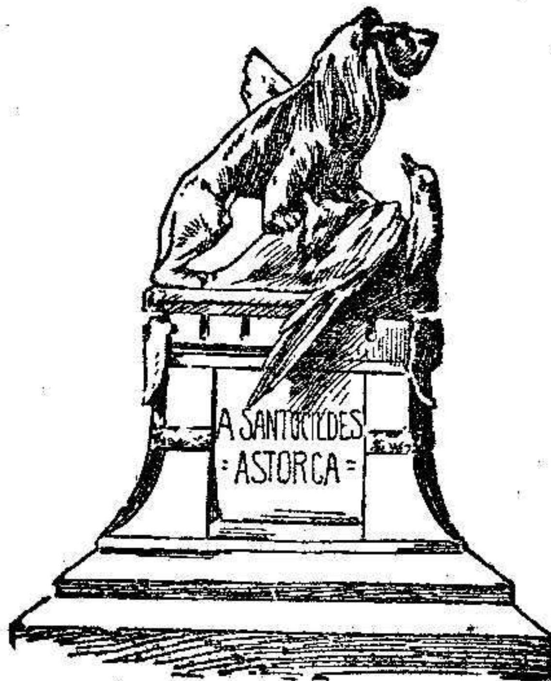
Monumento del Sitio de Astorga

En recuerdo de tan heroico comportamiento, Astorga ha erigido al general D. José M.º de Santocildes y á los que secundaron sus ordenes para la mejor defensa de la ciudad, un hermoso monumento, cuya inauguración ha tenido lugar durante las fiestas del centenario.