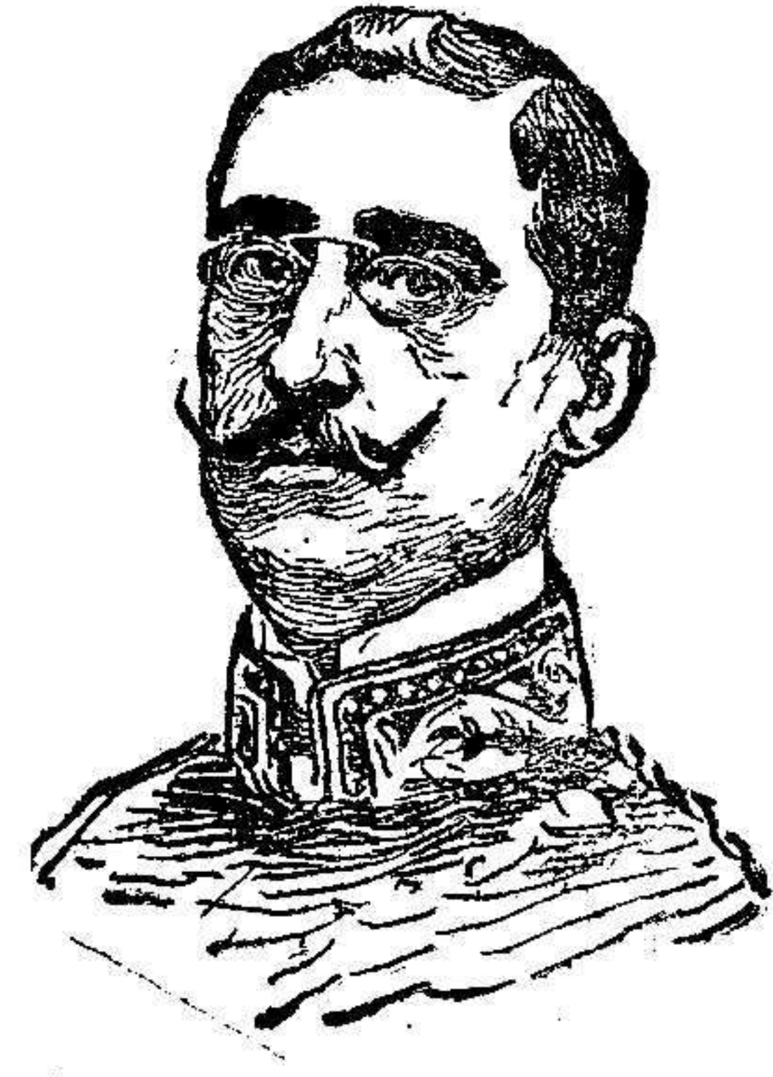
Sr. Perez Caballero, nuevo ministro de España en París