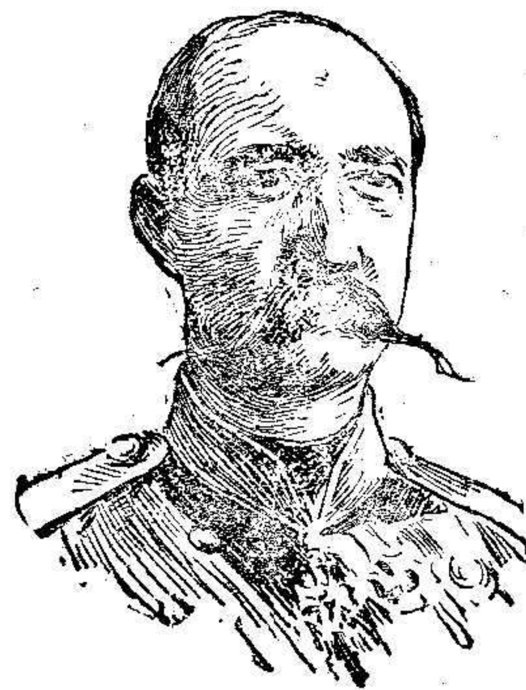
El Rey Jorge de Grecia

La «Liga Militar» continúa siendo la duquesa y señora de Grecia, y como tal imponiendo su capricho y obligando á grandes y chicos á hacer lo que á sus miembros se les antoja, y á tal extremo han llegado sus tropelías y sus despotismos, que se teme un final sangriento que deje eterna memoria al pueblo griego.