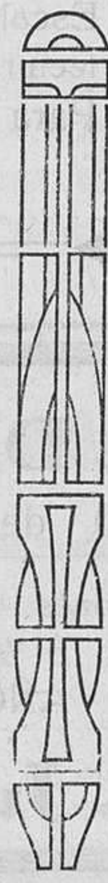
C. Rodrigo.—Un detalle del Coro de la Catedral.