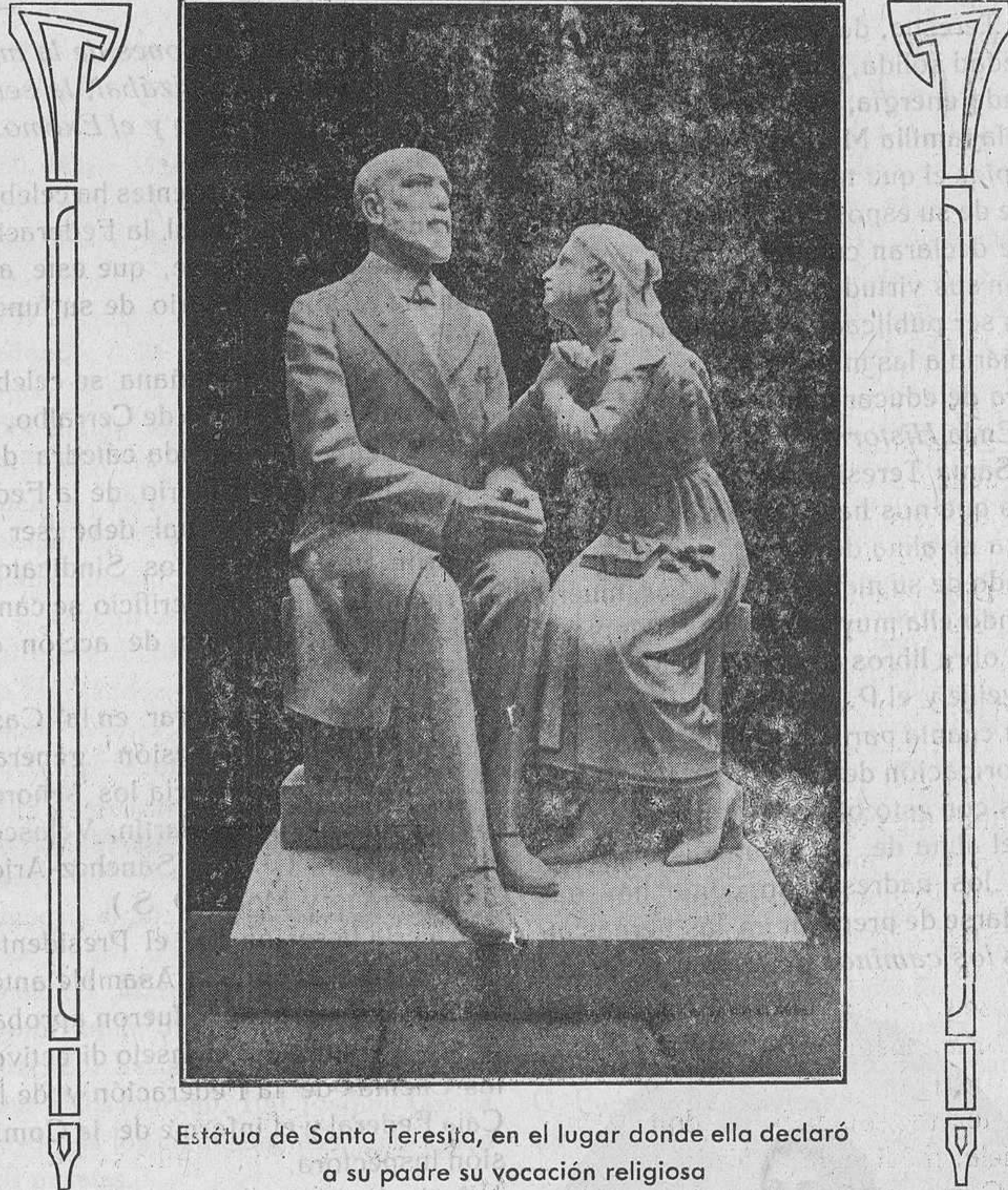
Estátua de Santa Teresita, en el lugar donde ella declaró a su padre su vocación religiosa

La sesión terminó a las cinco de la tarde en medio del mayor entusiasmo.