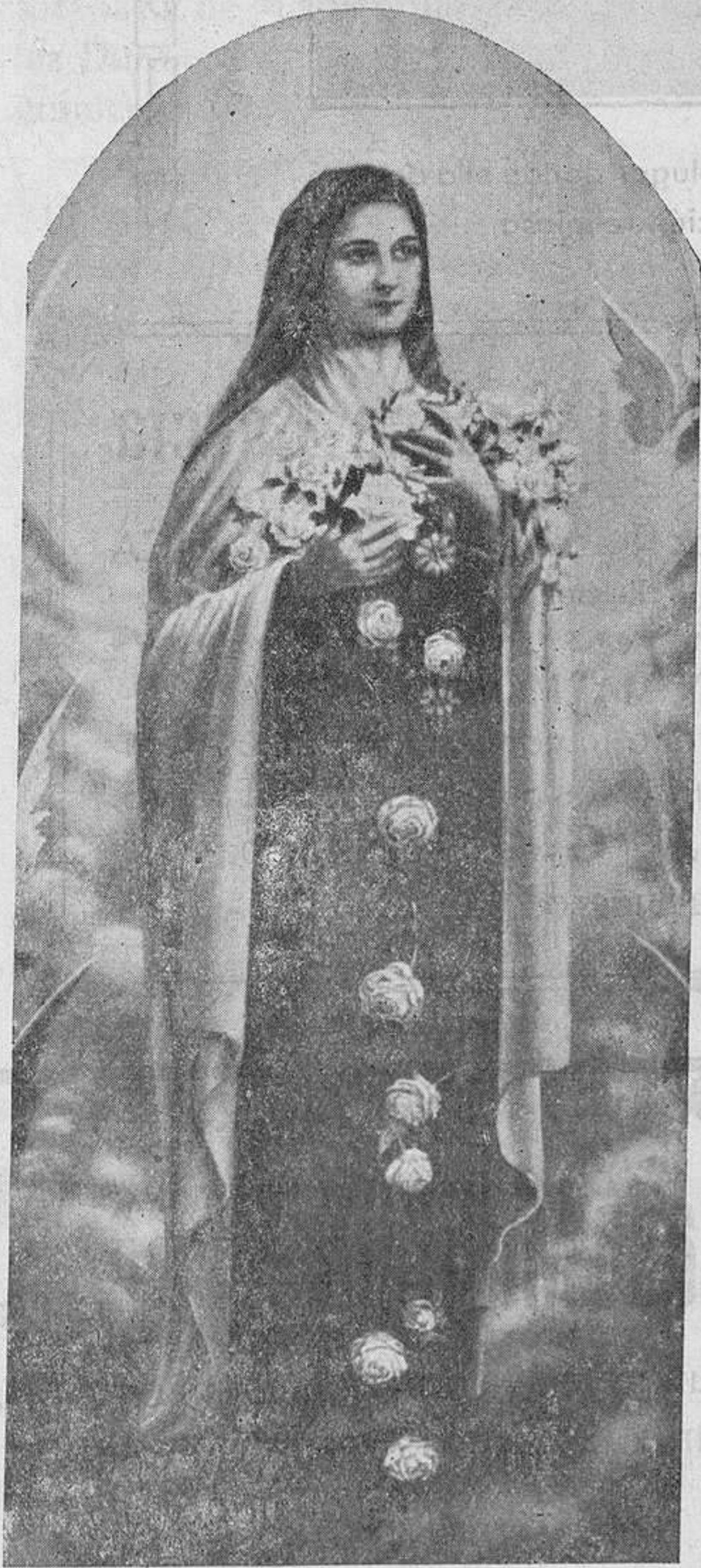
SANTA TERESITA DEL NIÑO JESÚS