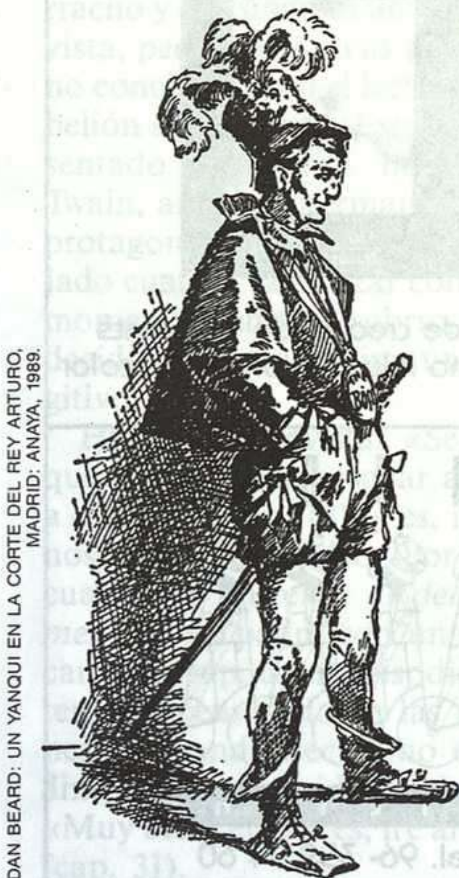
DAN BEARD: UN YANQUI EN LA CORTE DEL REY ARTURO, MADRID: ANAYA, 1989.

L'elefant blanc, robot , Barcelona: Empúries, 1988. (Edición en catalán.)