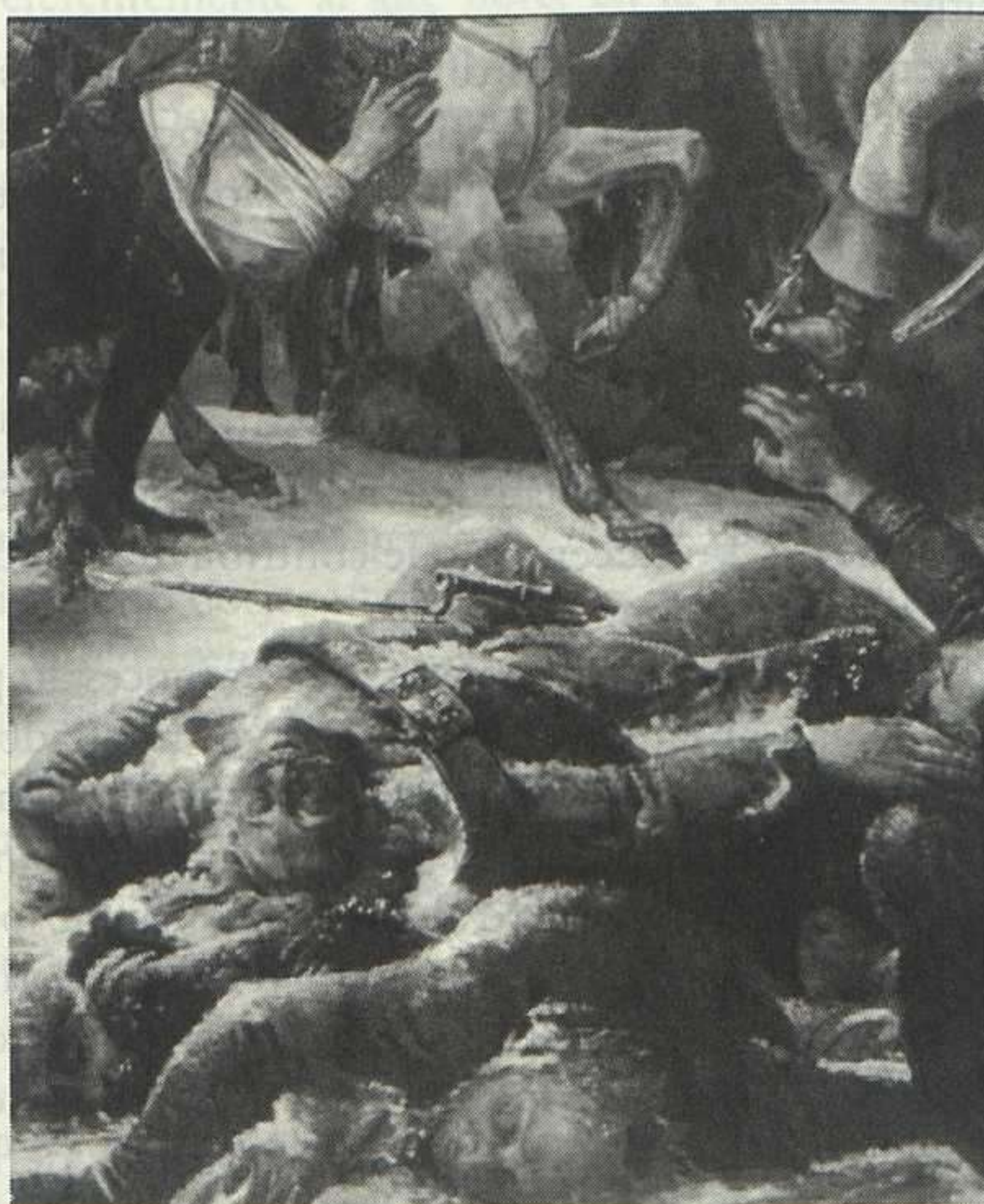
Jean-Antoine, barón Gros, Napoleón en la batalla de Eylan , detalle, 1808.