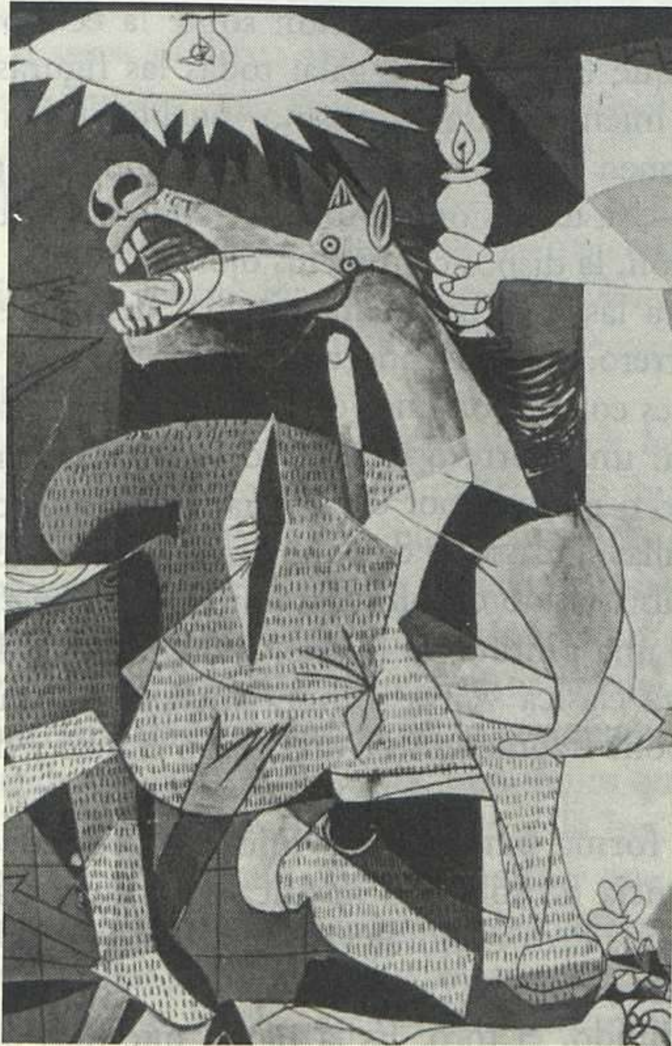
Pablo Picasso, Guernica , detalle, 1937.