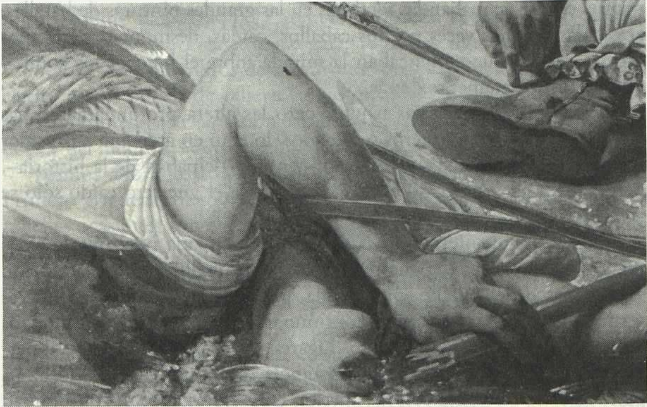
Jean-Antoine, barón Gros, La batalla de Abonbir , detalle, 1806