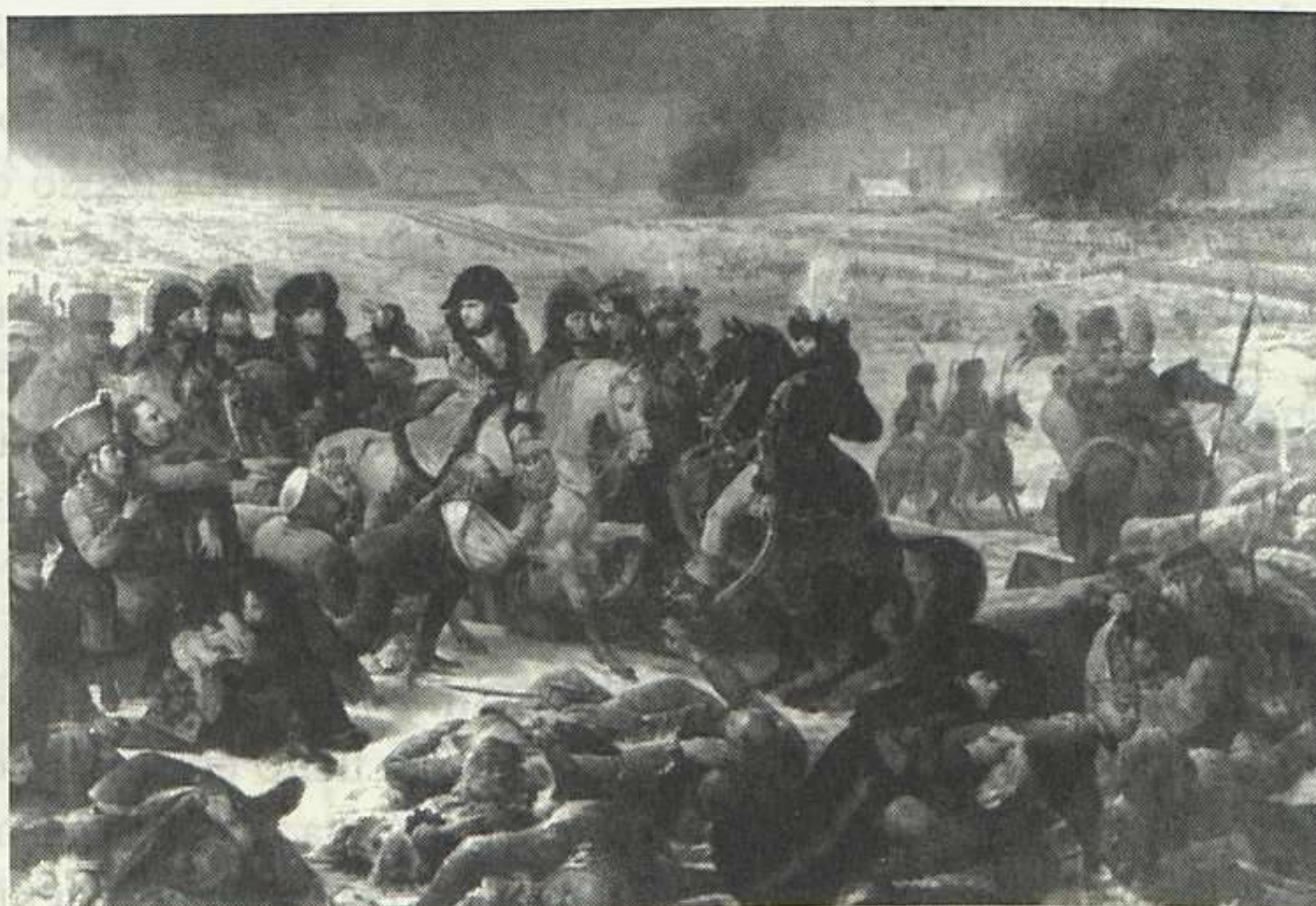
Jean-Antoine, barón Gros, Napoleón en la batalla de Eylan , 1808