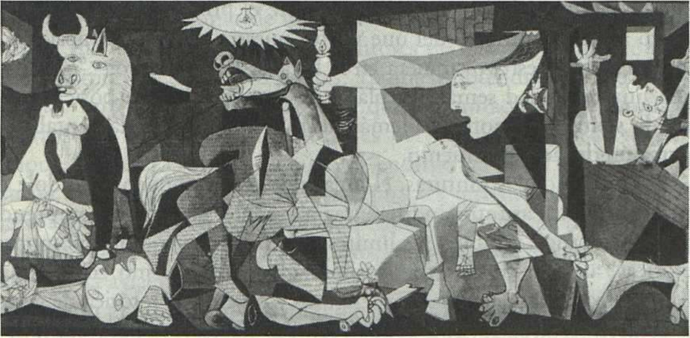
Pablo Picasso, Guernica