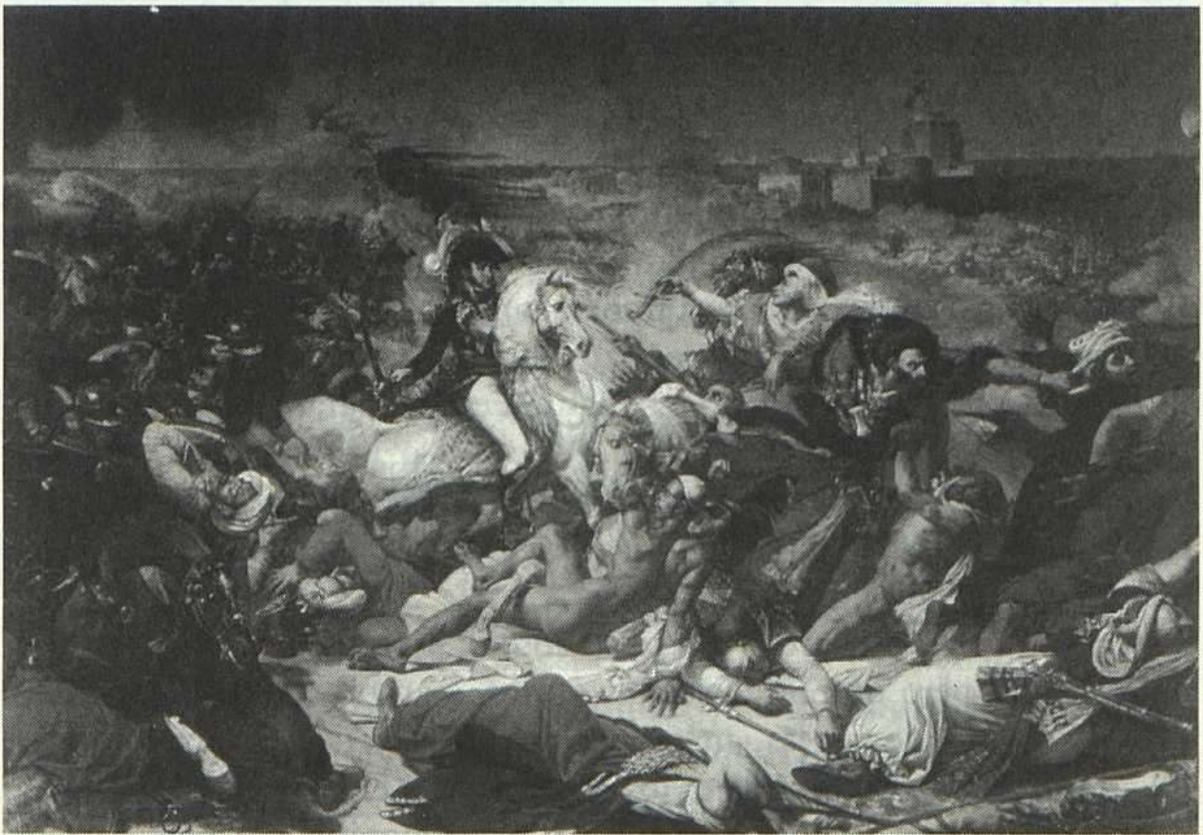
Jean-Antoine, barón Gros, La batalla de Aboukir, 1806.