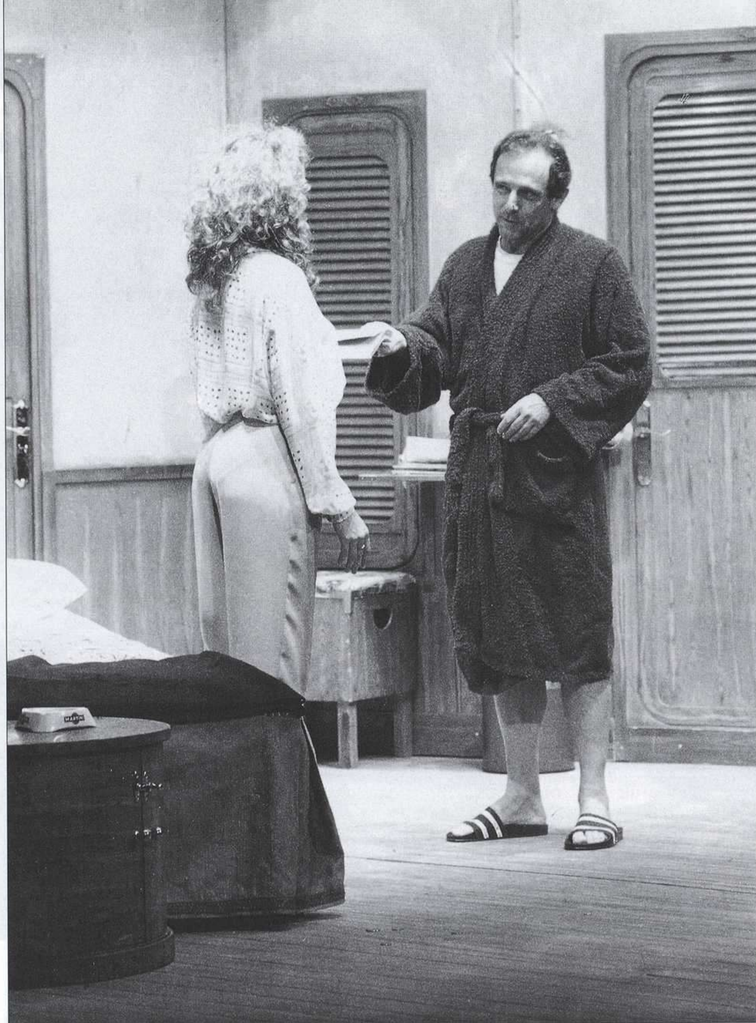
"Travesía" de Fermín Cabal. Dirección: Fermín Cabal. (1993)