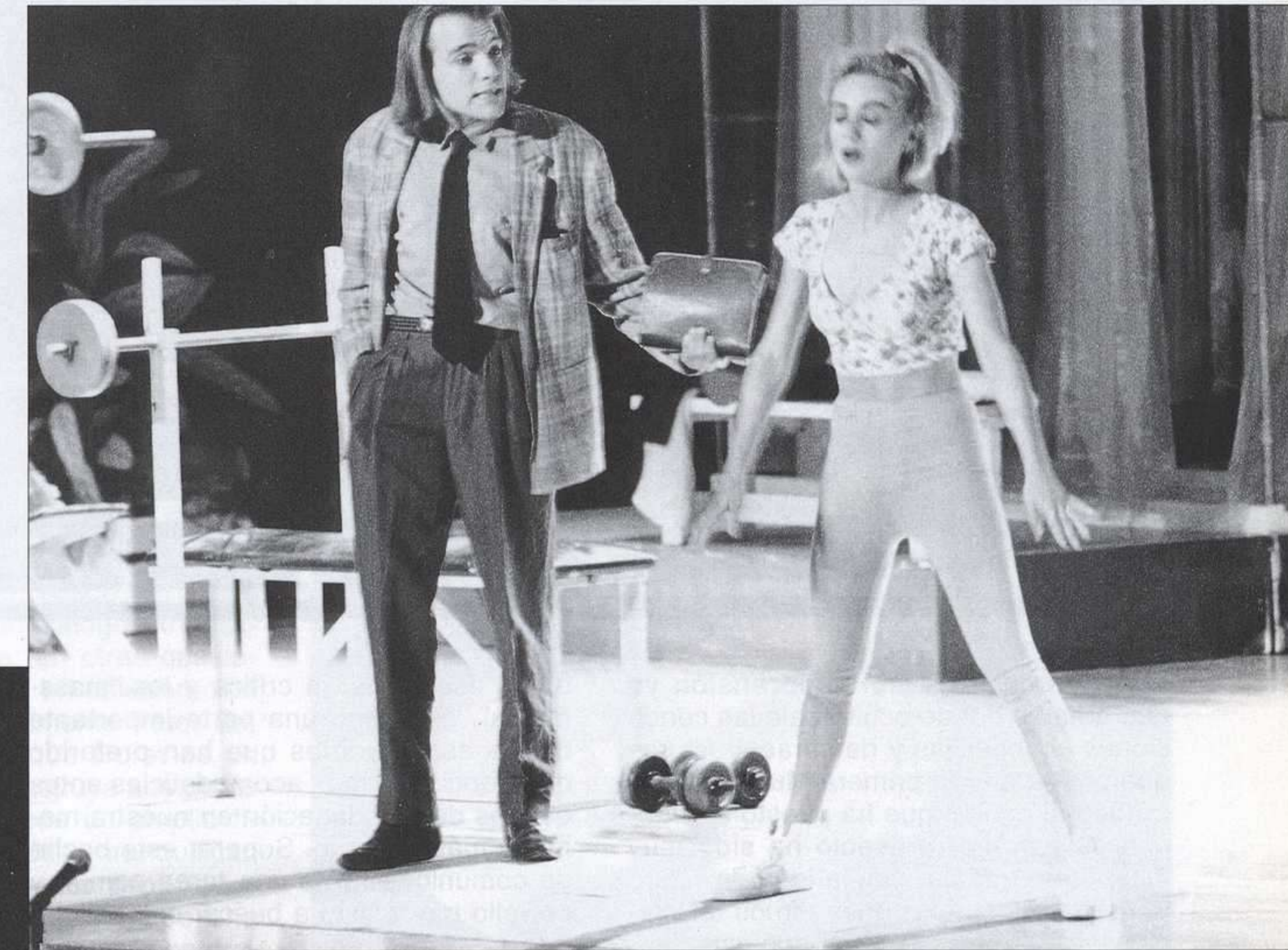
A la izquierda, un momento del homenaje a Buero Vallejo en Alicante. Sobre estas líneas "Anónima sentencia", de Eduardo Galán. Dirección: Enrique Belloch (1993).

aventuras conjuntas es lógico que diferentes puntos de vista aporten también diferencias de entendimiento de las estéticas posibles, pero sólo en los casos de mediocridad latente eso puede conducir a divorcios manifiestos. Doce espectáculos de autor que en algunos ca-