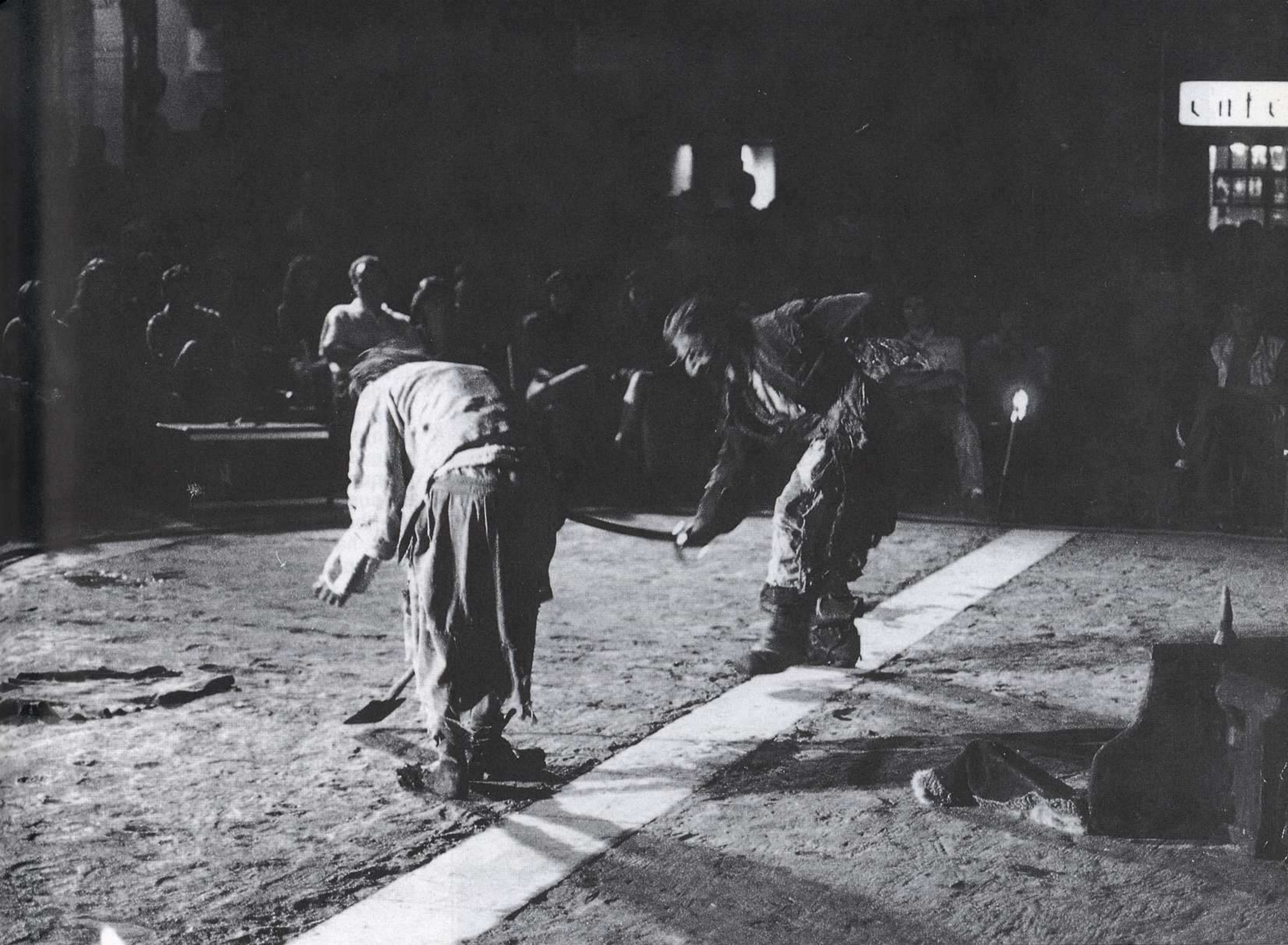
“Con las tripas vacías” de F. y A. Aguado. Dirección: Eva del Palacio (1993).