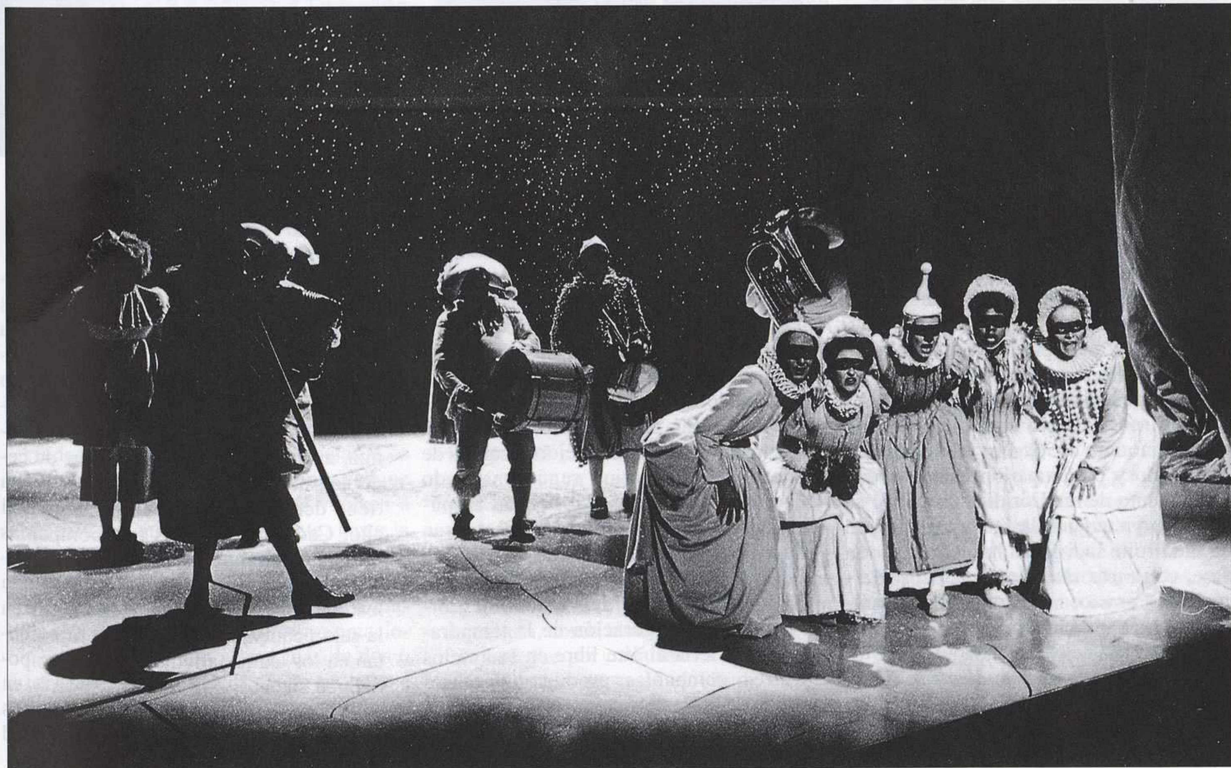
«Moortje», de G. A. Bedrero. Dirección: Hans Croiset. Het Nationale Toneel. (1992).

Empezamos con los gigantes en el bosque teatral. Hay tres grandes compañías nacionales en las tres ciudades principales en el oeste del país. La capital -aunque en muchos colegios españoles se enseña que nuestra capital es La Haya- el mítico Amsterdam, que por cierto es el centro del mundillo de los teatreros, tiene su Toneelgroep Amsterdam , la compañía más progresista e innovadora, dirigida por Gerardjan Rijnders (véase el número