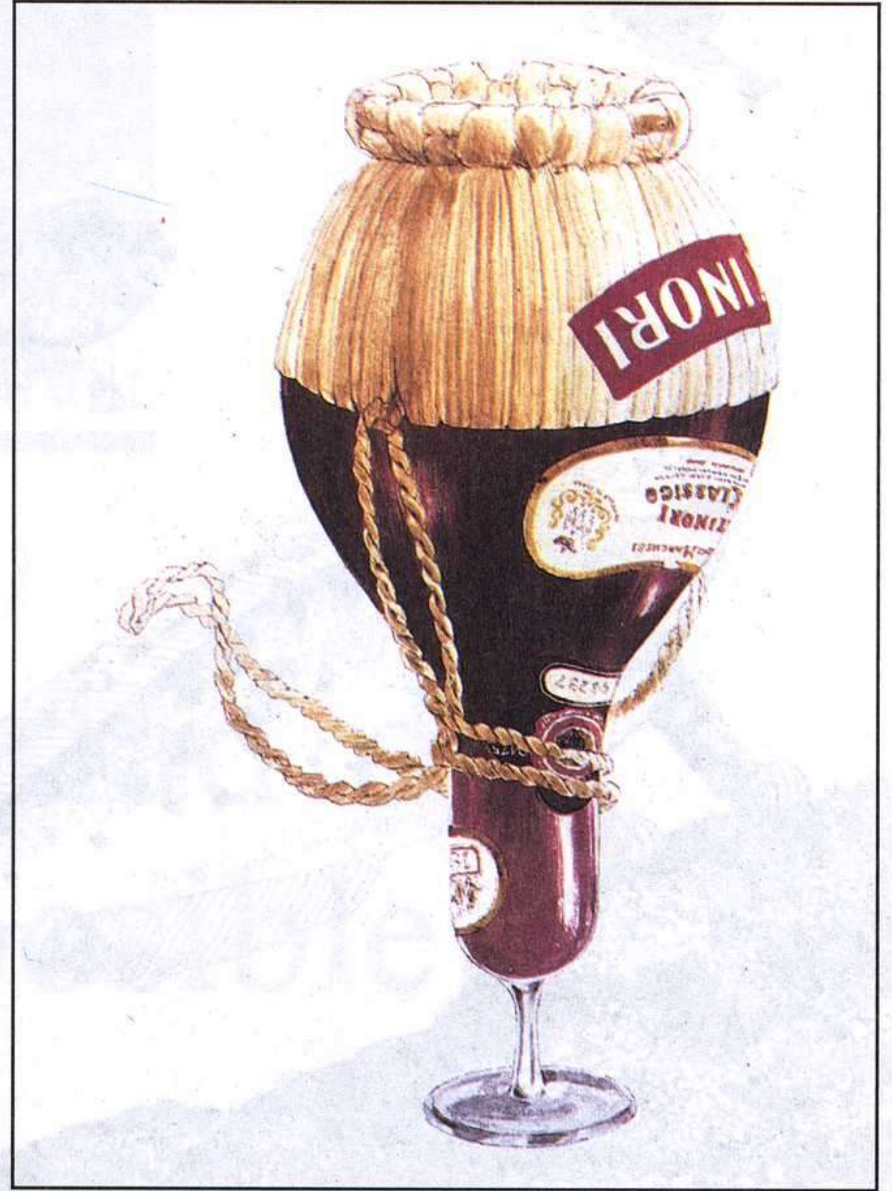
4 MITSUMASA ANNO. THE UNIQUE WORLD OF MITSUMASA ANNO. ED. BODLEY HEAD, 1977.