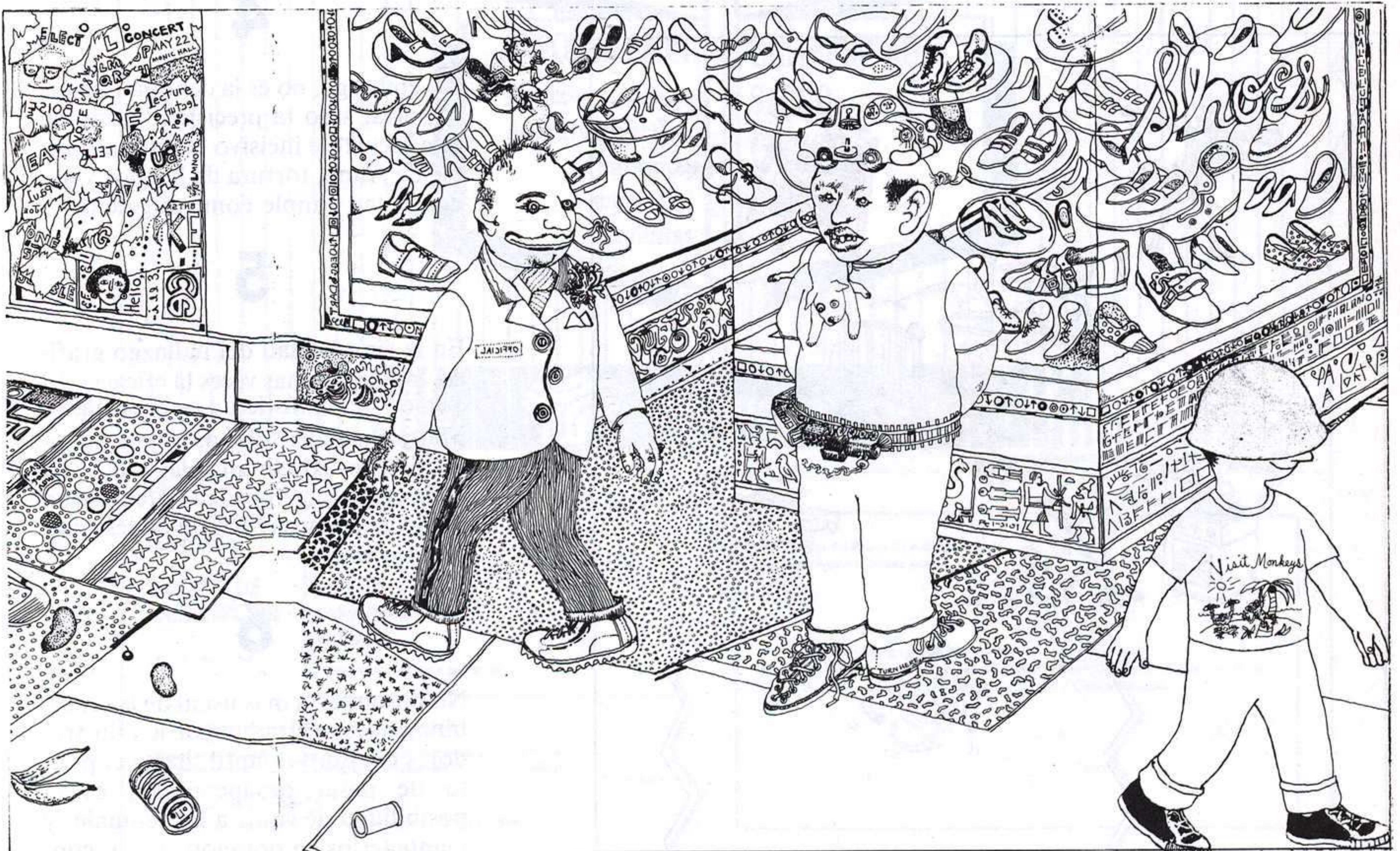
3 MARK ALAN STAMATY. UN CAPPELLO TUTTO GIALLO. ED. EMME, 1971.