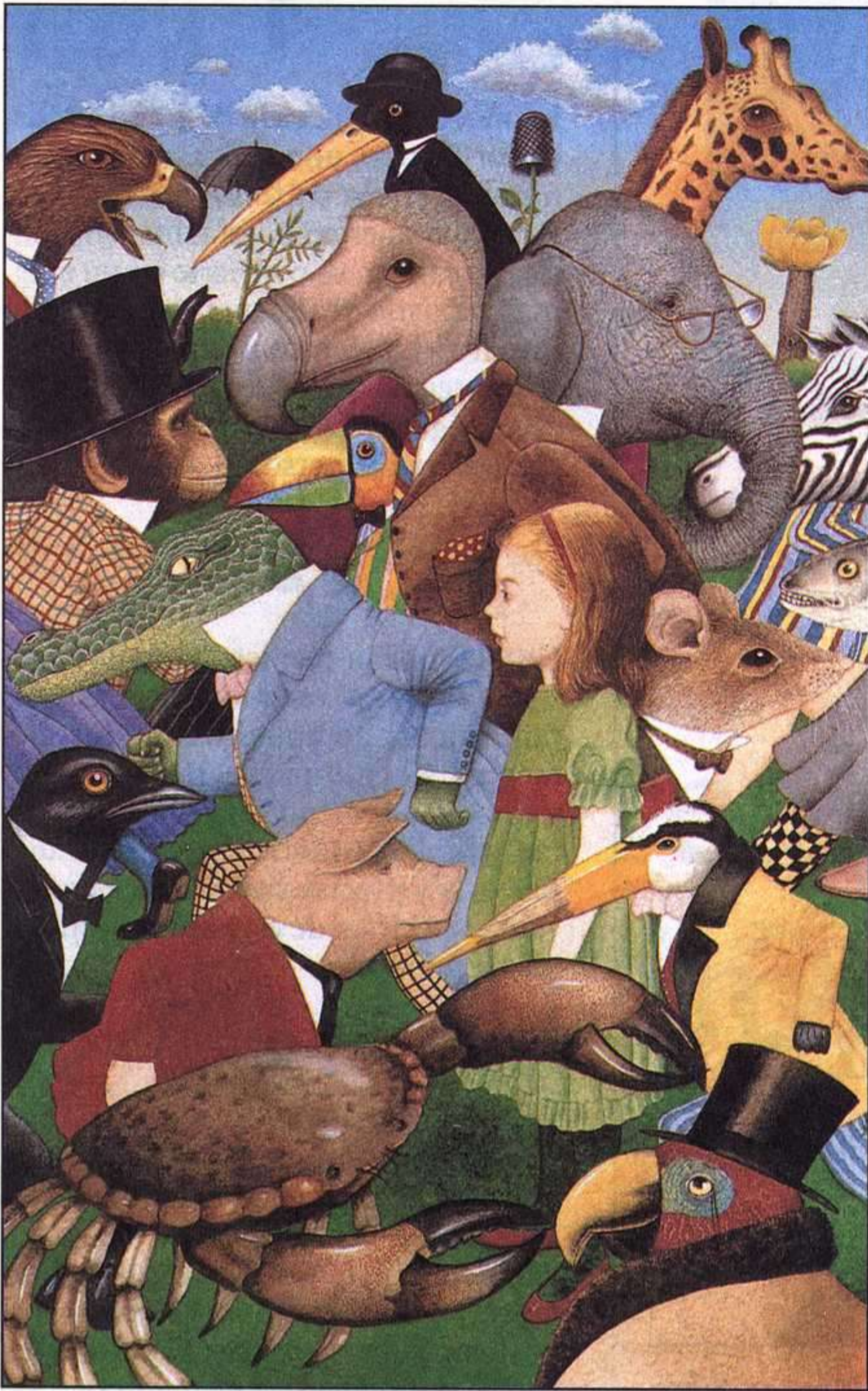
6 ANTHONY BROWNE. ALICE'S ADVENTURES IN WONDERLAND. ED. JULIA MCRAE BOOKS, 1988.