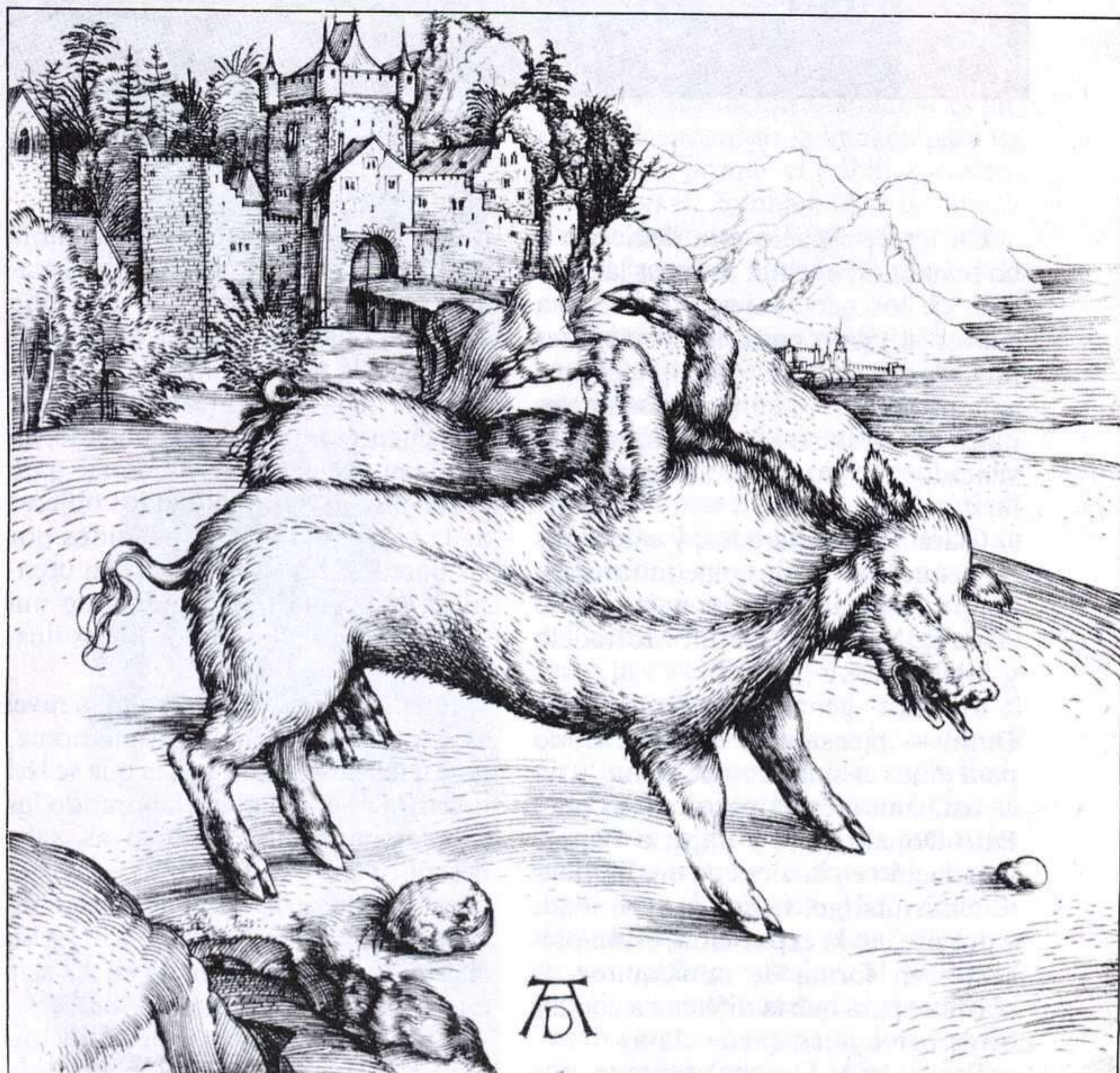
1 ALBERT DURER. LA MONSTRUOSA CERDA DE LANDSER, 1496.

La habilidad del artista consiste sólo en dar apariencia concreta a aquellas adjunciones que permiten al espectador evocar la posibilidad de que lo inexistente existe. El ilustrador sólo suma dos imágenes. Nuestra imaginación hace el resto. Ver para creer. Esto es todo. Y ya es mucho.