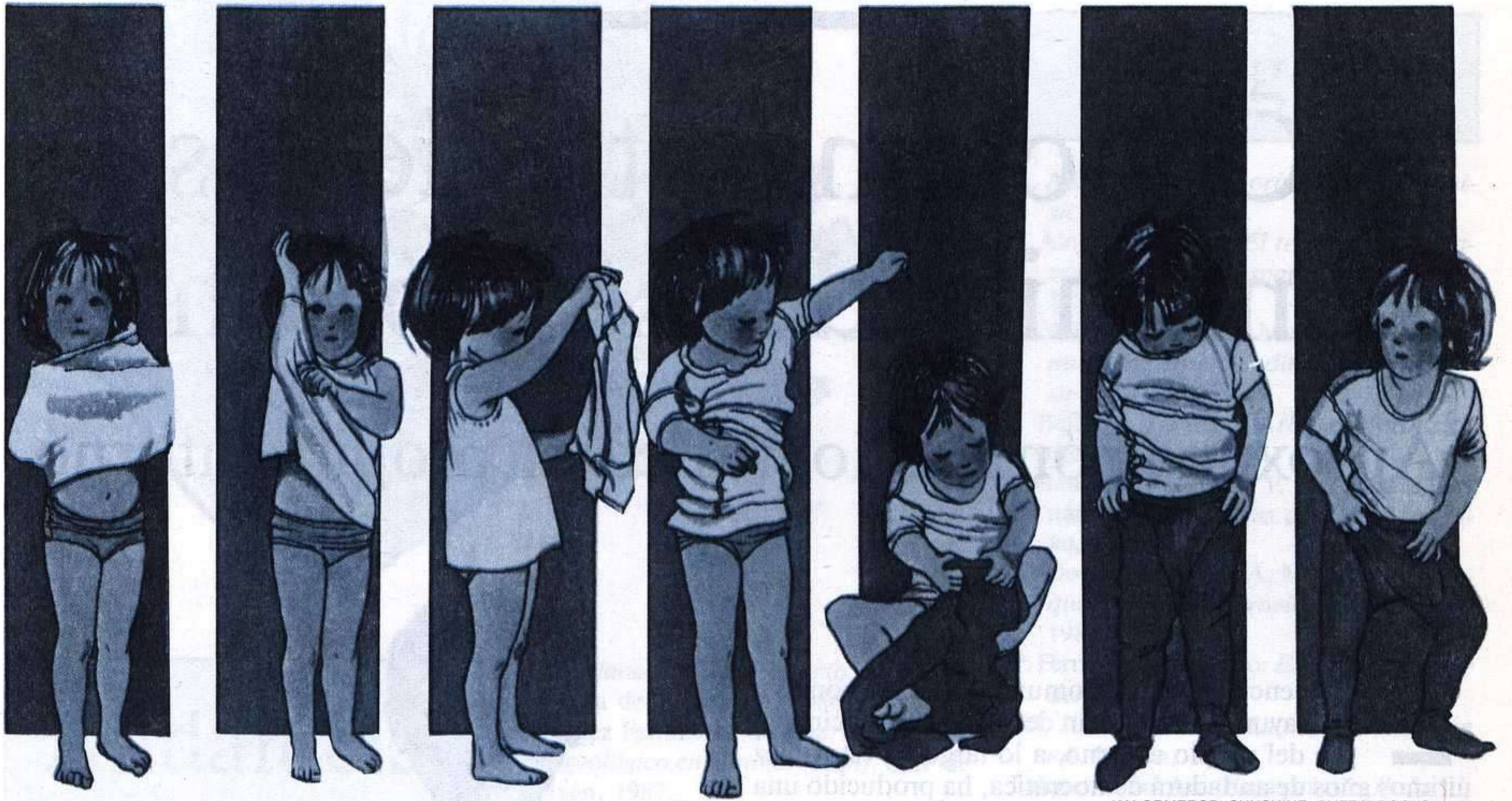
JAN ORMEROD. SUNSHINE. PUFFIN BOOKS, 1983.