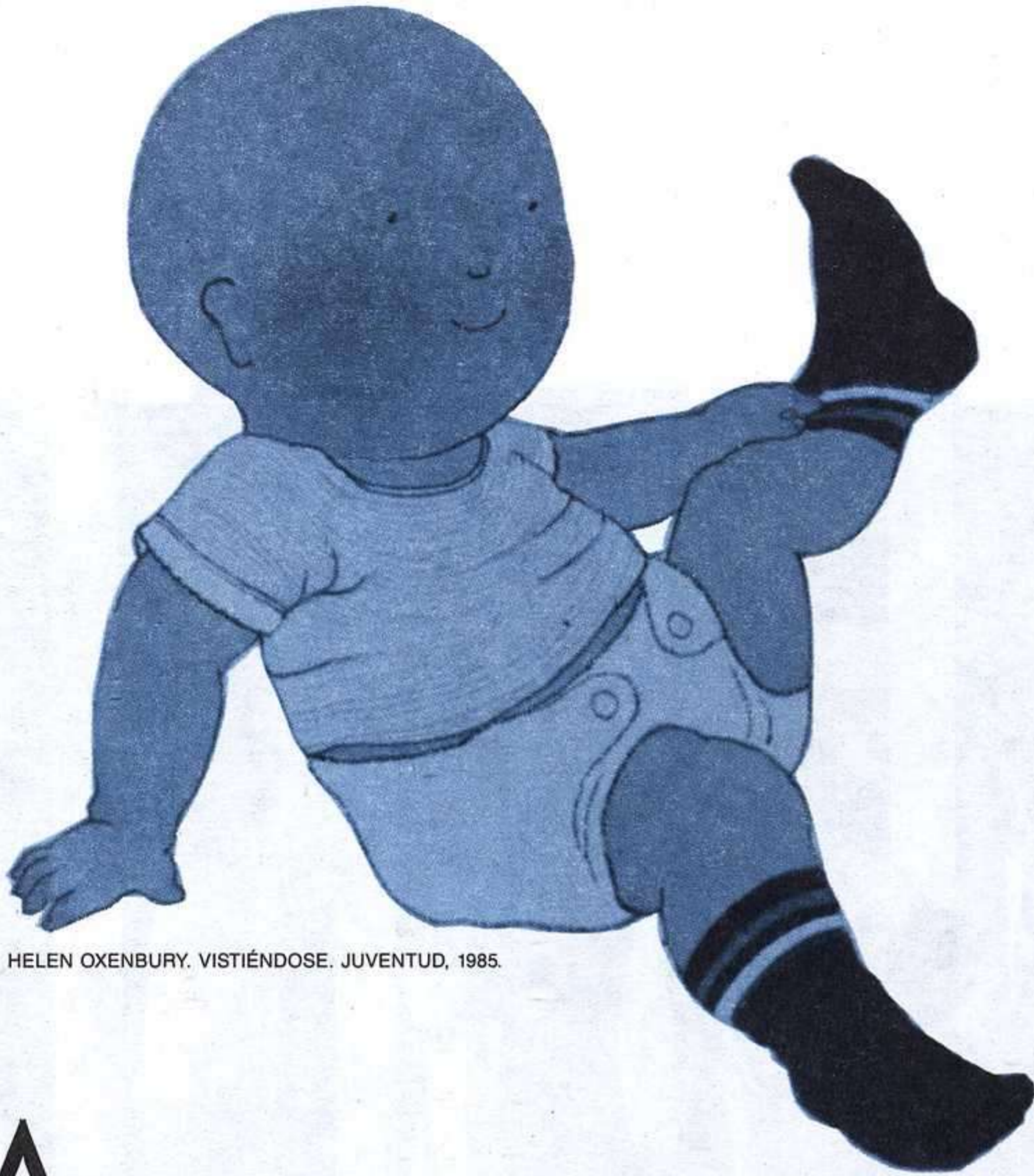
HELEN OXENBURY. VISTIÉNDOSE. JUVENTUD, 1985.

A menudo, los niños menores de 6 años, por imitación —ven a sus padres y familiares consultar y leer libros—, manipulan libros, folletos de propaganda y hacen ver que leen. Ello constituye ya una relación física entre el niño y los libros. Esta relación se completa cuando descubren que se puede mirar «dentro» del libro. Este descubrimiento se hace generalmente con un adulto. La lectura se convierte entonces en un momento tranquilo y privilegiado donde se expresan con fuerza, a la vez, la inteligencia y la afectividad.