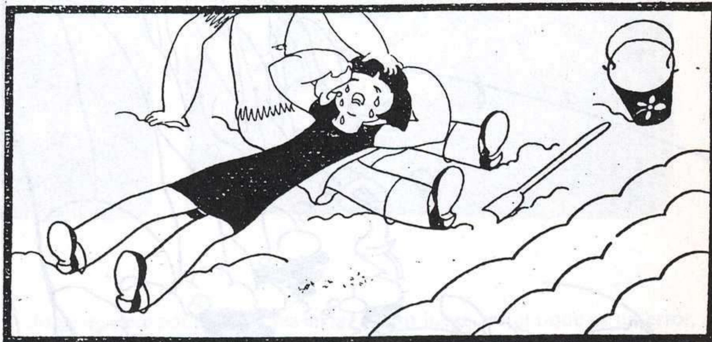
M. GALLENT. CELIA EN EL MUNDO. AGUILAR. MADRID, 1942.

¿Cuál puede ser la relación entre esta autora y su personaje? ¿Hasta