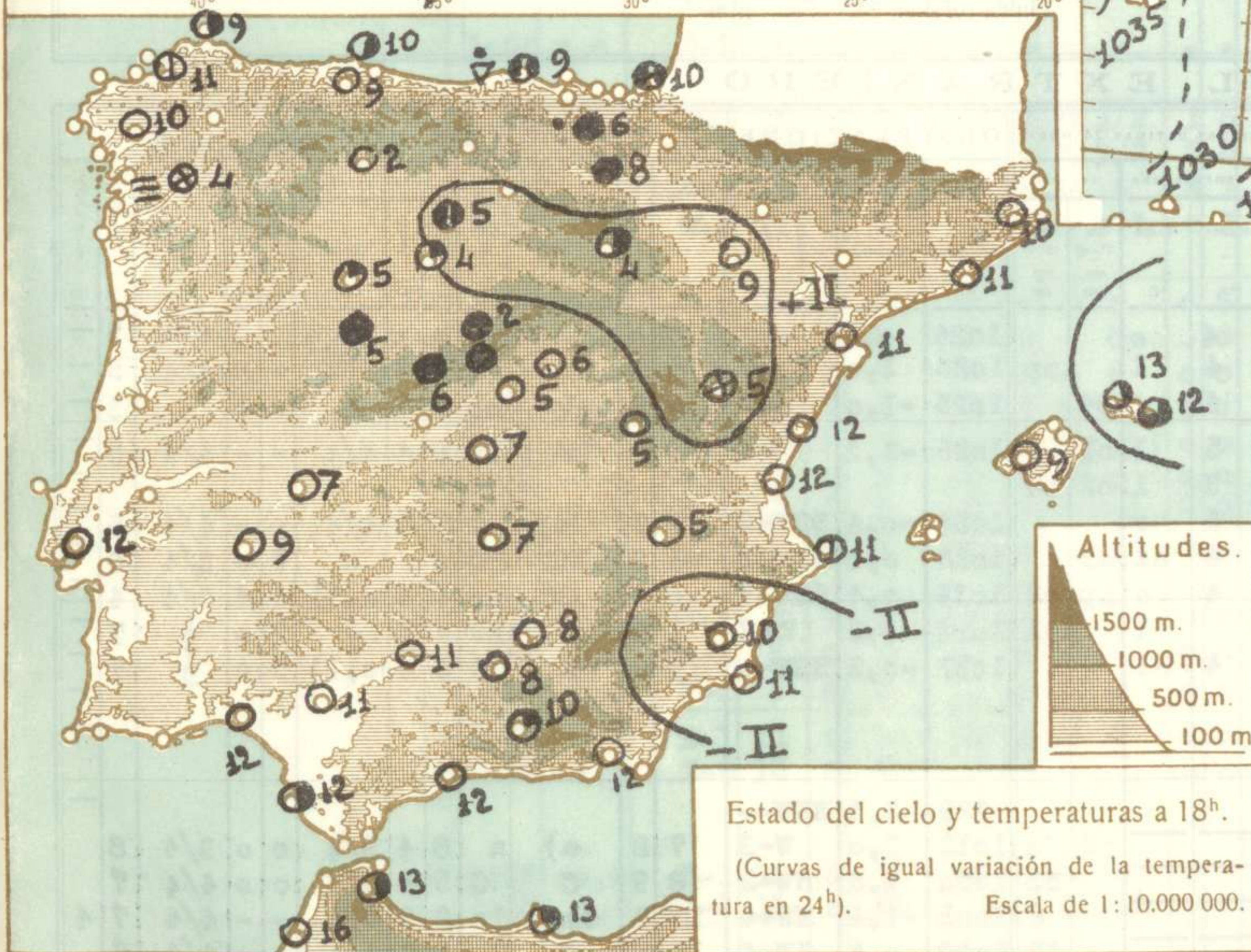
Estado del cielo y temperaturas a 18 h . (Curvas de igual variación de la temperatura en 24 h ). Escala de 1 : 10.000.000.