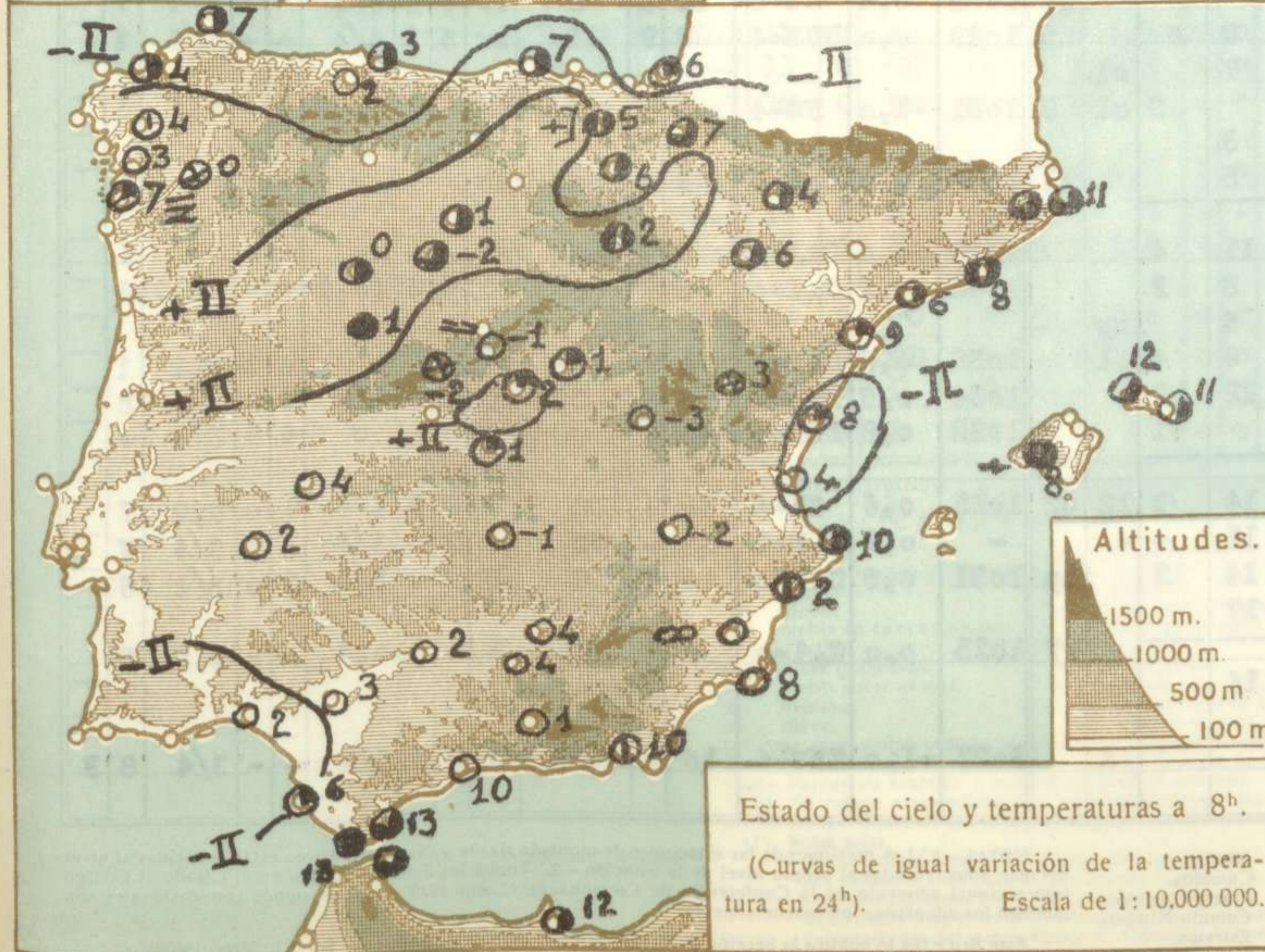
Estado del cielo y temperaturas a 8 h . (Curvas de igual variación de la temperatura en 24 h ). Escala de 1 : 10.000.000.