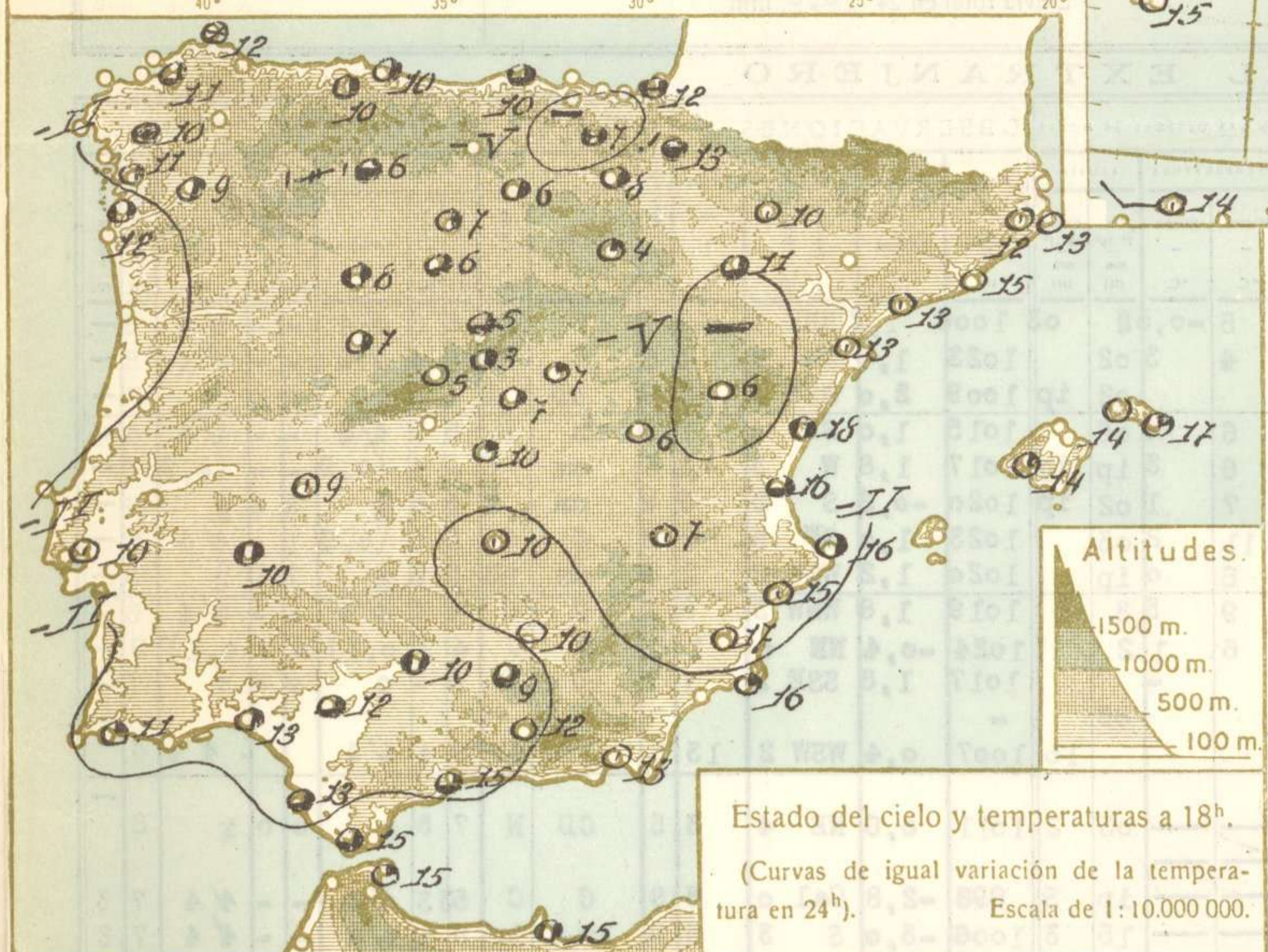
Estado del cielo y temperaturas a 18 h . (Curvas de igual variación de la temperatura en 24 h ). Escala de 1:10.000.000.