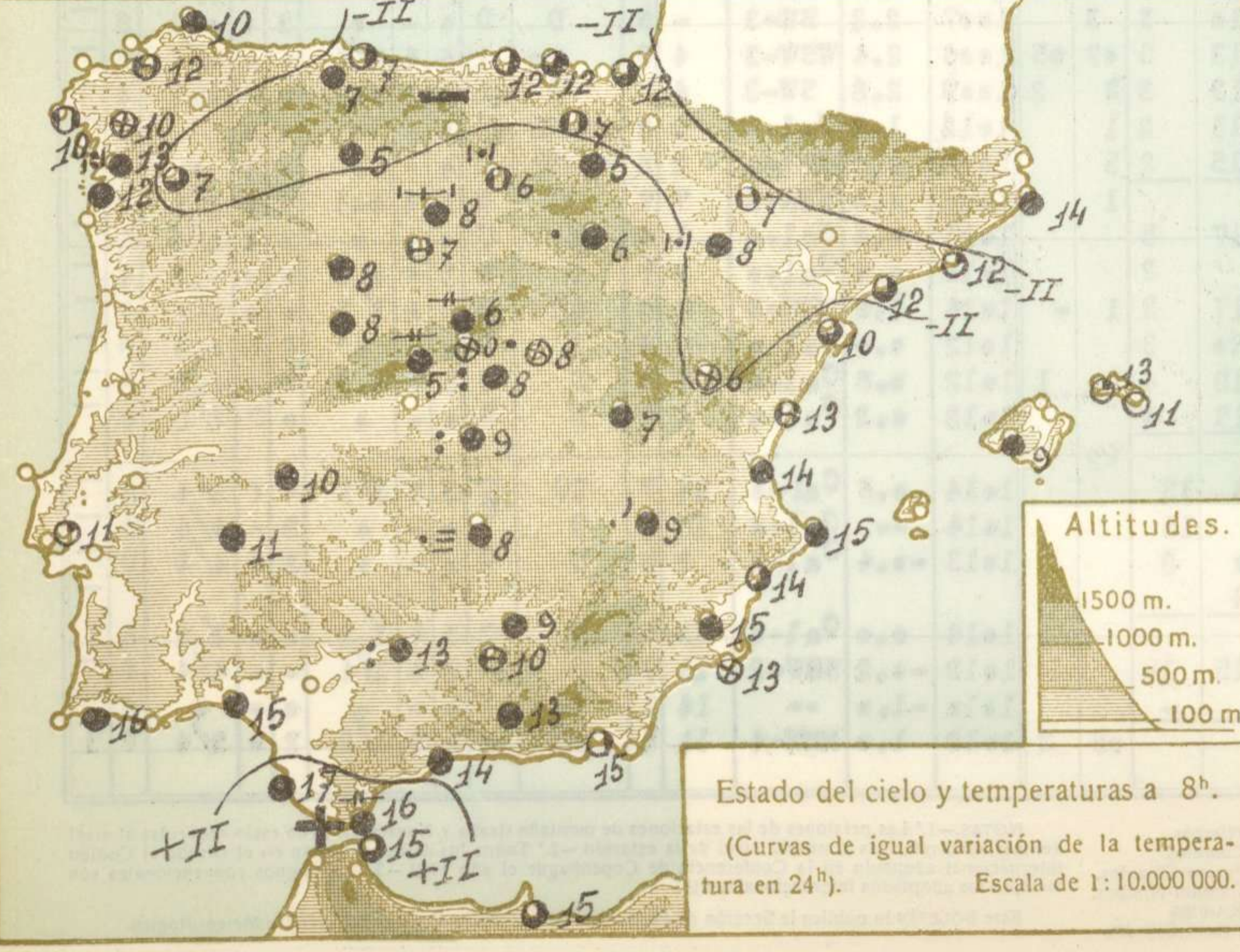
Estado del cielo y temperaturas a 8 h . (Curvas de igual variación de la temperatura en 24 h ). Escala de 1:10.000.000.