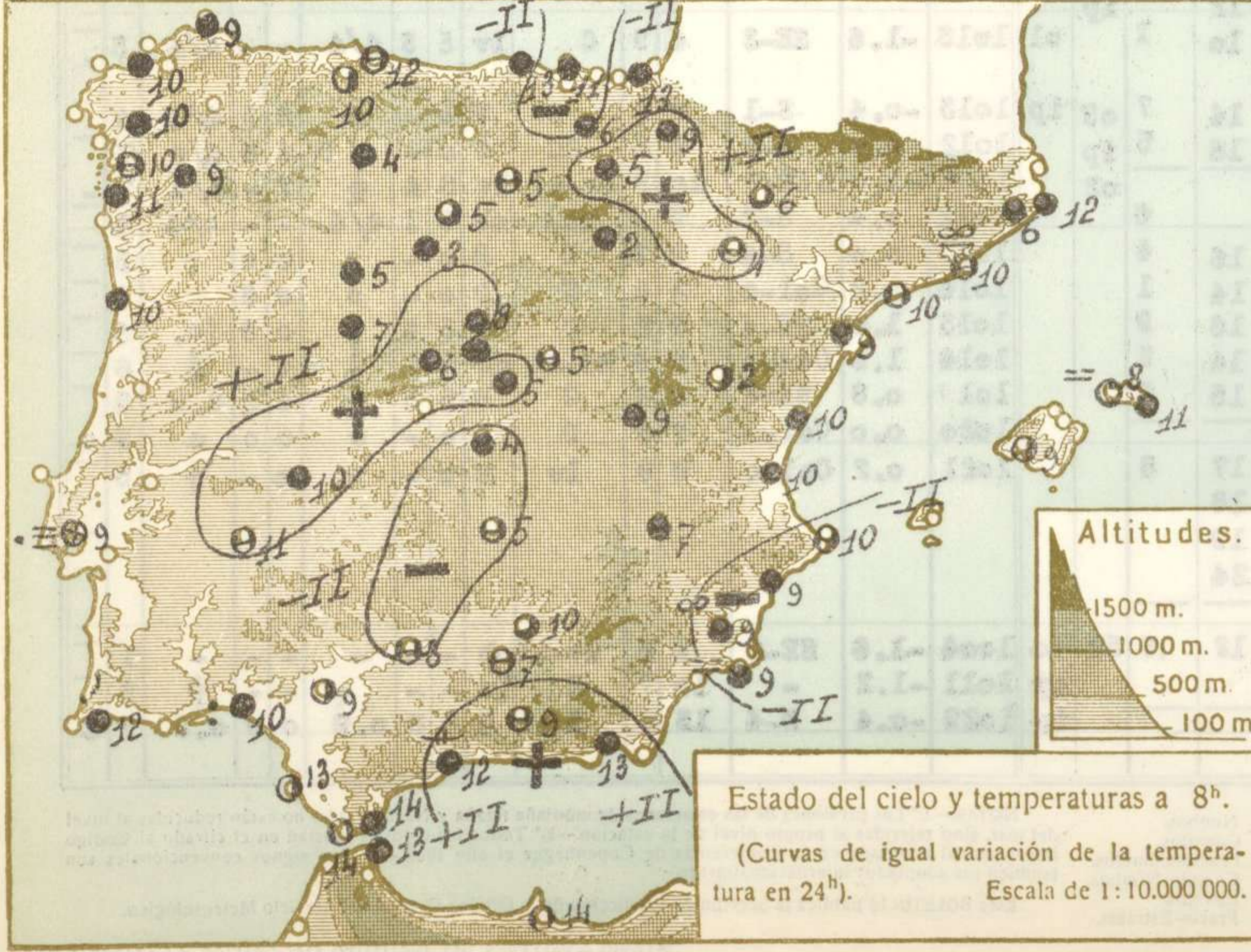
Estado del cielo y temperaturas a 8 h . (Curvas de igual variación de la temperatura en 24 h ). Escala de 1: 10.000.000.