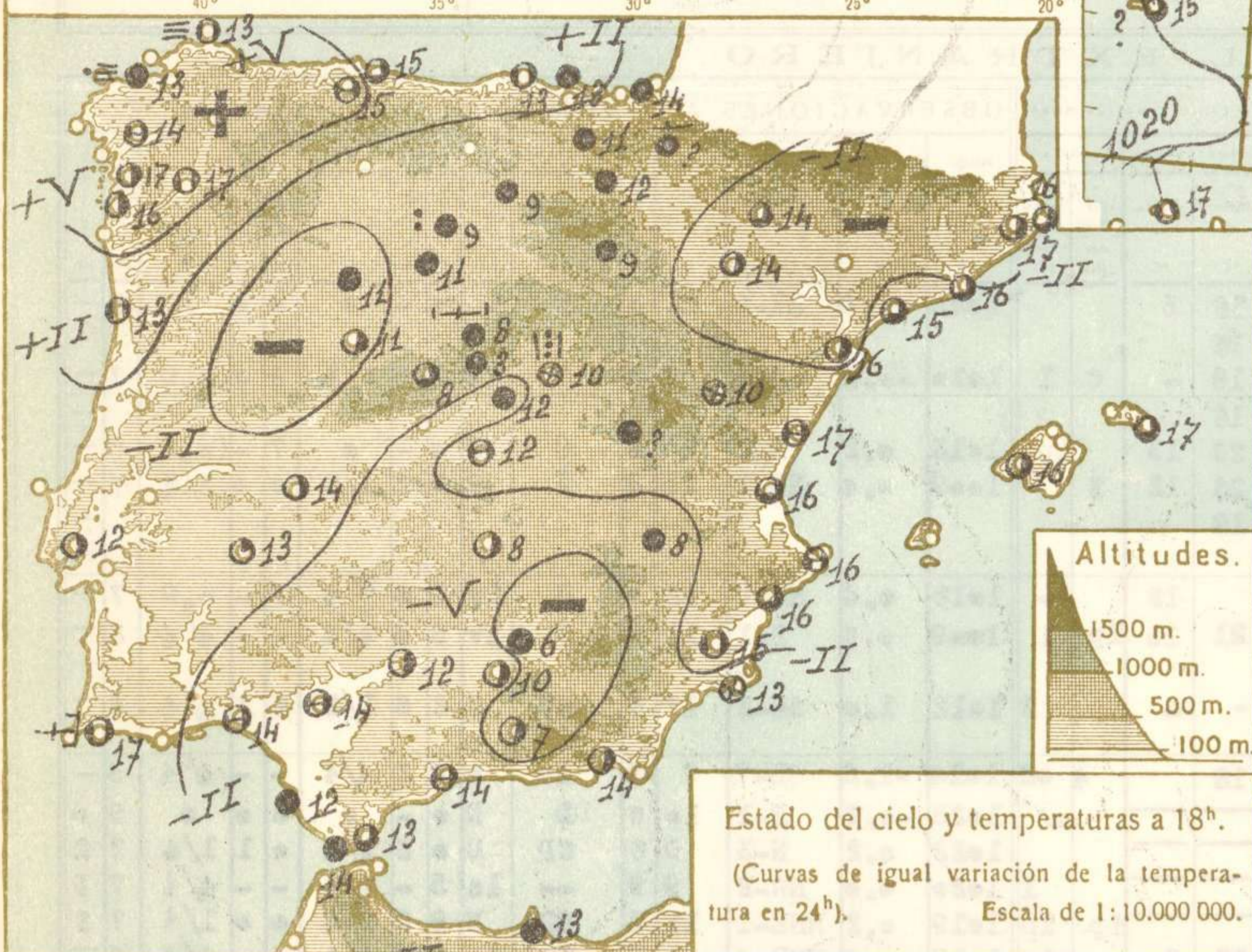
Estado del cielo y temperaturas a 18 h . (Curvas de igual variación de la temperatura en 24 h ). Escala de 1:10.000.000.