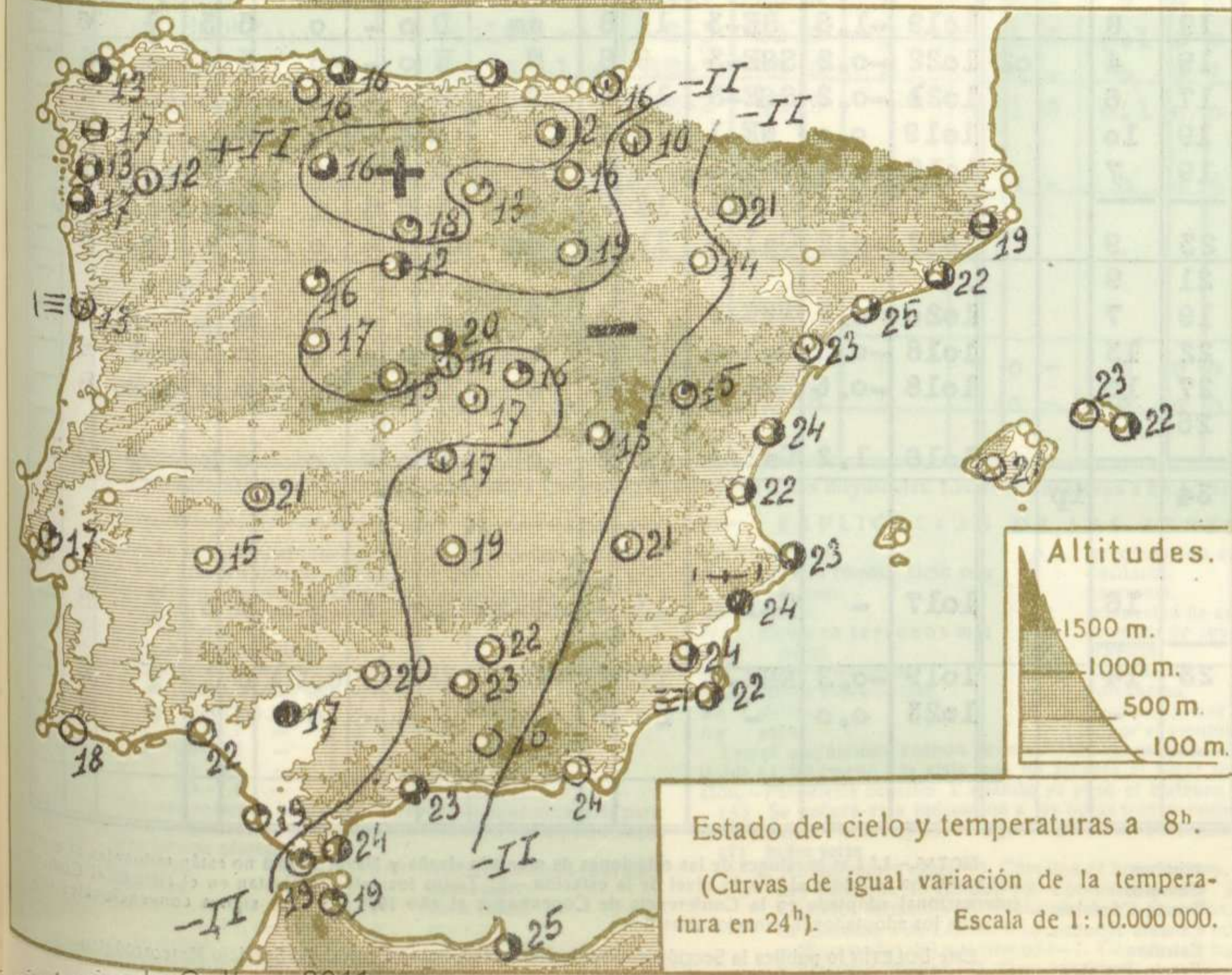
Estado del cielo y temperaturas a 8 h . (Curvas de igual variación de la temperatura en 24 h ). Escala de 1:10.000.000.