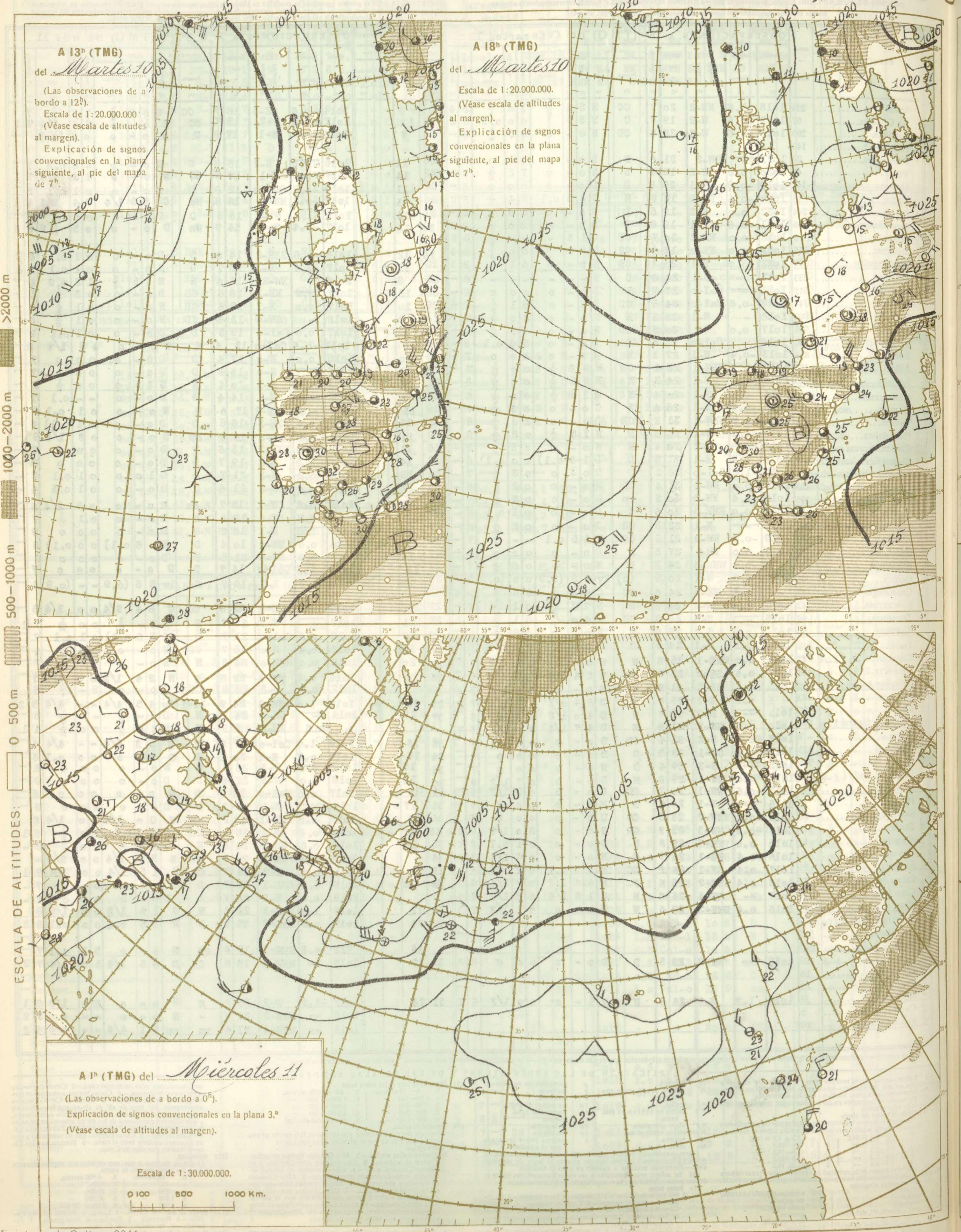
A 13 h (TMG)

del Martes 10 (Las observaciones de a bordo a 12 h ). Escala de 1:20.000.000 (Véase escala de altitudes al margen). Explicación de signos convencionales en la plana siguiente, al pie del mapa de 7 h .