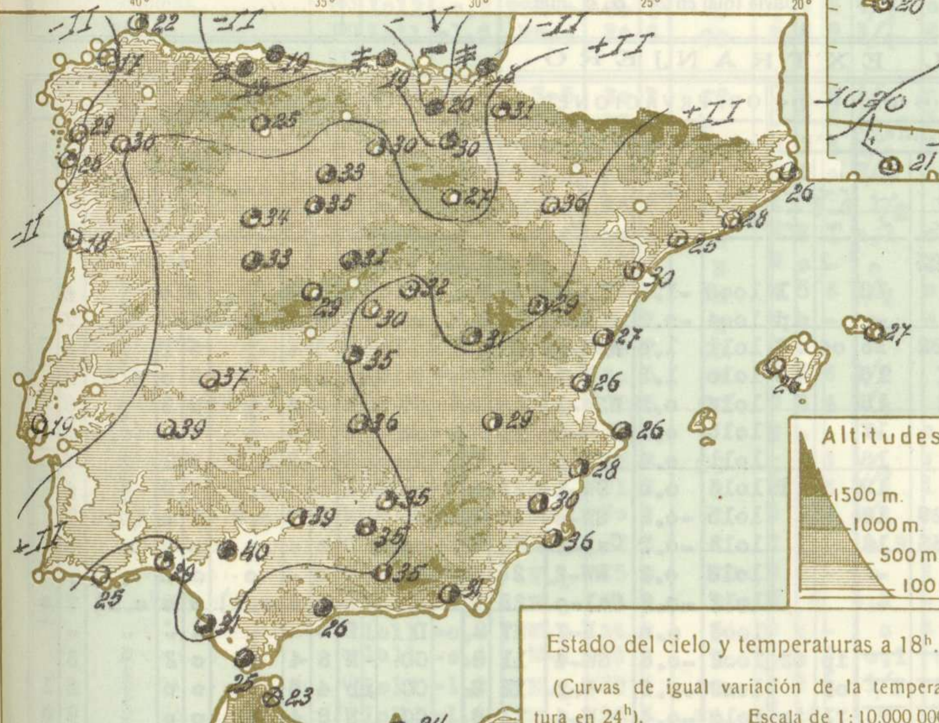
Estado del cielo y temperaturas a 18 h . (Curvas de igual variación de la temperatura en 24 h ). Escala de 1:10.000.000.