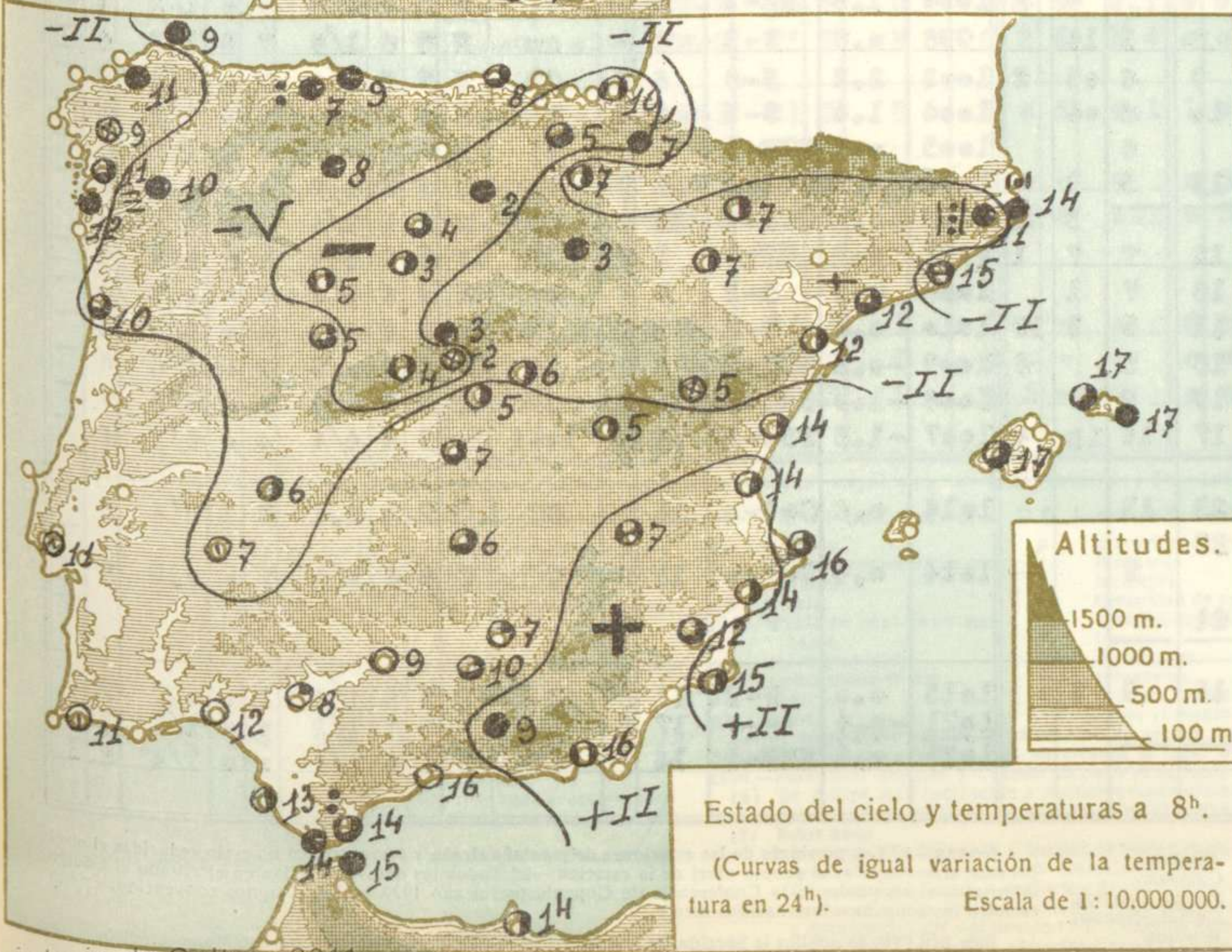
Estado del cielo y temperaturas a 8 h . (Curvas de igual variación de la temperatura en 24 h ). Escala de 1 : 10.000.000.