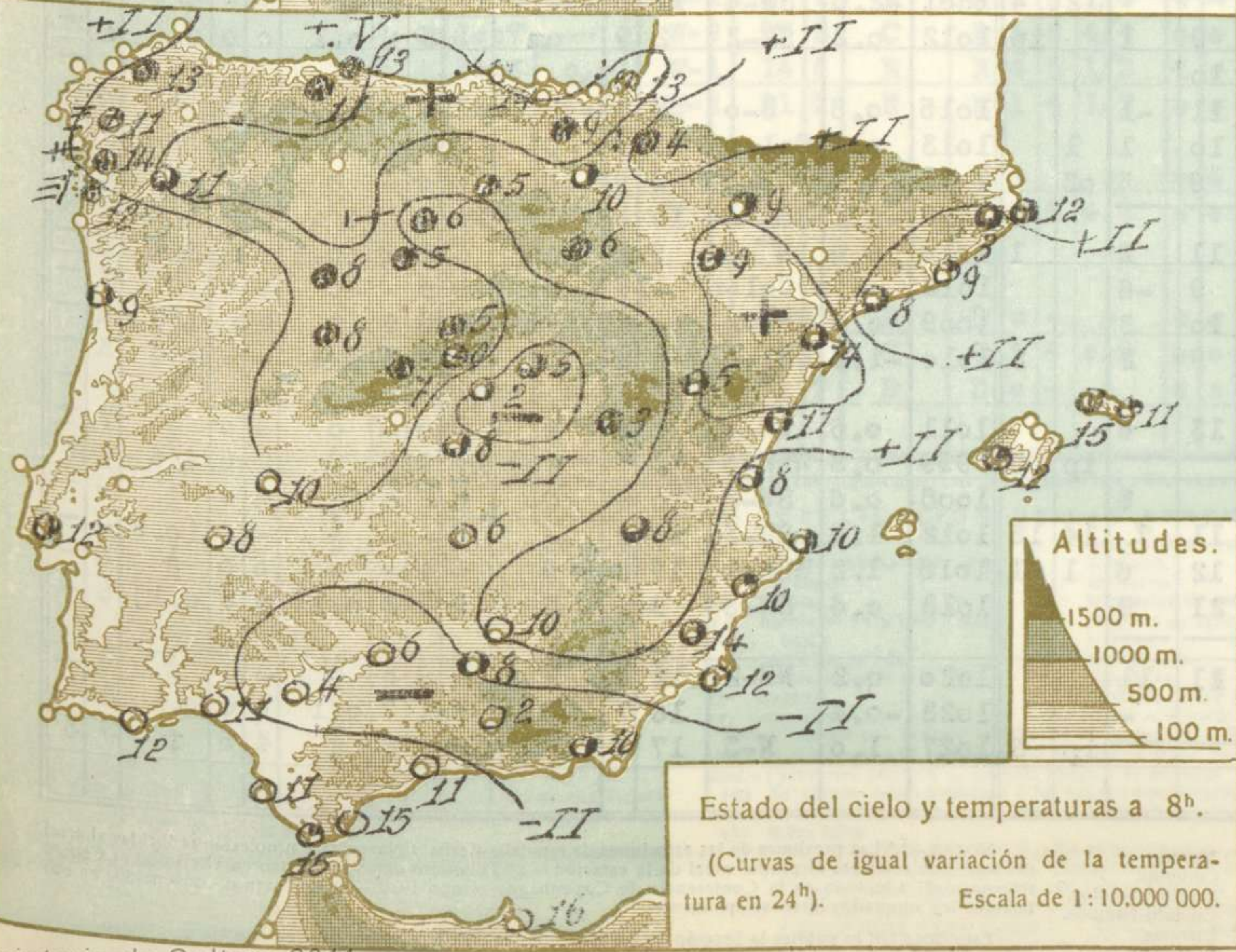
Estado del cielo y temperaturas a 8 h . (Curvas de igual variación de la temperatura en 24 h ). Escala de 1:10.000.000.