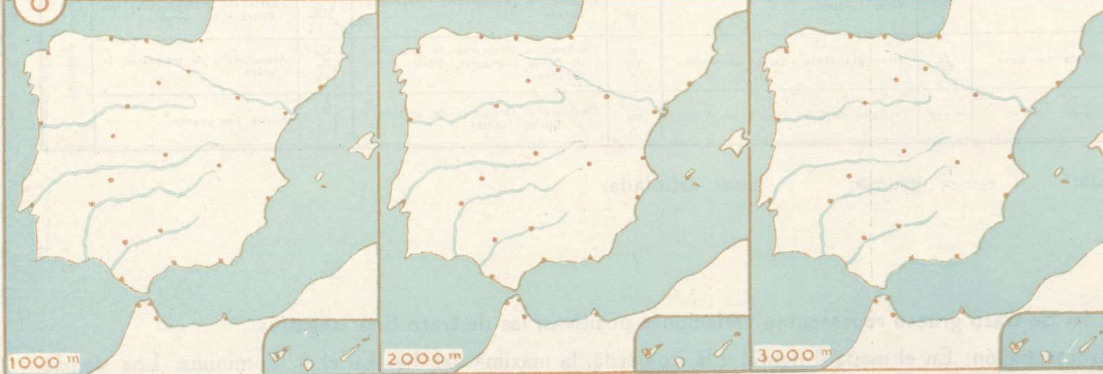
VIENTO EN LA ALTURA A 8" DE HOY