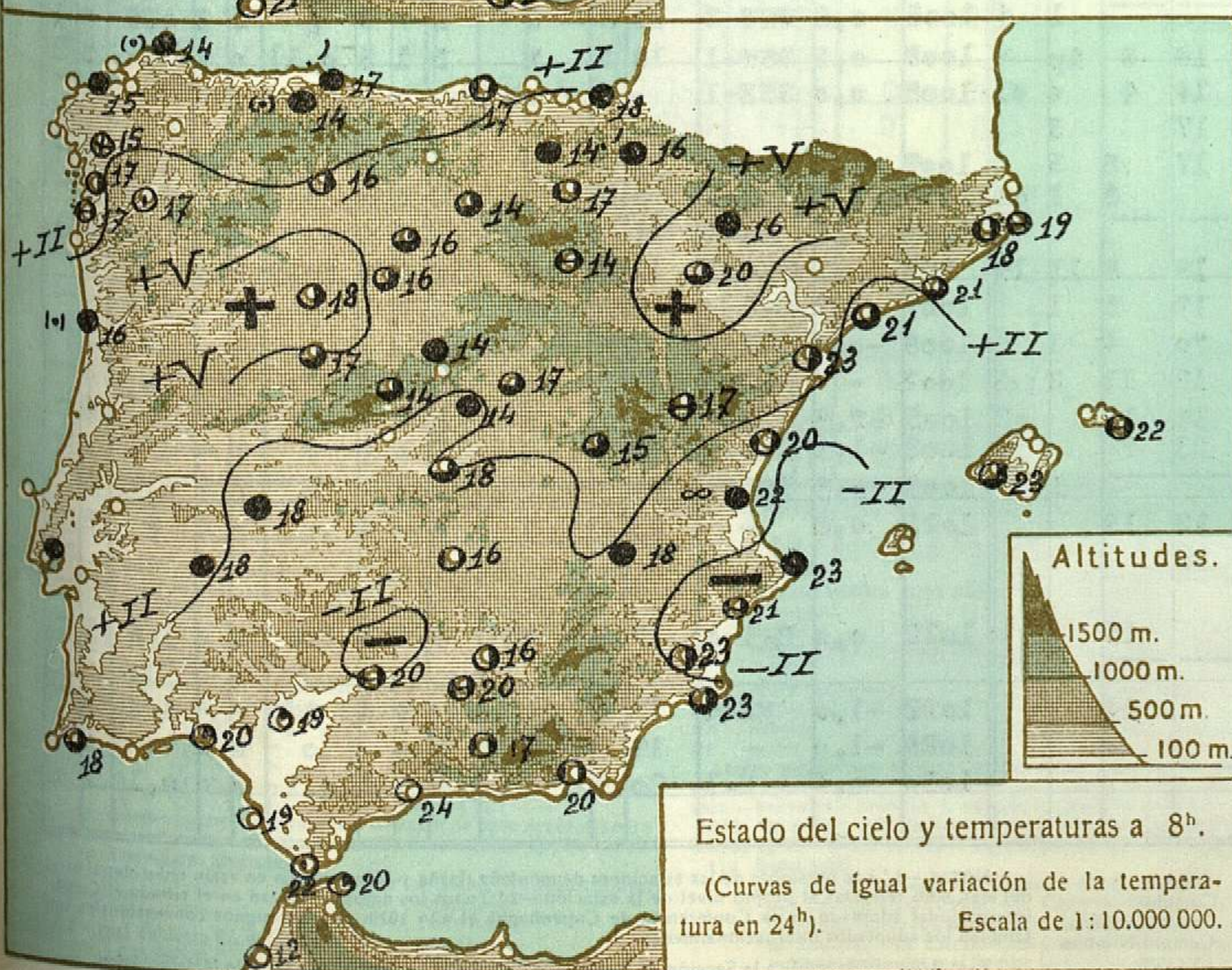
Estado del cielo y temperaturas a 8 h . (Curvas de igual variación de la temperatura en 24 h ). Escala de 1:10.000.000.