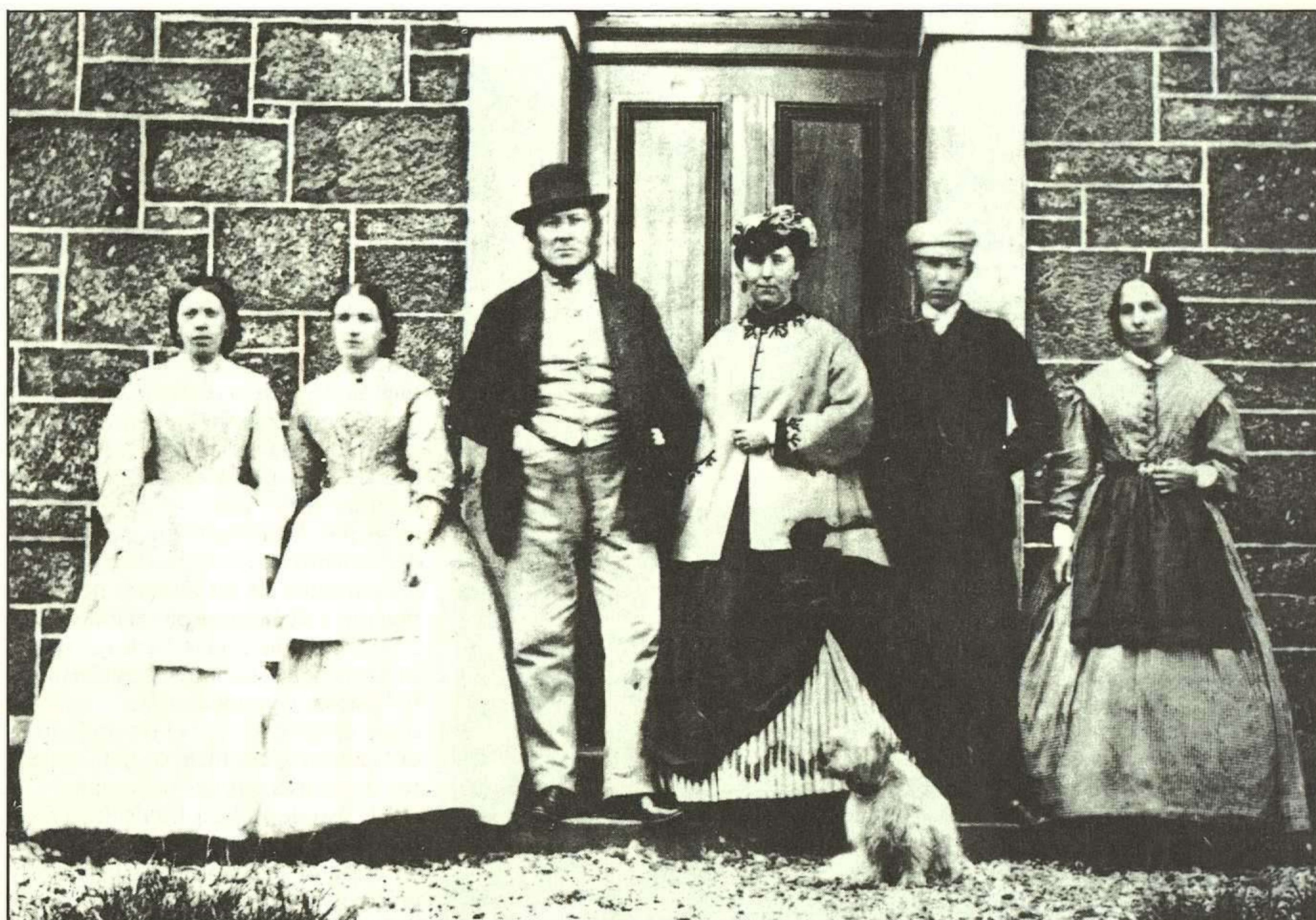
THE ROBERT LOUIS STEVENSON COMPANION, PAUL HARRIS PUBLISHING, EDINBURGH, 1980.