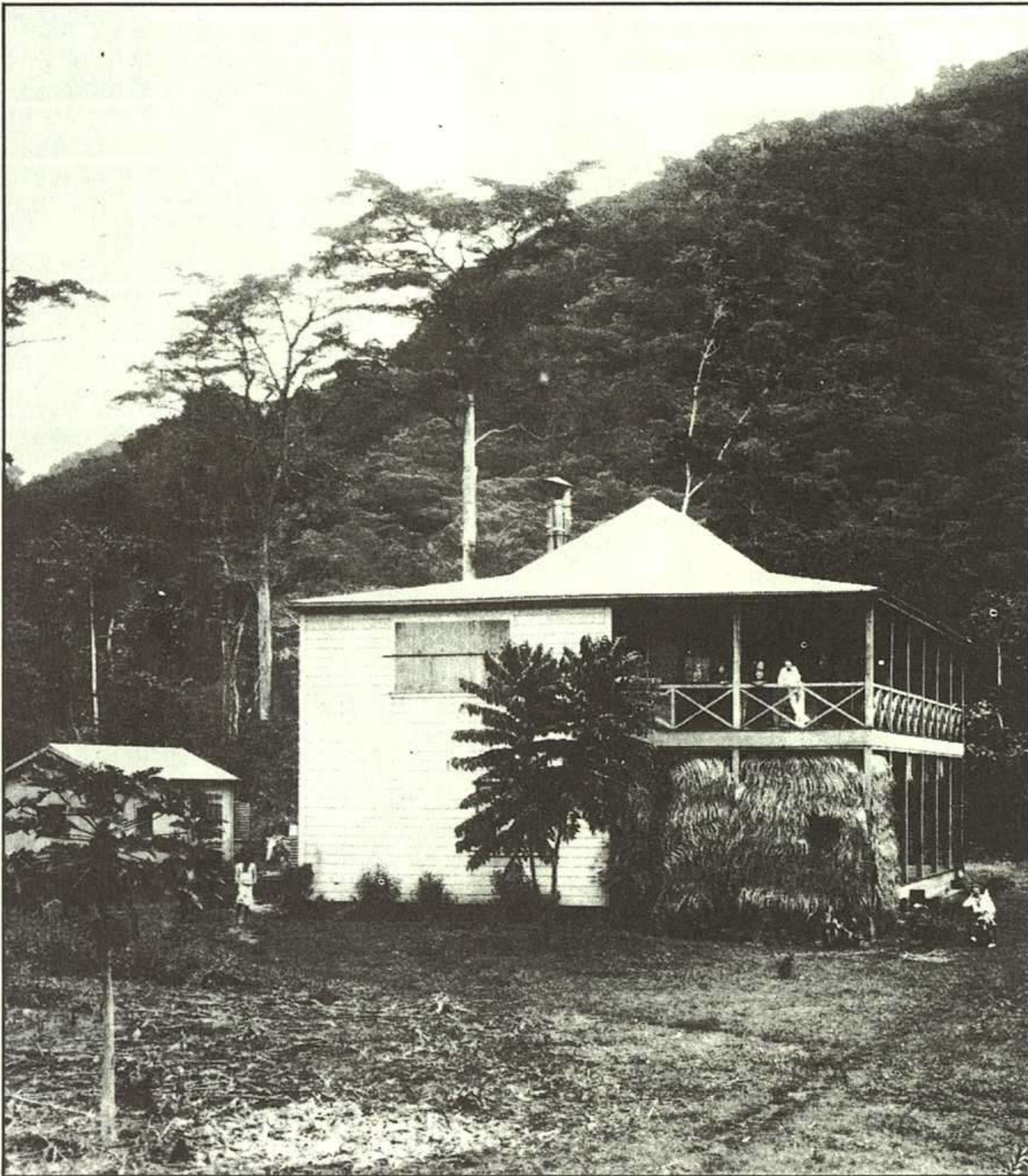
Vailima, la casa de R.L. Stevenson en Apia (Samoa).