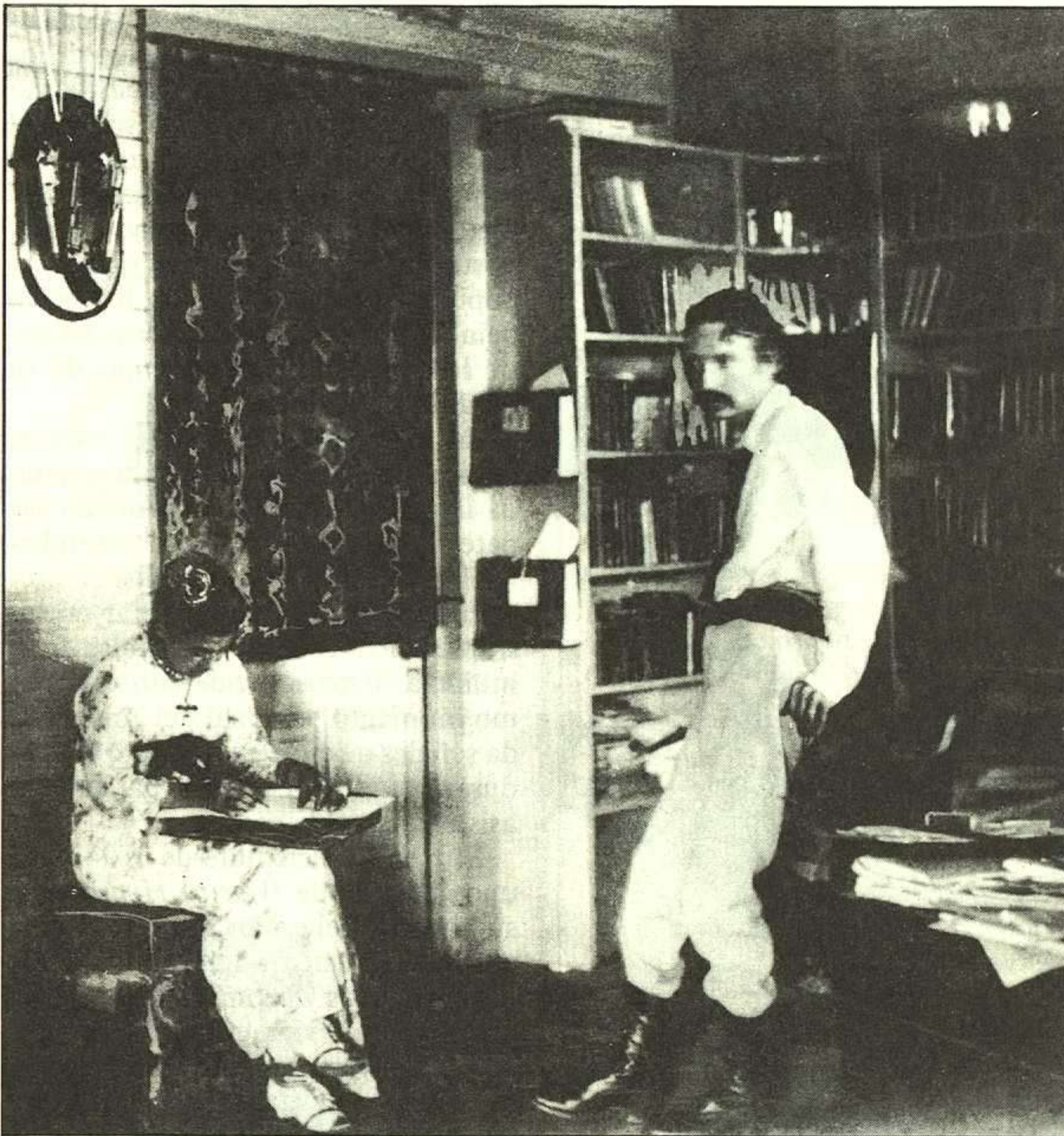
R.L. Stevenson dictando a Belle.

A través de las llanuras, donde refleja también con sensibilidad la humanidad de los emigrantes, pobres gentes a las que considera sus iguales (en lo que la buena sociedad verá escandalosos elementos anarquistas).