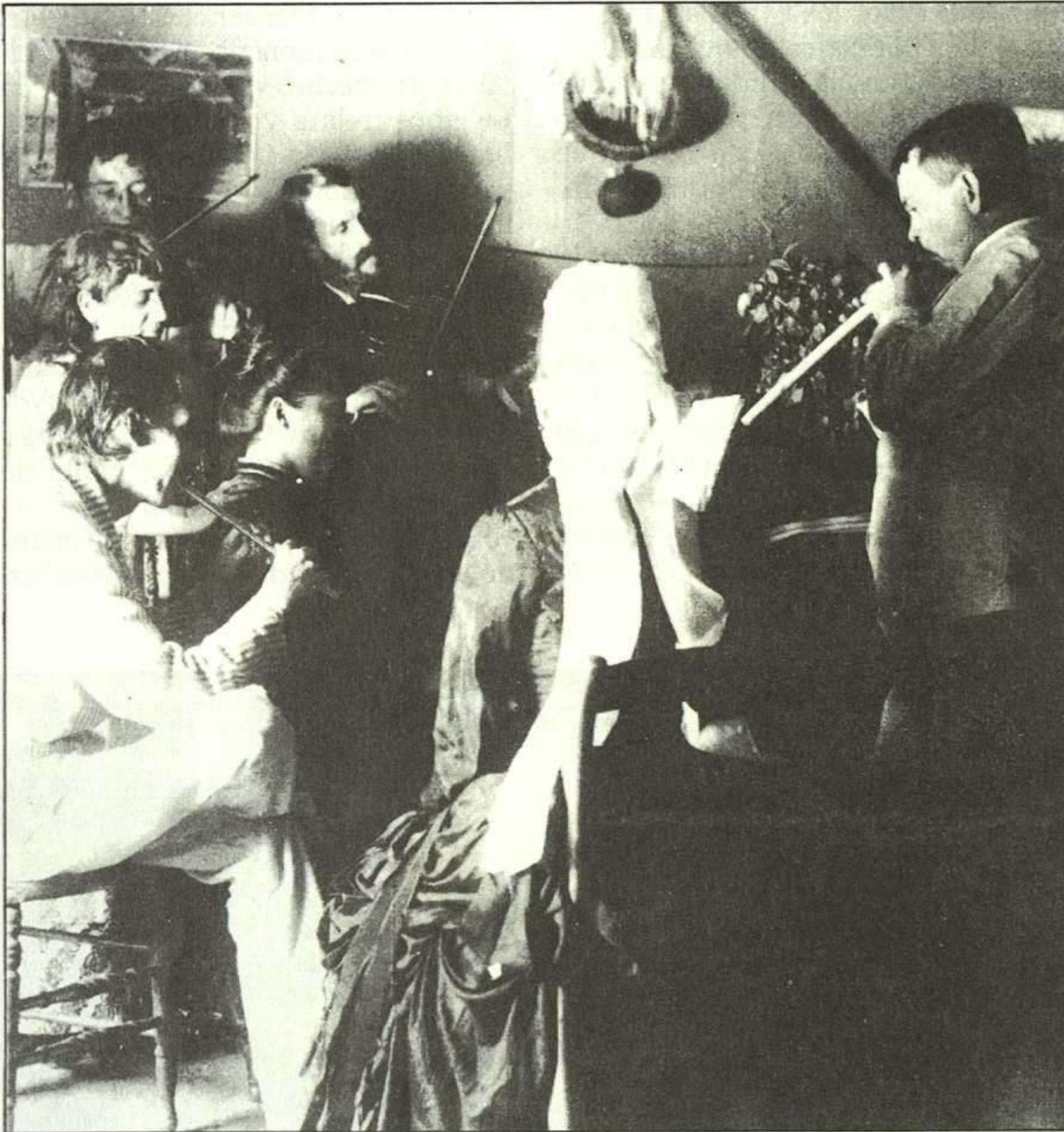
R.L. Stevenson y su grupo musical en la goleta «Casco».

una muerte temprana y yo, como superviviente entre crudos vientos y pertinaces lluvias, he tenido en ocasiones la tentación de envidiar su destino».