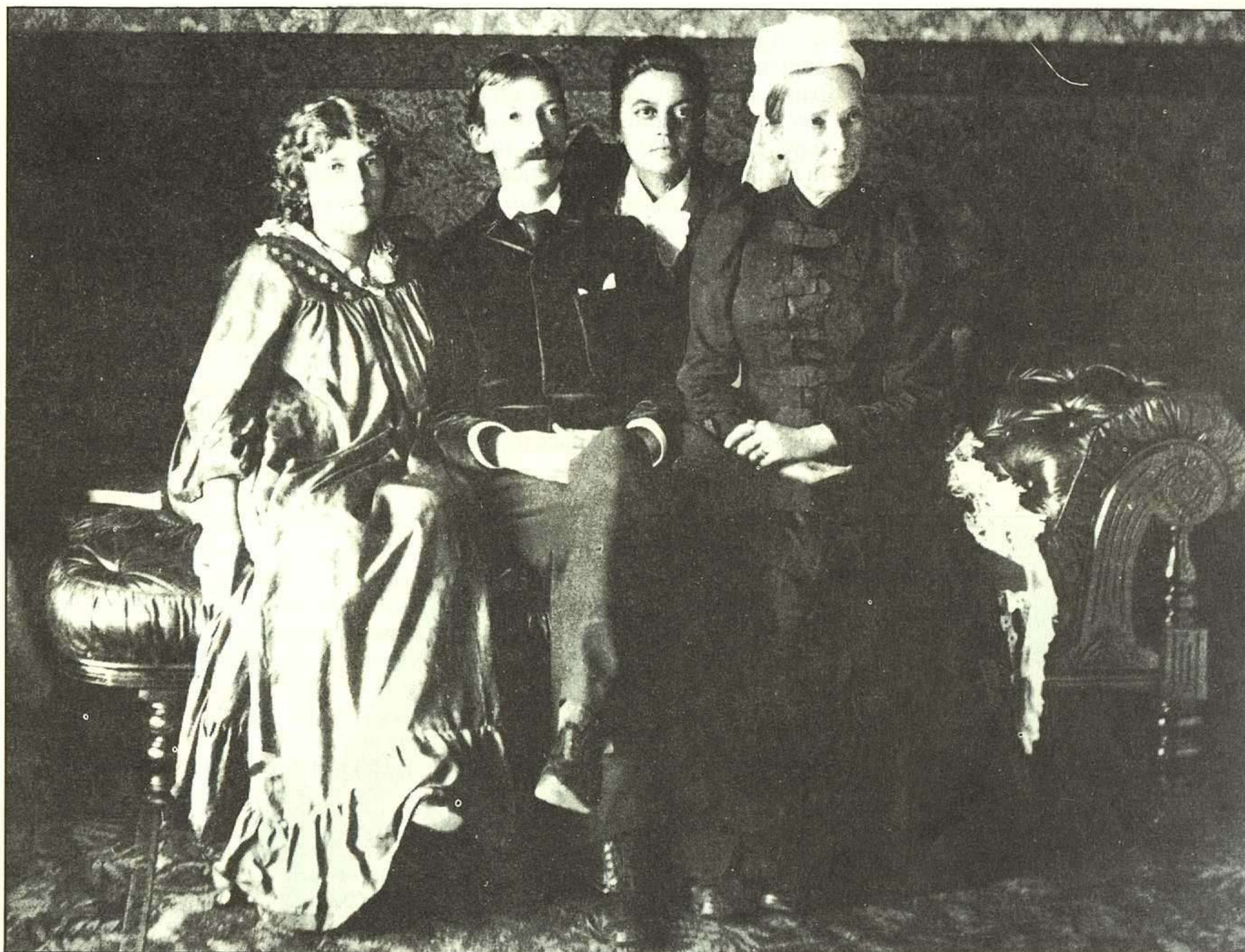
THE ROBERT LOUIS STEVENSON COMPANION, PAUL HARRIS PUBLISHING, EDINBURGH, 1980.