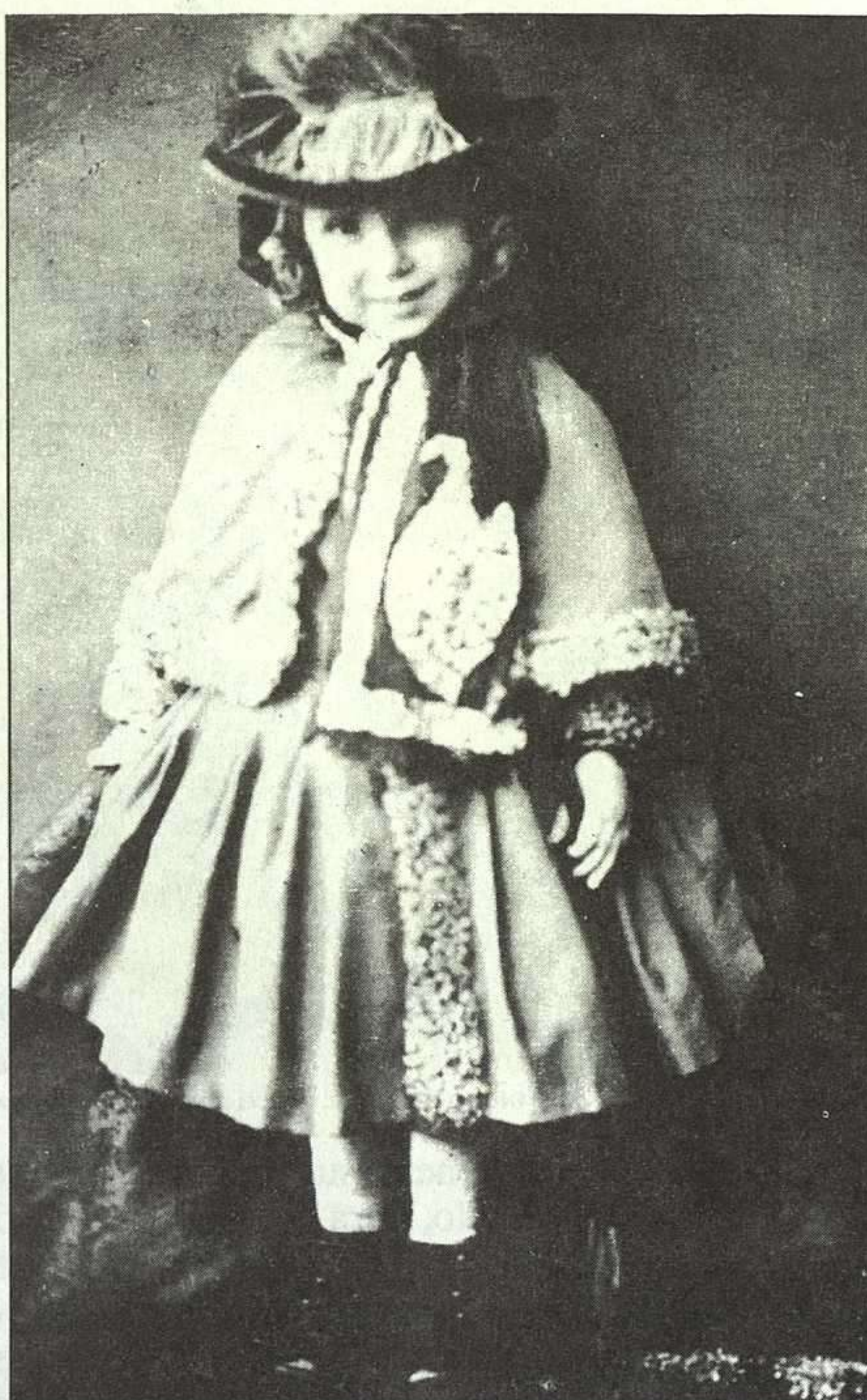
R.L. Stevenson a la edad de 4 años.

Robert Louis Stevenson (1850-1894), autor, entre otros libros famosísimos, de La isla del tesoro, quizás, la primera novela de aventuras del mundo de habla inglesa, constituye una de las personalidades más sugestivas de la literatura universal. Hombre de salud precaria, tras vivir en diferentes lugares europeos, partió hacia las islas de