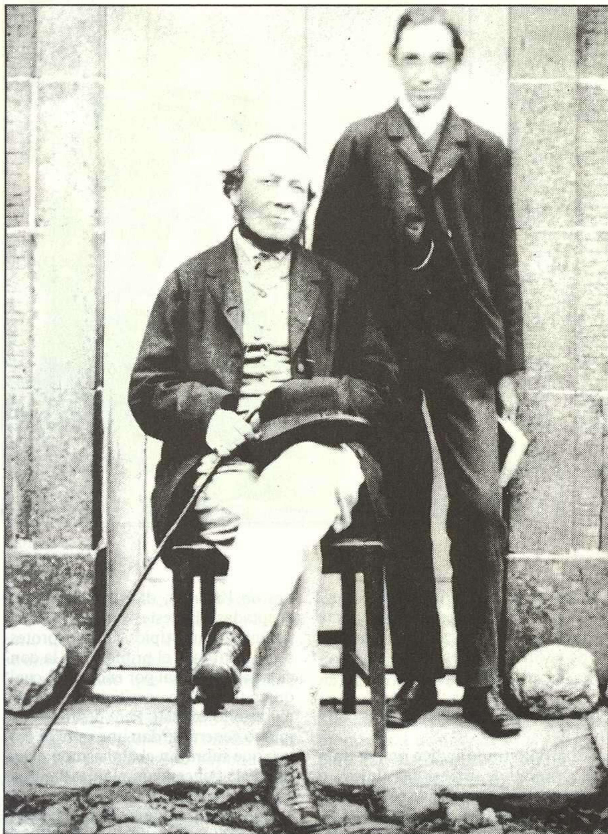
Thomas Stevenson y R.L. Stevenson, 1866.

La actitud moral, dice Stevenson, consiste en estar listos ( readiness ): una disposición amplia y sin ulteriores cualificaciones limitativas. «¿Listos para qué? Para pasar sobre y mirar más allá de los objetos de deseo y de miedo, en busca de algo más.» Listos y despiertos, vivos en la propia conciencia: así nos quiere la verdadera moral y tal es el estimulante propósito de toda educación ética digna de ese nombre. La cual, por cierto, no nos viene primordialmente de los doctores y sus palabras «sino de la afilada férula de la calamidad, bajo la cual