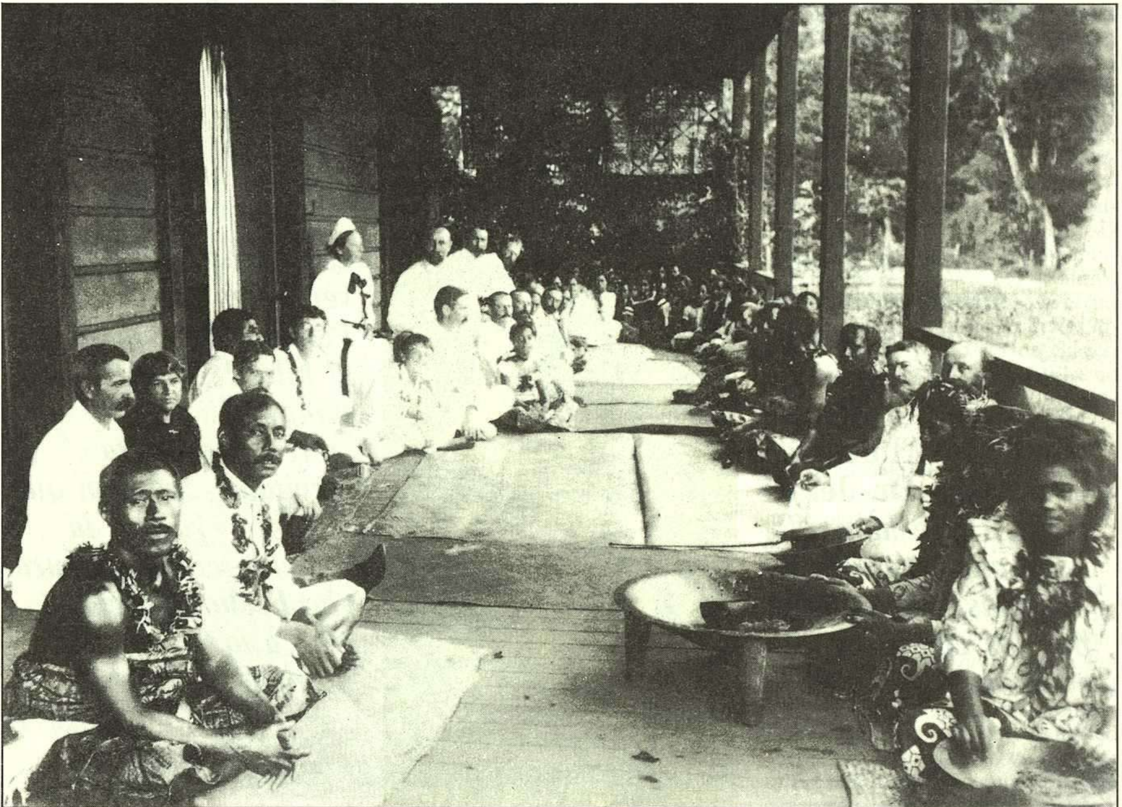
THE ROBERT LOUIS STEVENSON COMPANION, PAUL HARRIS PUBLISHING, EDINBURGH, 1980.