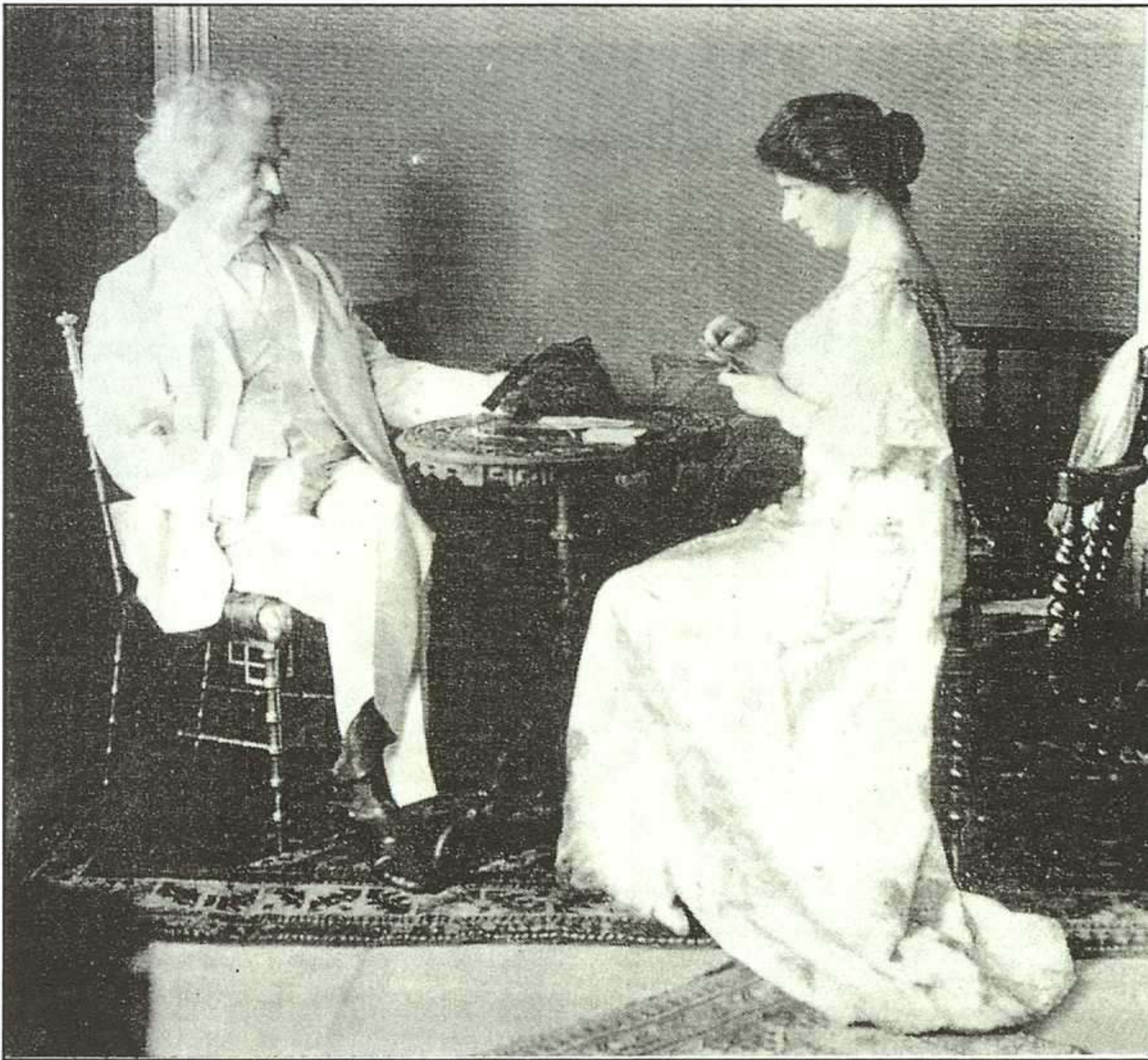
Foto del escritor y su hija Clara jugando a cartas en su casa de Nueva York (1908).