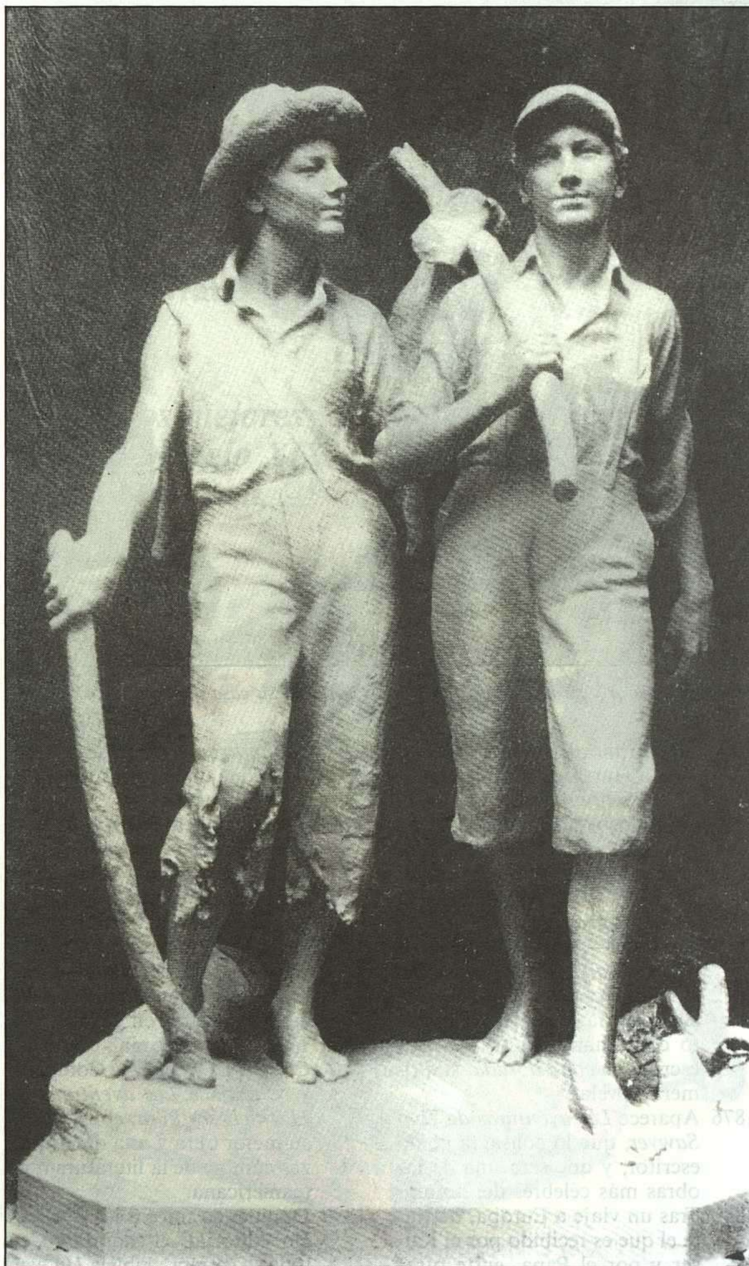
Estatua erigida en honor a Tom Sawyer y Huck Finn en Hannibal (Misuri).