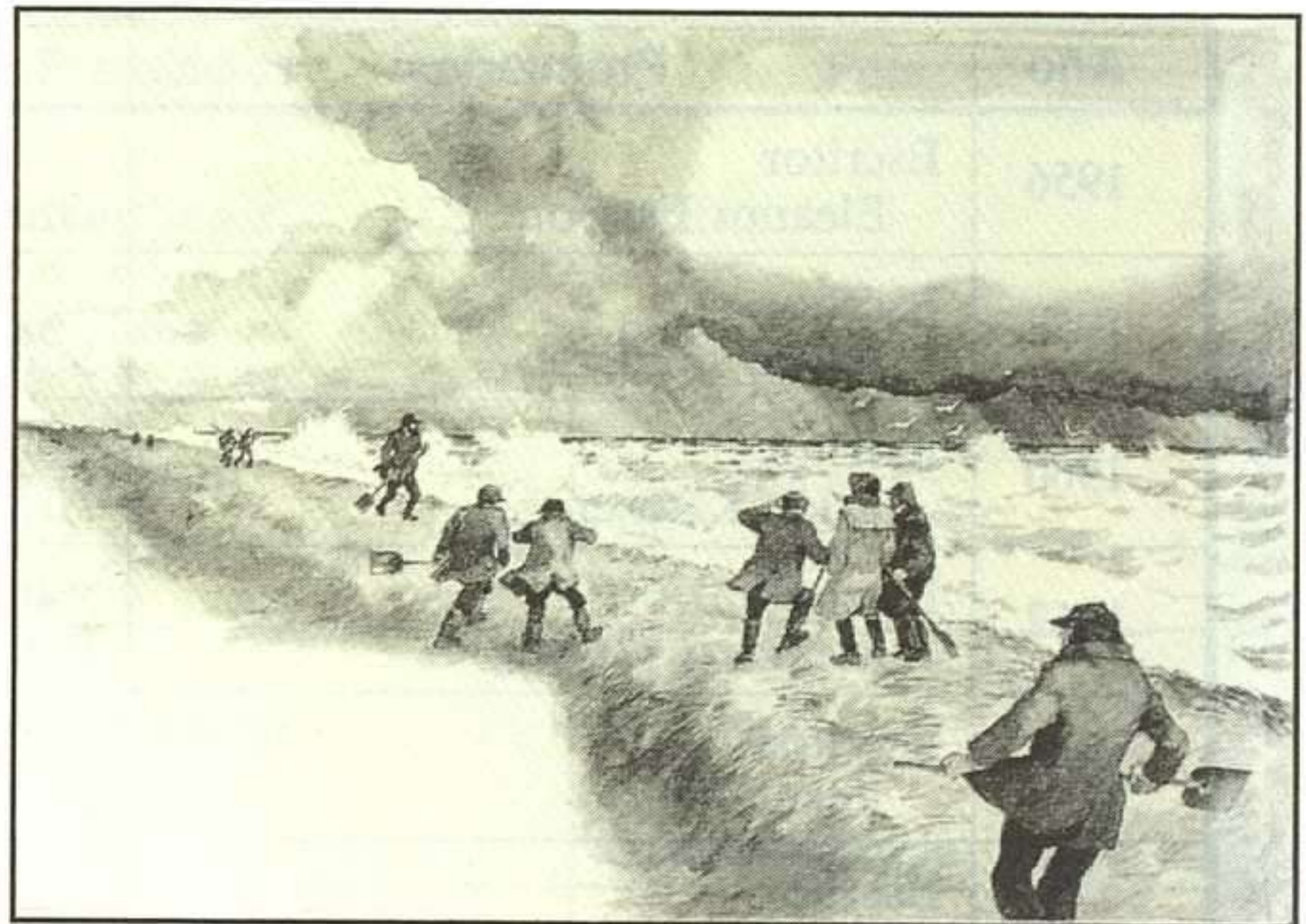
SVEND OTTO S.

Lo primero que resalta en la lista del Premio Andersen es la muy diversa procedencia de sus galardonados. Los más recompensados han sido los creadores de Estados Unidos (país cuya literatura infantil despuntaba en los tiempos en que el miedo a un naufragio te impidió visitarlo); les siguen los de Checoslovaquia, Japón y Dinamarca (curiosamente, los ilustradores daneses han tenido más suerte que los escritores, aunque yo veo la huella tuya tanto en Ib Spang Olsen y Svend Otto, como en la escritora Cecil Boedker). La mayoría de todos los países de Europa tienen algún escritor o ilustrador premiado, pero lo que más te llamará la atención será ver que tierras tan lejanas de tus andares y escrituras, como Australia, Japón, Irán o Brasil, también han aportado grandes talentos al libro infantil.