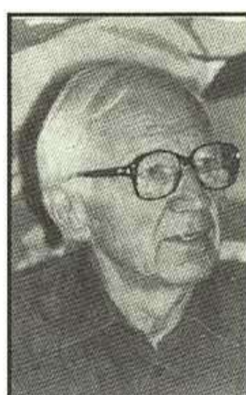
Svend Otto S.

como éste pero, desgraciadamente, en su época no existían los premios literarios.