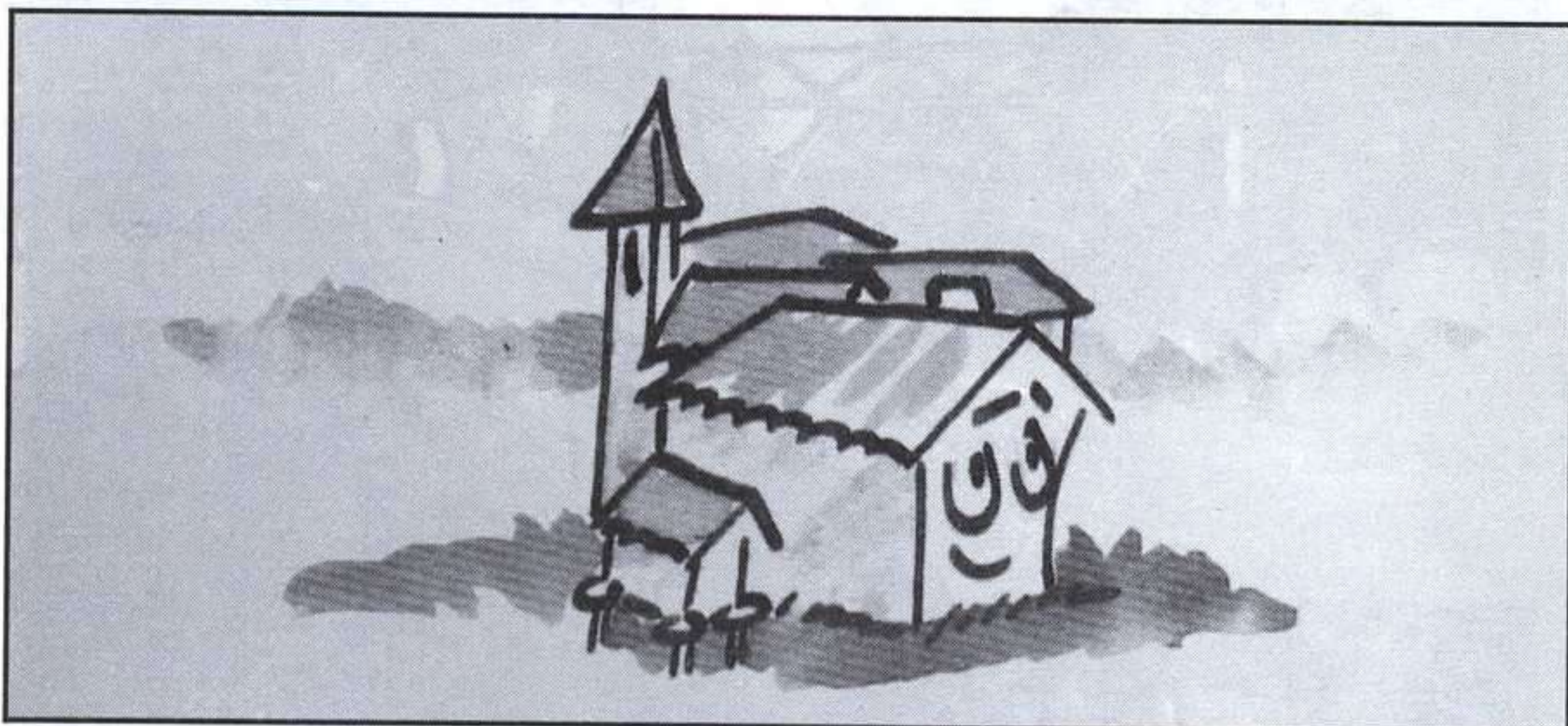
TOKIO, A ALDEA DAS CATRO PRIMAVERAS, SANTIAGO DE COMPOSTELA: SOTELO BLANCO, 1993.