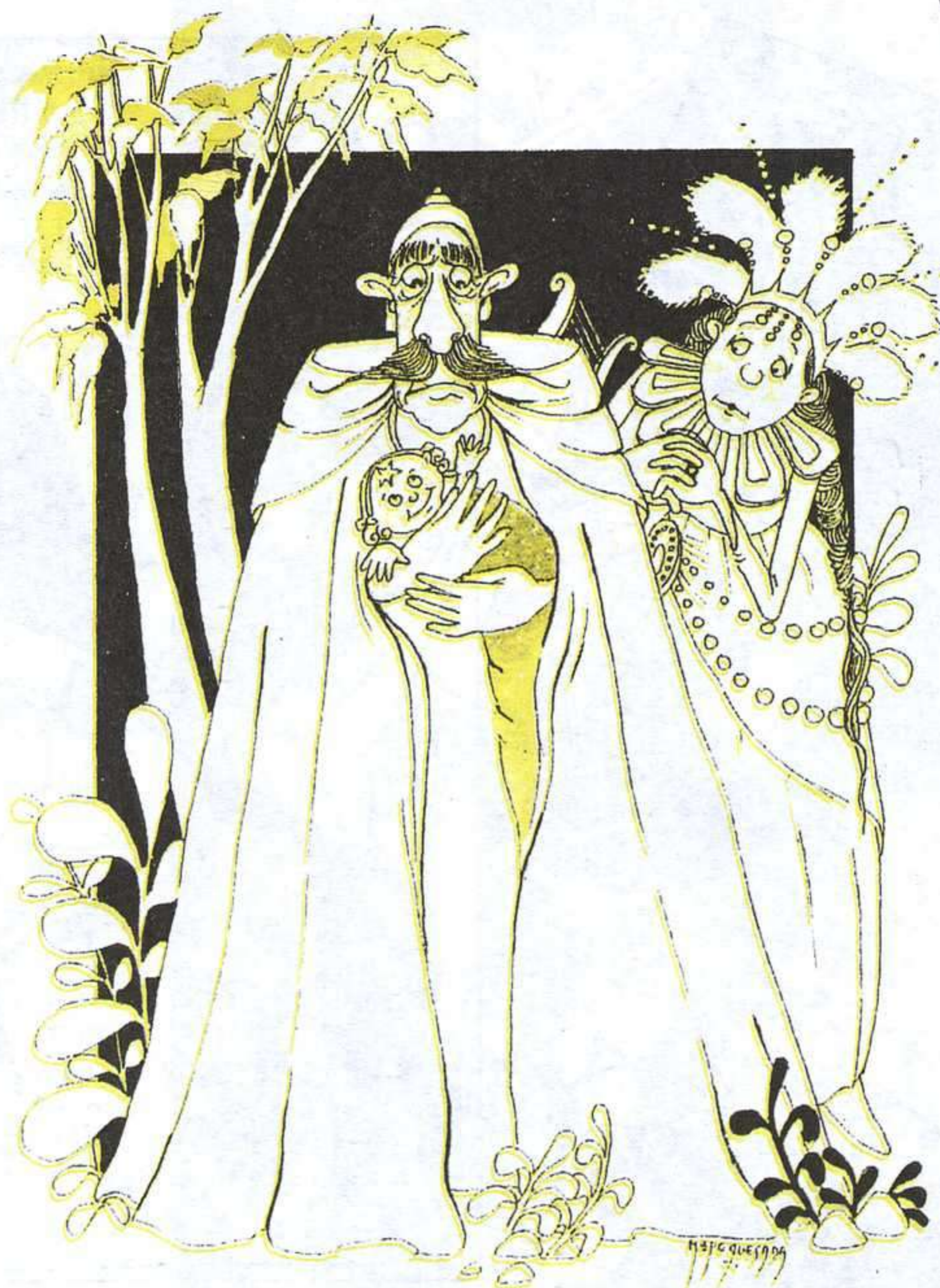
M a FE QUESADA, BRANDÓN, FILLO DE FERREOL, VIGO: XERAIS, 1993.

caracterizando en estos últimos años, y que pueden resumirse en las siguientes: la existencia de un buen plantel de autores reconocidos, una producción editorial sistemática en la que están representados todos los géneros, y un buen nivel de traducciones.