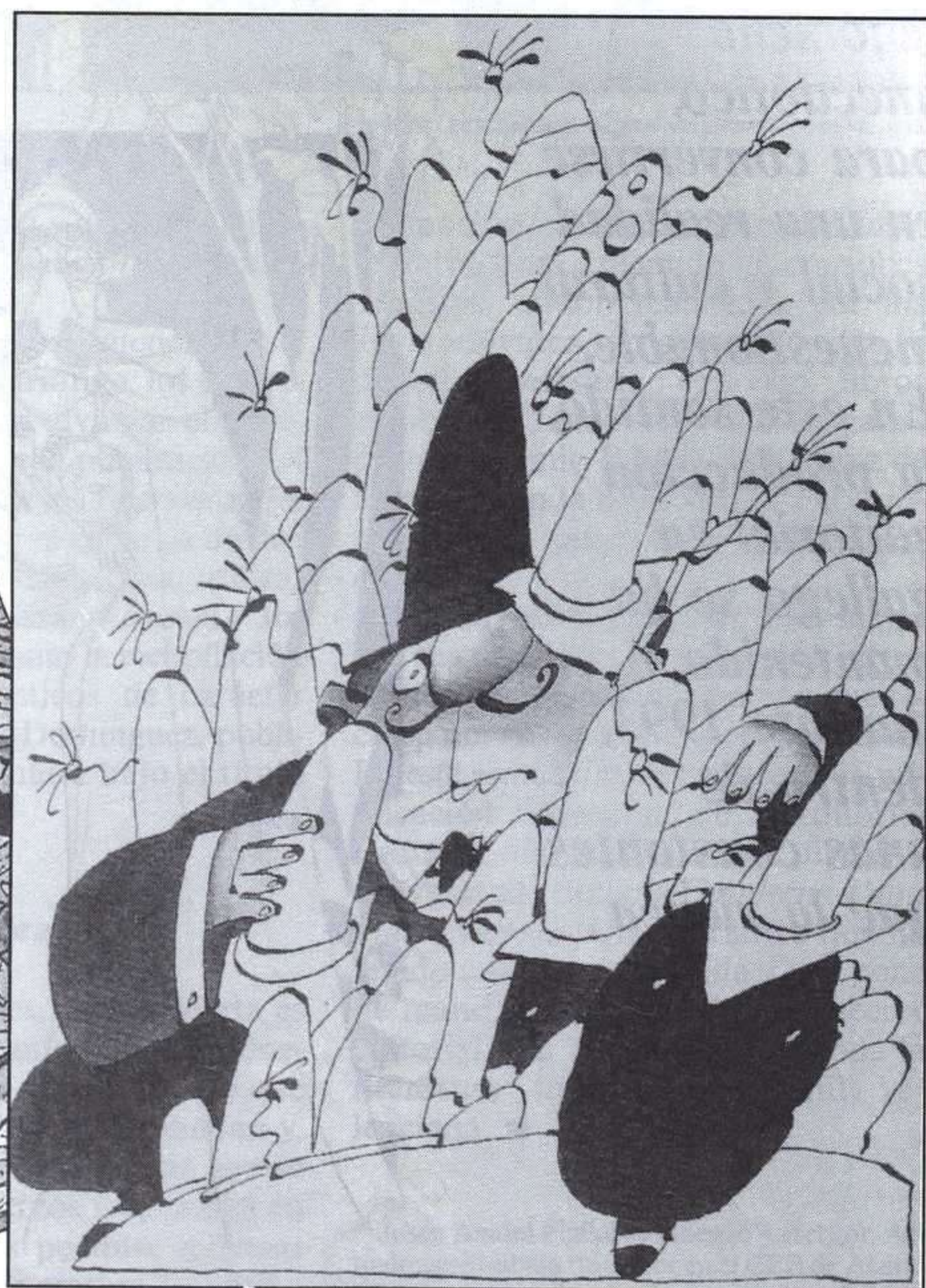
XAN LÓPEZ DOMÍNGUEZ, O CASO DAS CHAVES DESAPARECIDAS, ZARAGOZA, EDELVIVES, 1993.