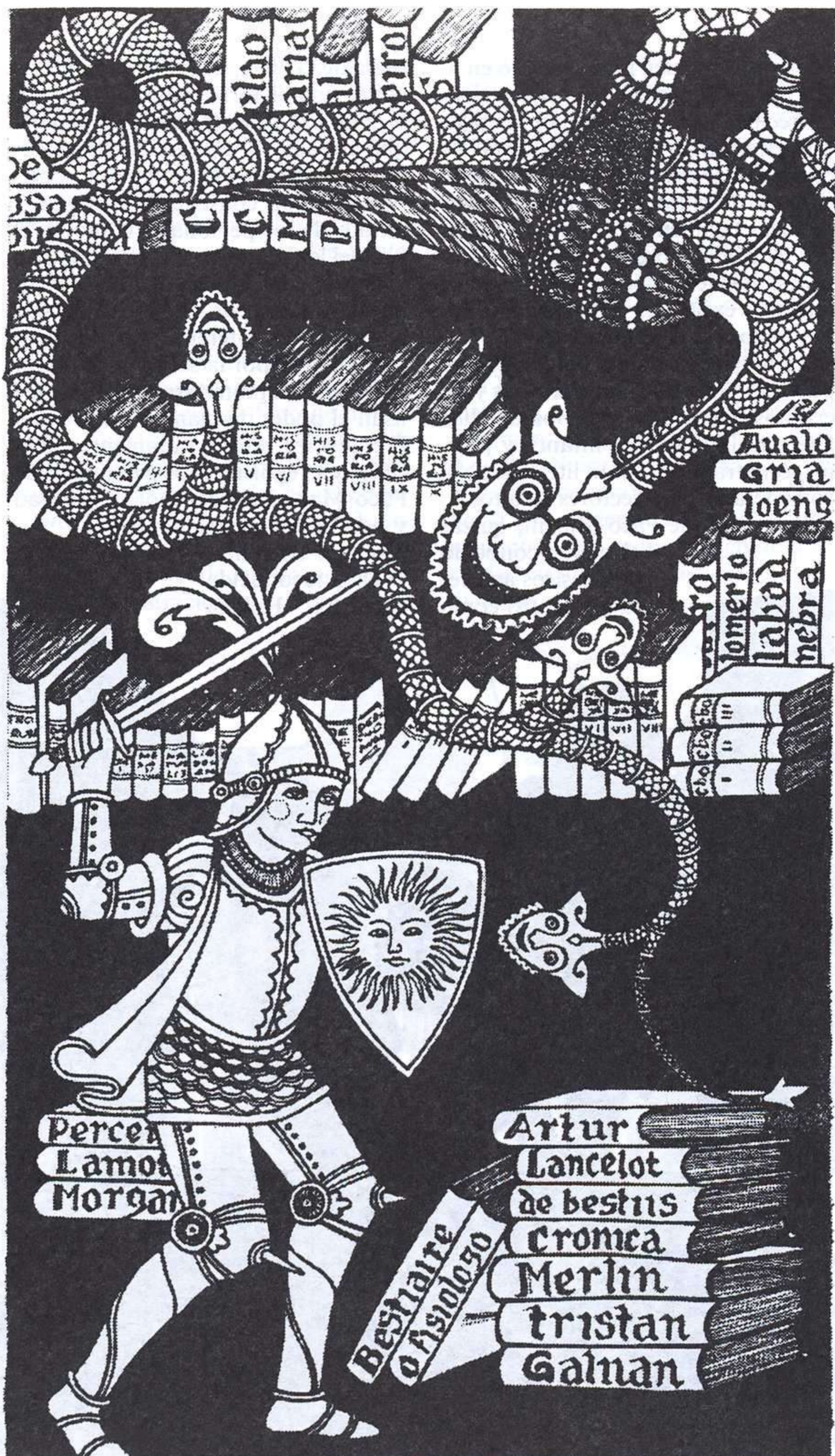
XOÁN BALBOA, AS VIAXES DO PRÍNCIPE AZUL, VIGO: GALAXIA, 1993.

El año 1993, como se mencionaba al comienzo de este artículo, ha tenido unas características muy parecidas a las de los años anteriores; quizá cabe destacar el aumento de traducciones y de reediciones. Se mantiene como una constante el hecho de que la gran mayoría de los títulos originales publicados van dirigidos a lectores y lectoras de una edad entre los 8 y los 13 años, y son muy escasos los libros que se destinan a los más pequeños y a los jóvenes. En cuanto a las temáticas, tampoco ha habido novedades signi-