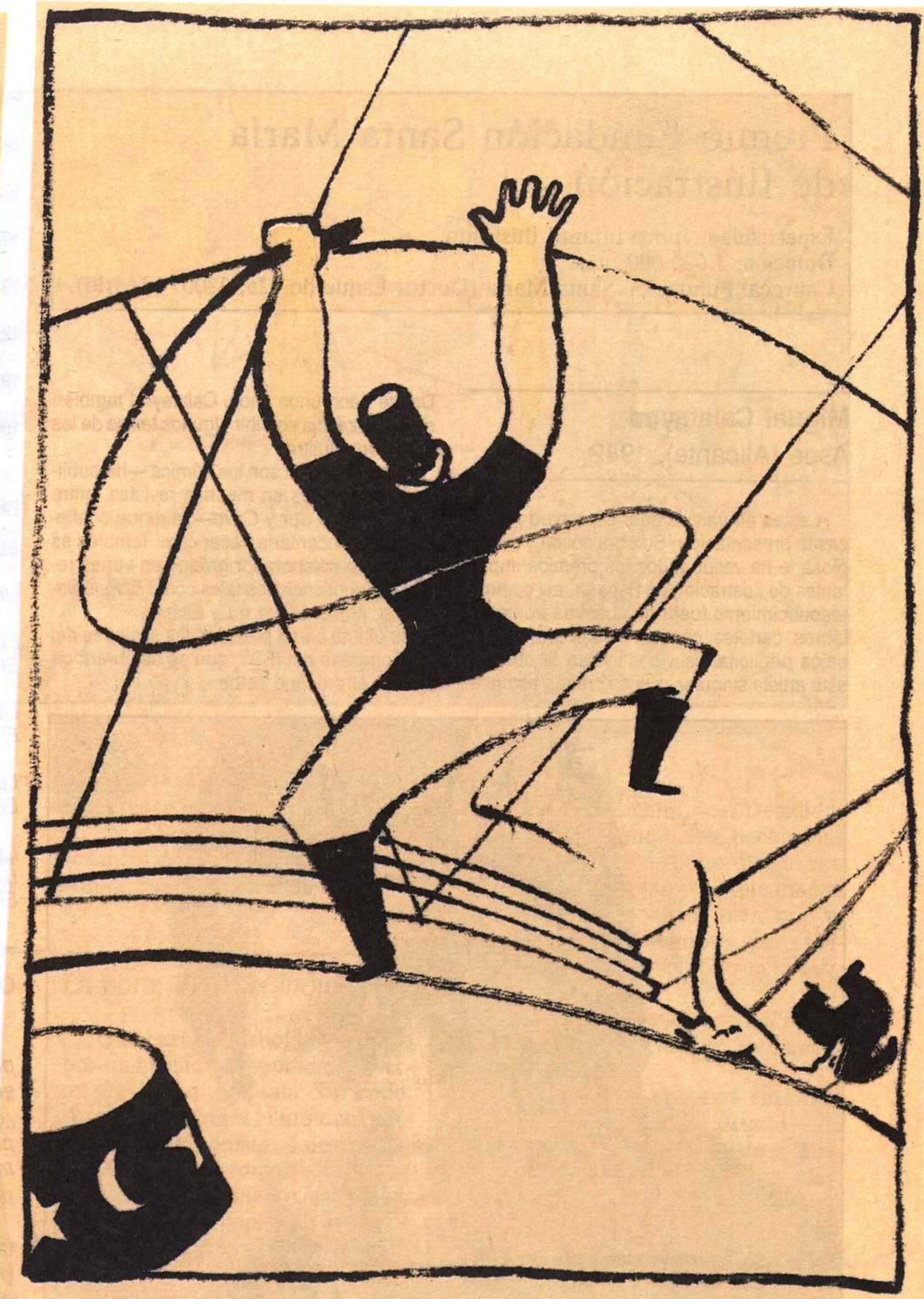
Ilustraciones del libro inédito Més dona menys , reproducido con la autorización de Arnal Ballester y Pep Montserrat.