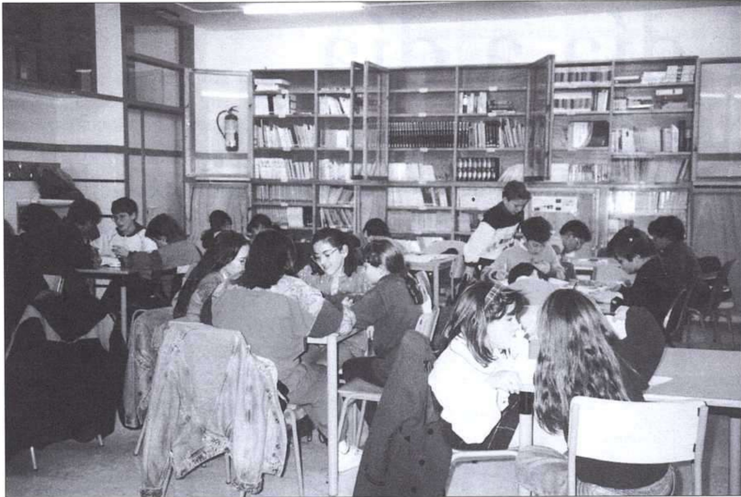
Los grupos-clase acuden a la biblioteca para realizar trabajos, consultar material o para leer.

La biblioteca del colegio «Profesor Santiago Grisolia» de Valencia funciona desde hace ya varios años. Durante este tiempo, hemos tratado de fomentar en los alumnos/as del centro el interés y el gusto por la lectura. Y creemos que, poco a poco, lo vamos consiguiendo.