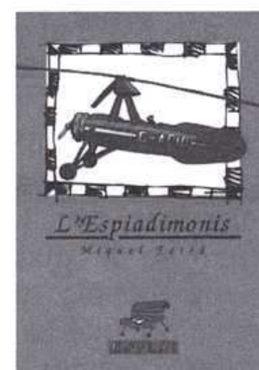
Guanyador del 15è Premi de Narrativa Juvenil Enric Valor