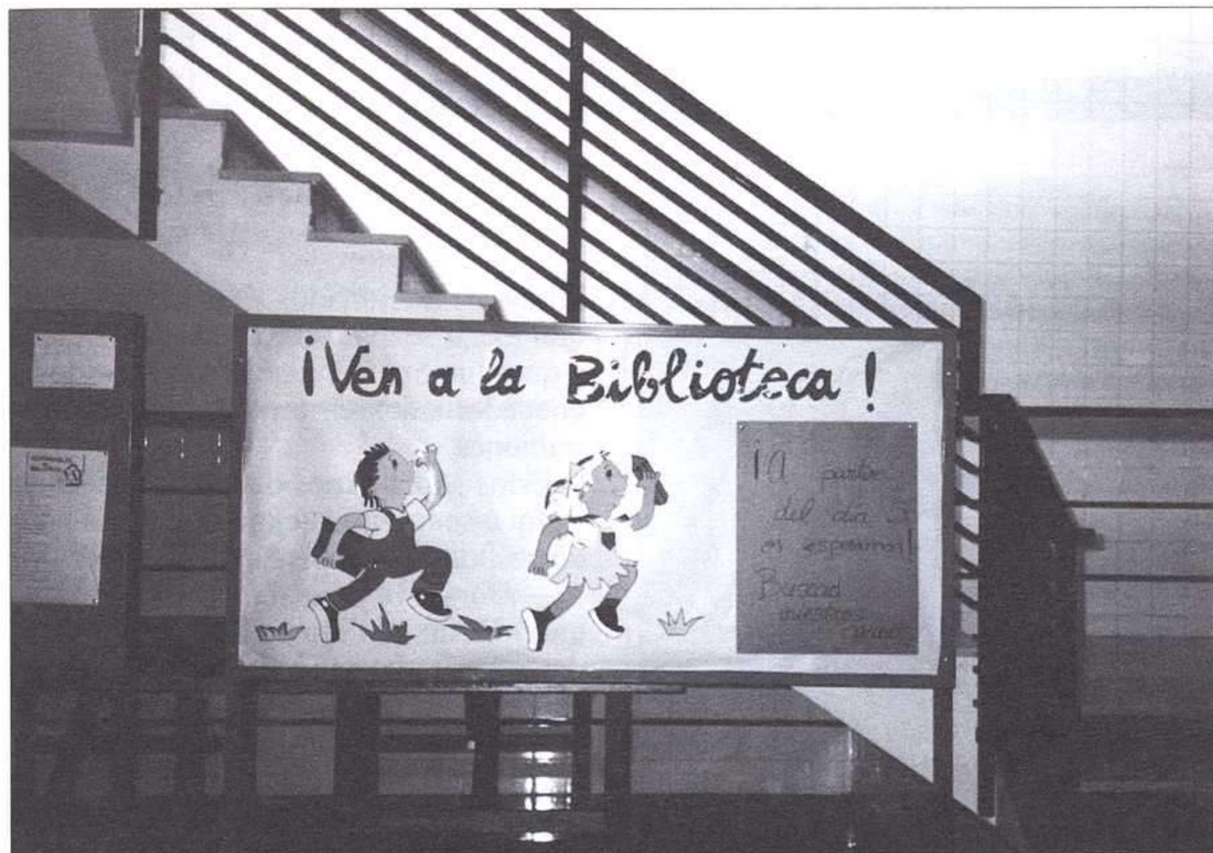
Desde la biblioteca del centro se organizan actividades de animación a la lectura.

Los alumnos que querían participar en esta experiencia, que se realizó en el curso 91-92, debían pintar y recortar las hojas del árbol elegido, añadir los datos adecuados, y pegarlas de nuevo en su sitio. Los árboles pronto se llenaron de hojas.