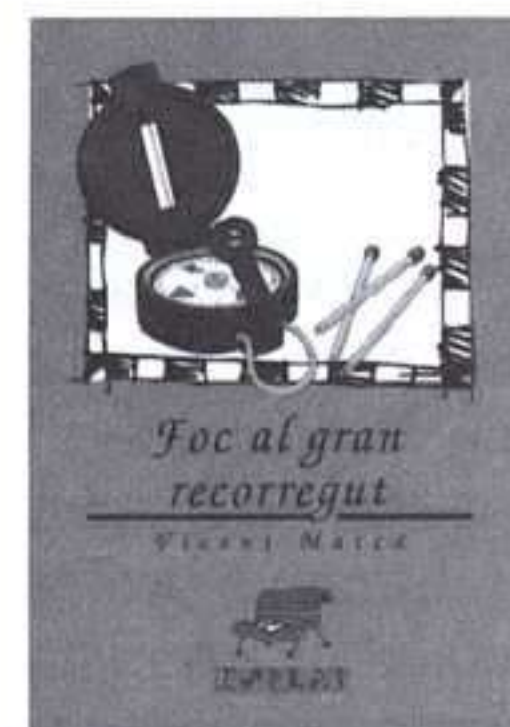
Finalista del 15è Premi de Narrativa Juvenil Enric Valor

carrer de la taronja, 16 46210 Picanya telèfon (96) 156 08 83