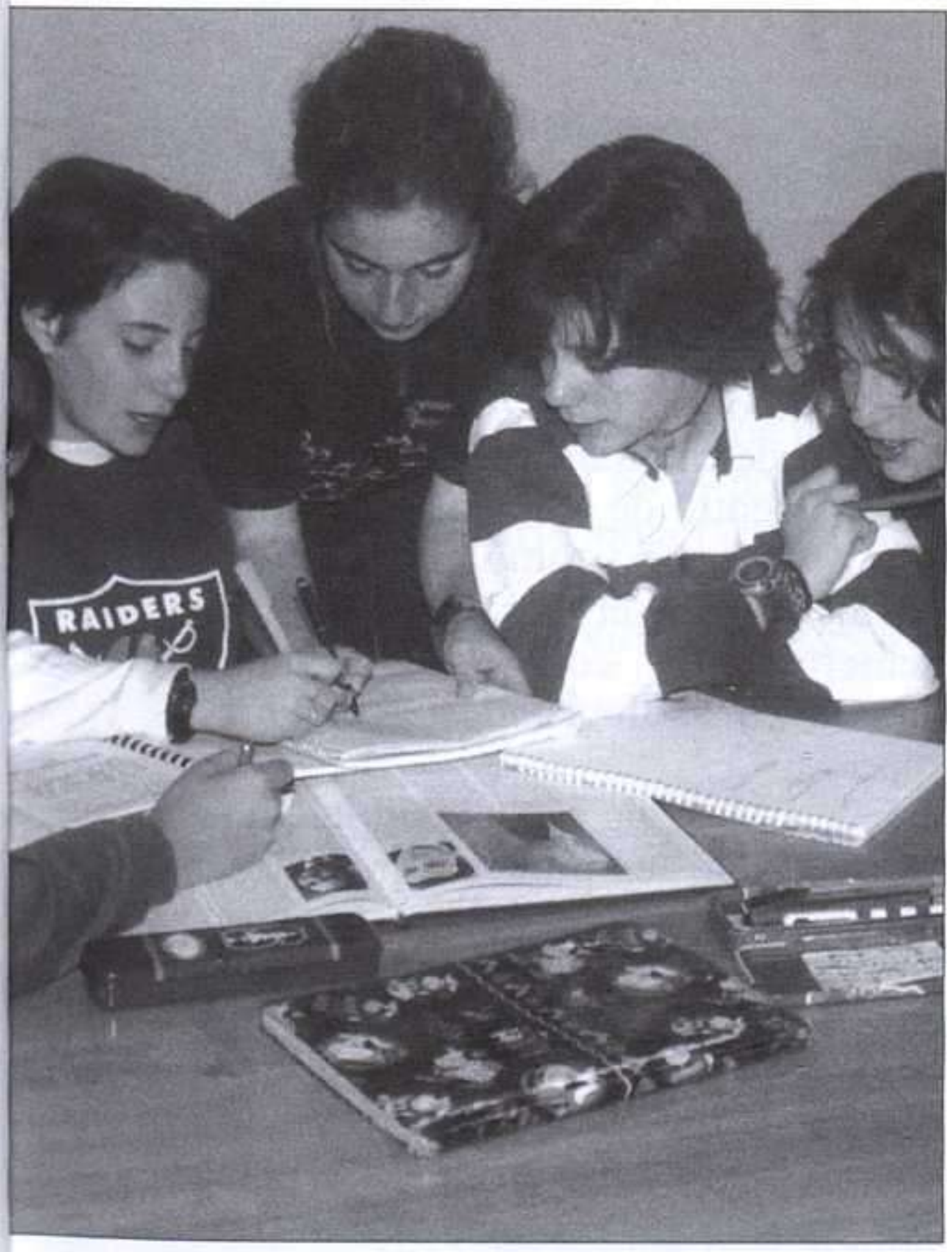
Para conocer mejor al autor se consultaron sus datos biográficos.