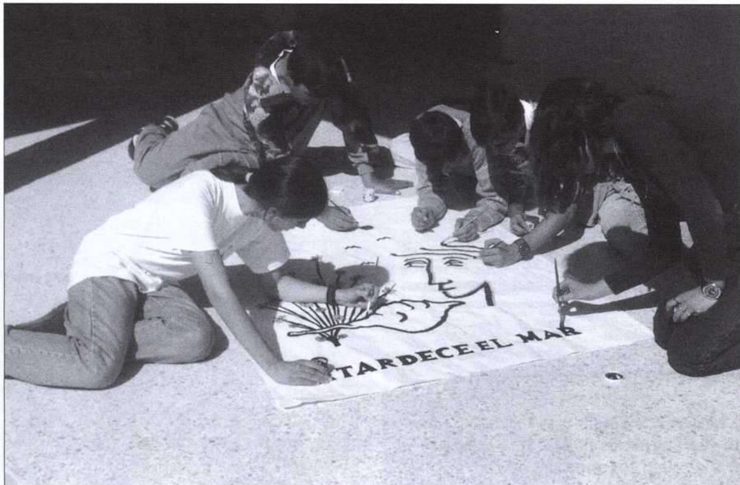
Los alumnos reprodujeron a gran tamaño la portada de Atardece el mar .

En el transcurso del acto, los presentes le preguntaron al artista sobre su poesías, el contenido de las mismas, su simbología, sus deseos, su vida, sus aficiones, acerca de su amistad con Rafael Alberti y de la que mantuvo con Vicente Aleixandre o María Zambrano. Tam-