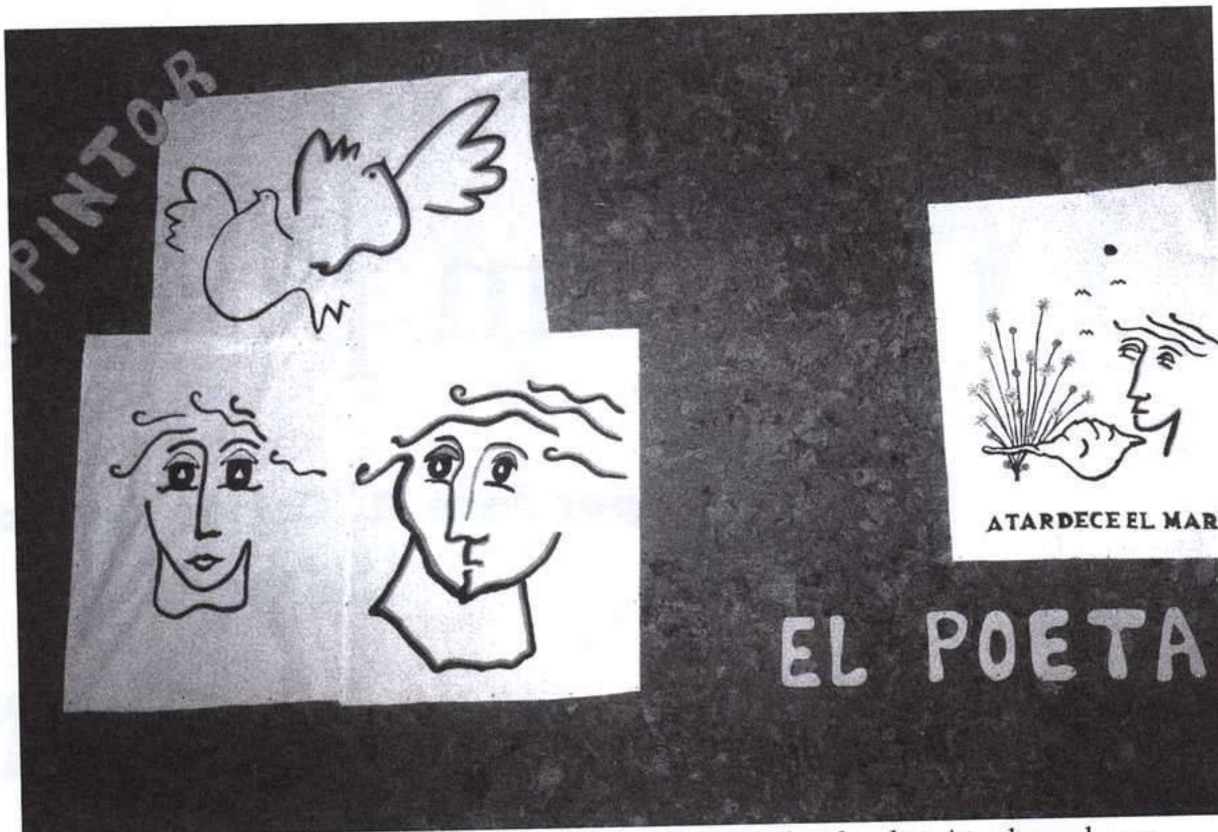
Los alumnos realizaron un trabajo literario y plástico sobre la obra Atardece el mar .

leer a un poeta en vida, de reconocido prestigio, que además reside en nuestro municipio y se ofrece a platicar con nosotros de versos y vivencias.