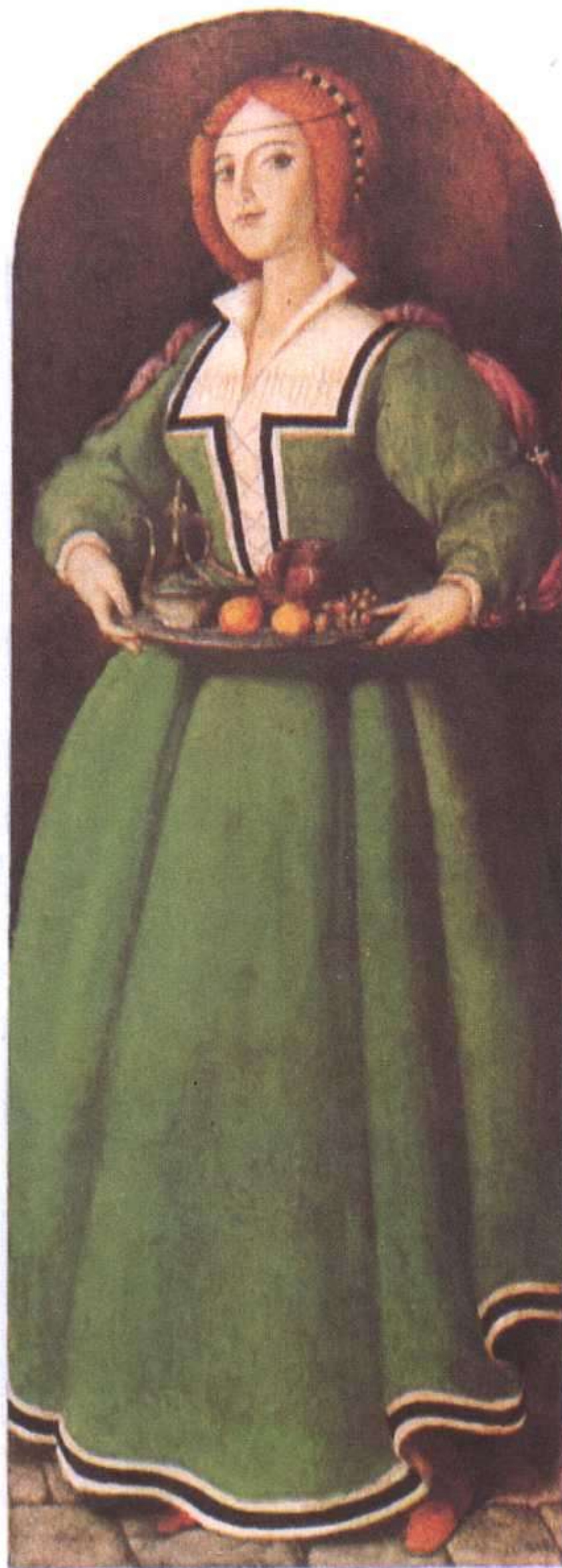
GUENNADU SPIRIN, LA ILUSTRE FREGONA Y OTROS CUENTOS CLÁSICOS, EVEREST, 1989.

no de nosotros olvidó su misión: descubrir dónde estaba el Castillo de los Libros.