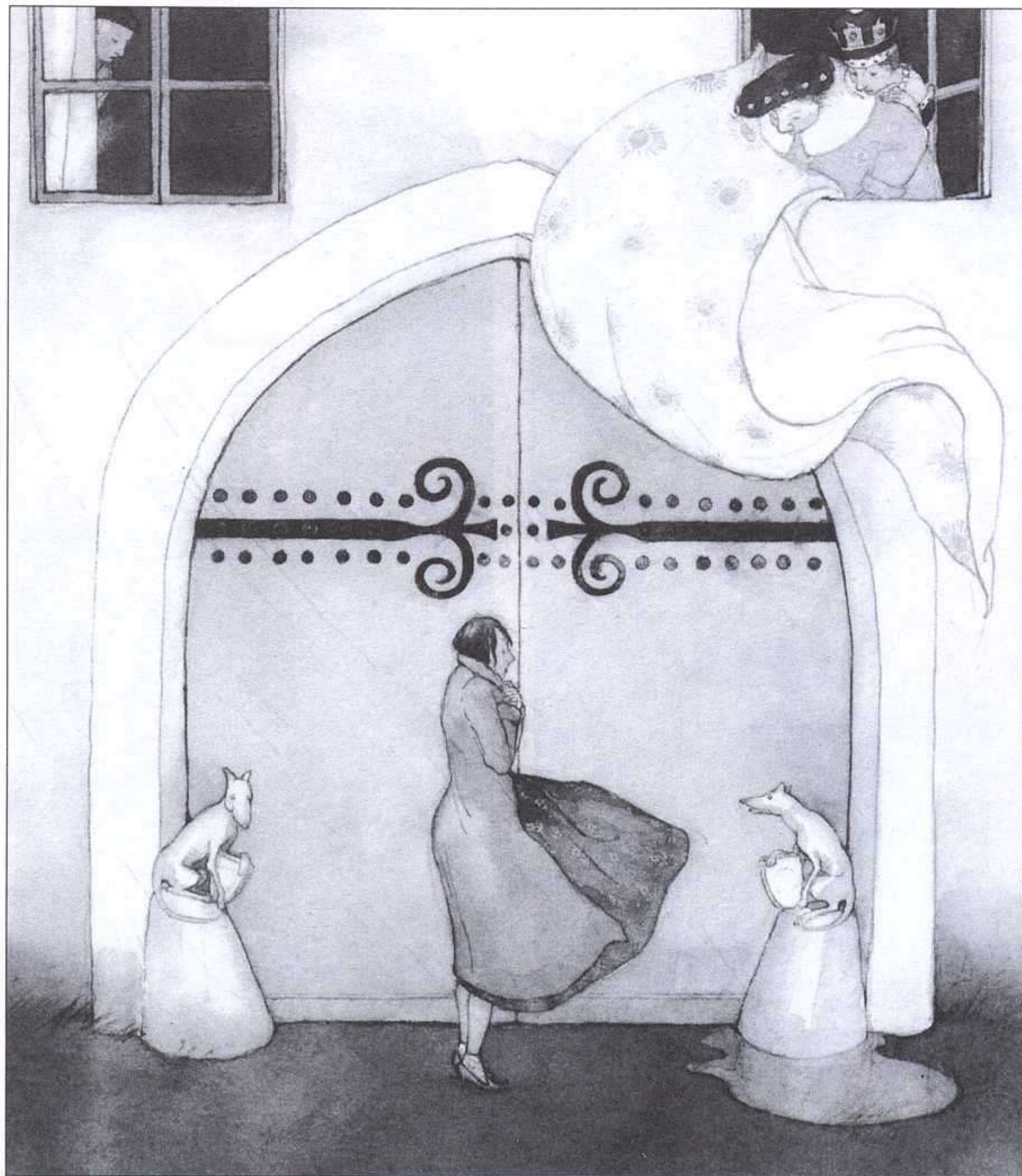
LISBETH ZWERGER, CUENTOS DE ANDERSEN, GAVIOTA, 1993.

Ni que decir tiene que la respuesta de mis chavales fue unánime: todos se comprometieron —en una ceremonia solemne que celebramos días después— a devorar los cuentos con entusiasmo, y a pasar todos los días un buen rato jugando y charlando (en una palabra, leyendo) con sus amigos de los cuentos. ¡Ah, eso