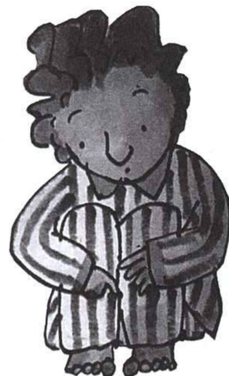
EMILIO URBERUAGA, OLIVIA Y EL FANTASMA, SM, 1997.