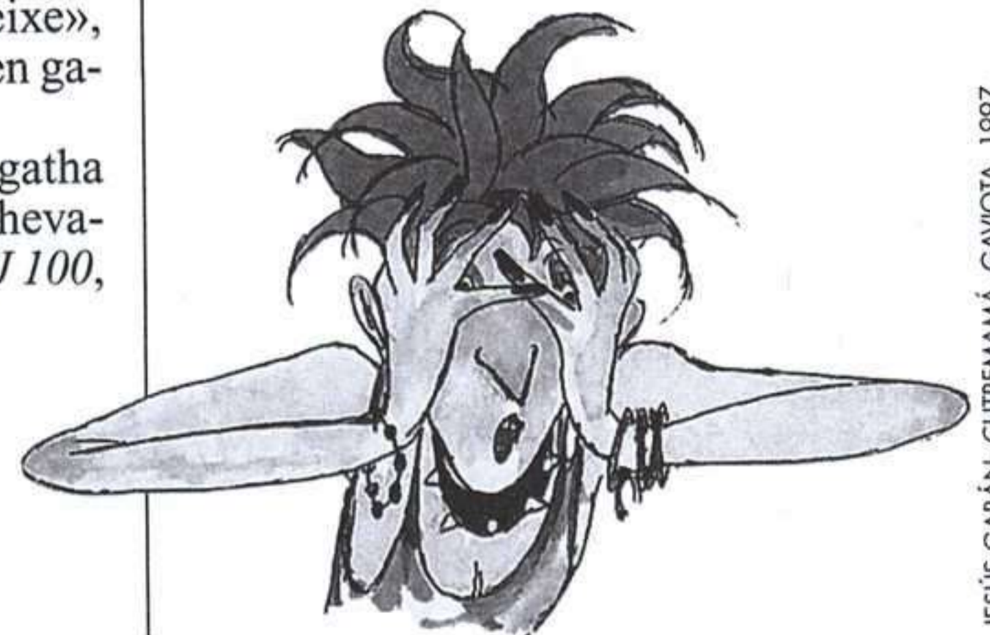
JESÚS GABÁN, CUTREMAMÁ, GAVIOTA, 1997.