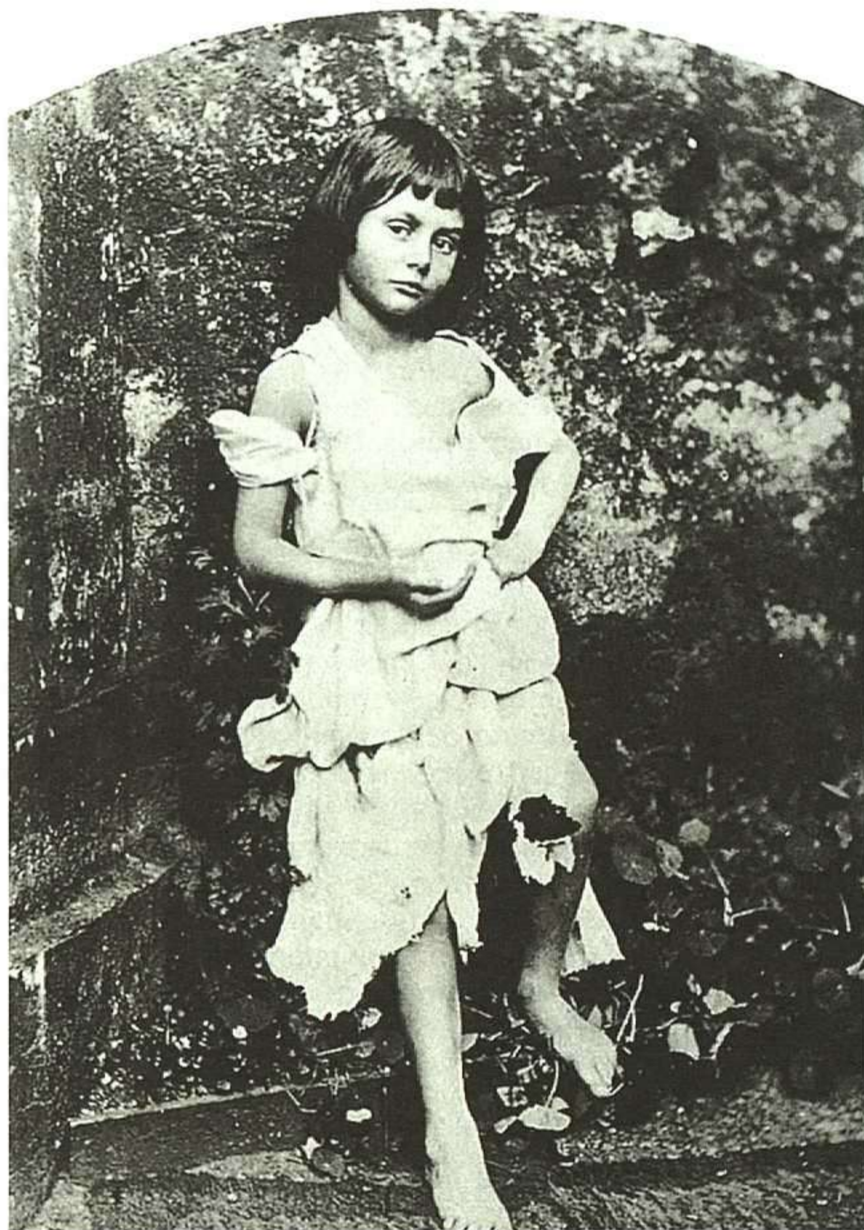
Foto de Alice Liddell, realizada por Carroll y publicada, junto a otros muchos retratos de jóvenes impúberes, en Niñas (Lumen, 1998), libro que profundiza en el mundo del Carroll fotógrafo.

Como es sabido, la rutinaria existencia del joven Charles Lutwidge Dodgson se vio alterada, a lo largo del año 1856, por tres acontecimientos esenciales: adquirió su primera cámara fotográfica, conoció a Alice Pleasance Liddell —la pequeña musa inspiradora de su obra más celebrada— y comenzó a utilizar el seudónimo de Lewis Carroll . A partir de la invención del famoso seudónimo, Dodgson y Carroll convivirían, como el doctor Jekyll y mister Hyde, en un solo organismo corporal, pero ejercerían funciones dispares, escindidas por una barrera infranqueable: a un lado de ella actuaría el clérigo y profesor ad-