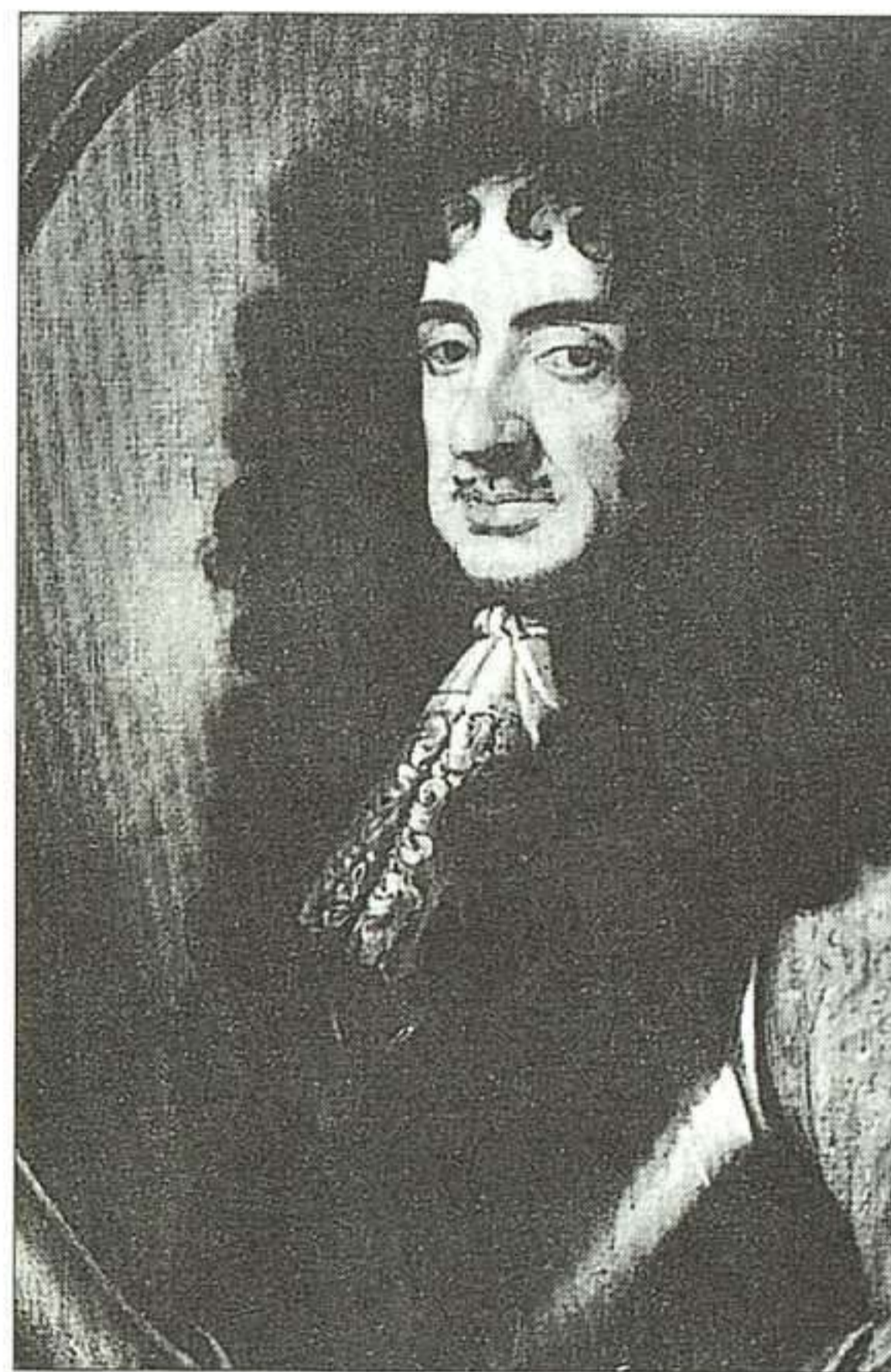
Retrato de Carlos II.

Dada la magnífica acogida que tuvo la obra, Defoe publicó dos continuaciones: The Farther Adventures of Robinson Crusoe (1719) y Serious Reflections During the Life and Surprizing Adventures of Robinson Crusoe (1720). Desde esta fecha hasta 1728, Defoe se