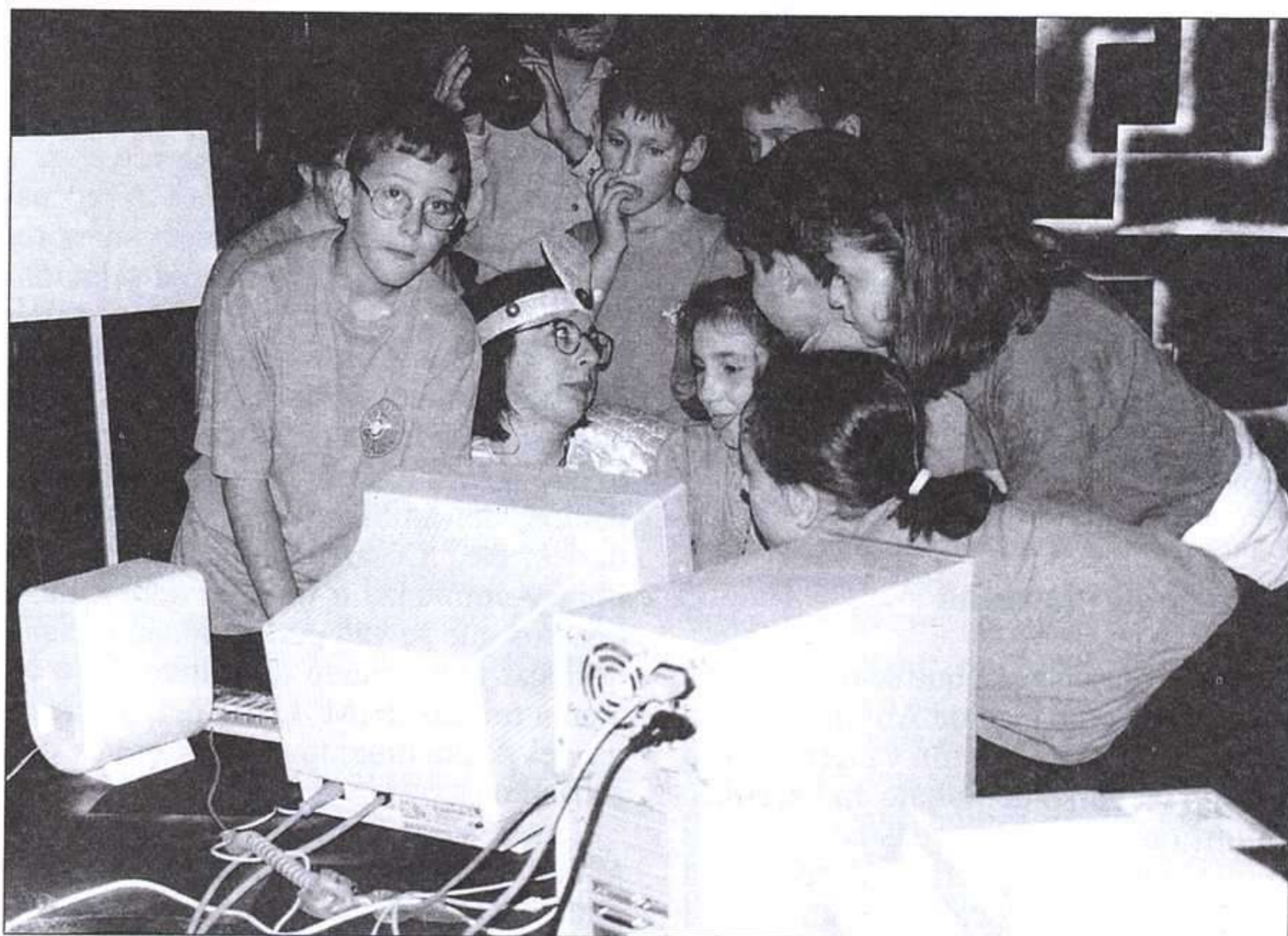
O mundo do futuro (El mundo del futuro).