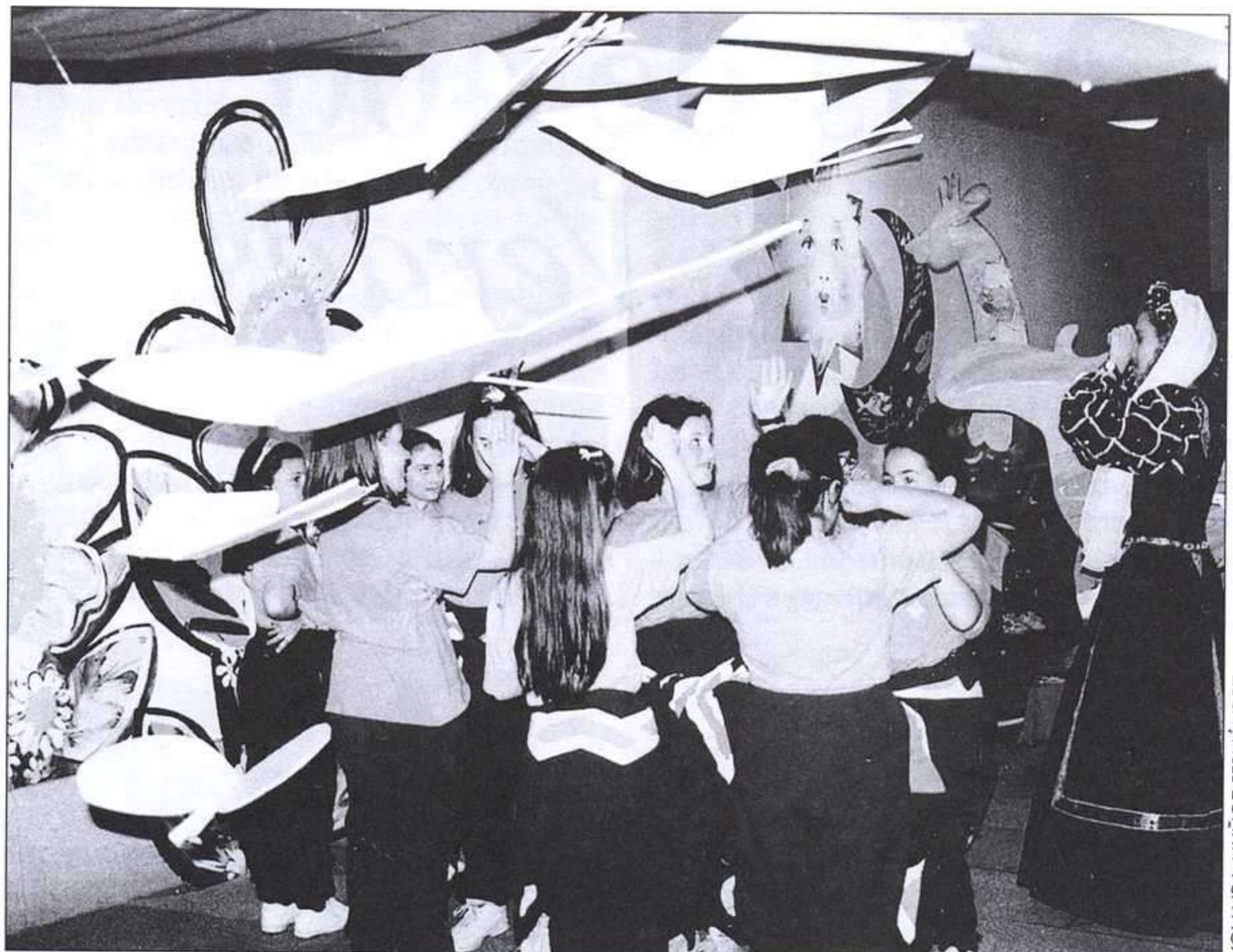
O mundo das fadas (El mundo de las hadas).

En este espacio, los visitantes se encontraron con unos grandes murales que representaban diferentes escenas de estilo oriental. Y es que en un lugar donde los males se curan con historias, no po-