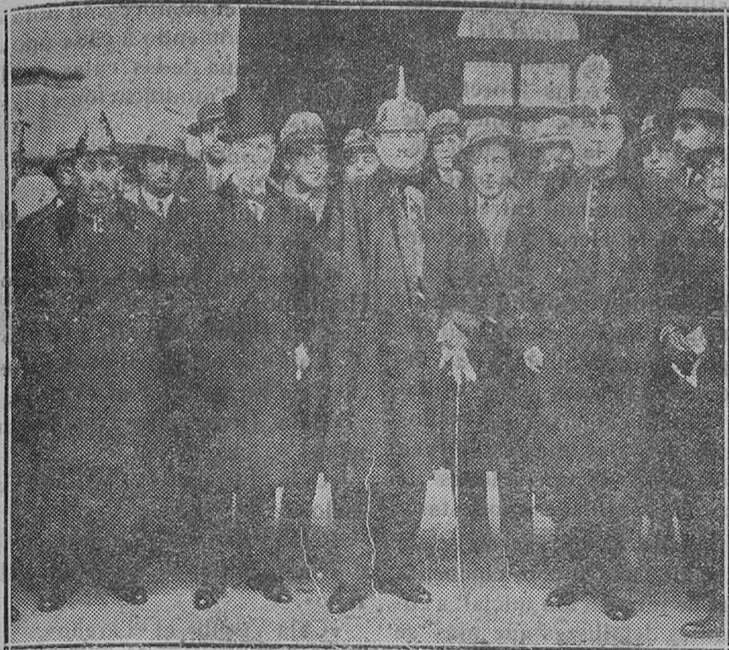
MADRID.—El general Berenguer saliendo de Palacio, con los ministros señores Matos, Montes Jovellar y Estrada

soslayar las mayores dificultades. Pero no se confía mucho en la consistencia del nuevo Gobierno de concentración. Estos Gabinetes en Francia y en todas partes, nacen con un defecto de origen y es la falta de una mayoría absoluta, del apoyo decidido del pueblo que es el que puede ayudar y lograr vencer los mayores obstáculos.