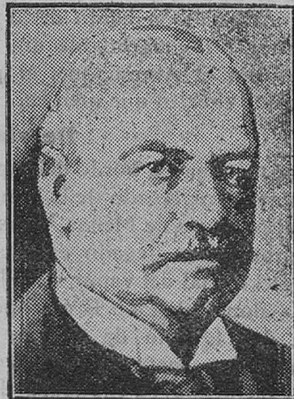
EXTRANJERO.— El Príncipe de Bülow, de cuyas Memorias se publica ahora el segundo volumen, al que se atribuyen sensacionales revelaciones históricas

Lo que podemos presumir es que muchos «tejones» habrán cortado esos árboles y habrán labrado esa