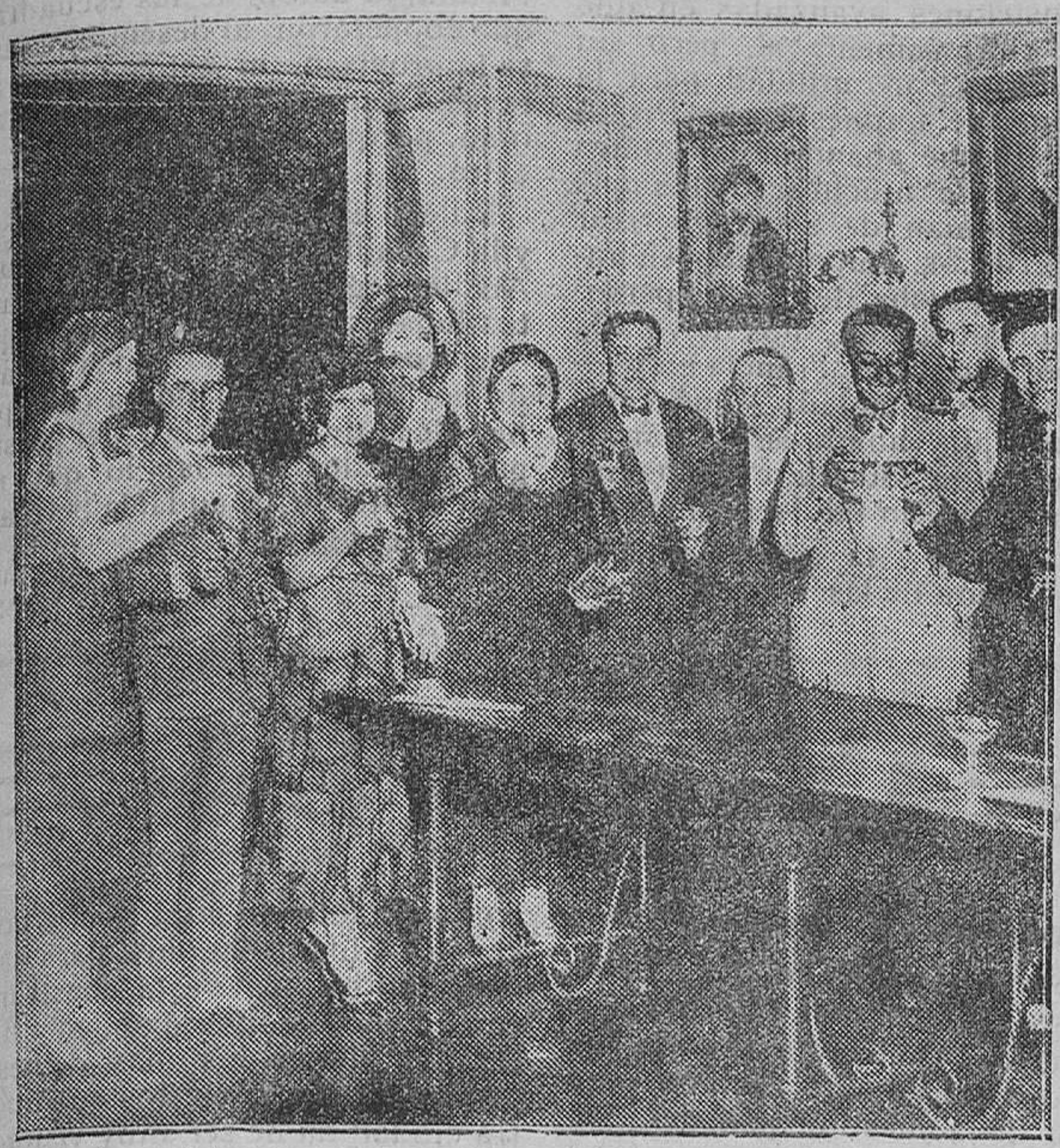
MADRID.—Los artistas que tomaron parte en la 200 representaciones de «La rosa del azahar» en el Retiro obsequiados con una copa de champagne en el Palacio de la Prensa