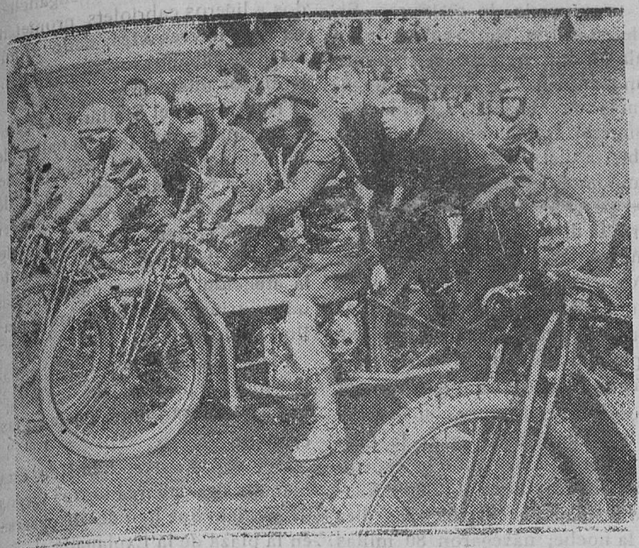
BARCELONA.—Inauguración de las carreras de Dirt-Track